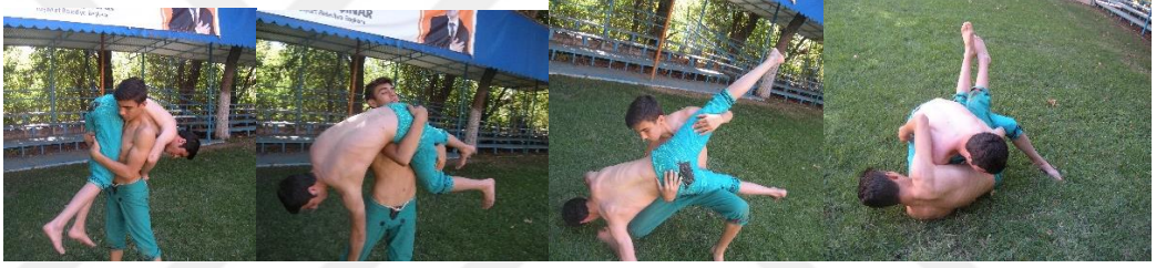
Şekil 6. Teyyare

Günümüzde havada tersi bulma tekniğine denk gelen teyyare oyunu Yeşilyurt bölgesinin rakibi yenici oyunlarının başında gelir.