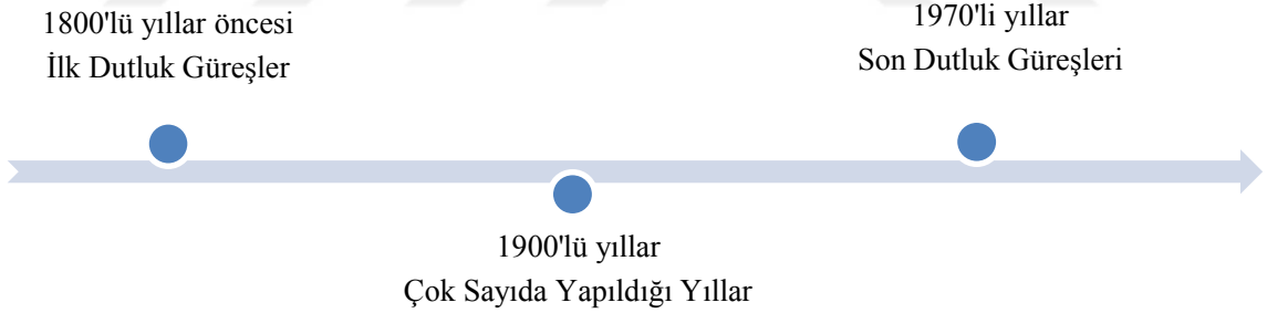
Şekil 7. Dutluk Güreşlerinin Tarihsel Akışı

Düğün deyince güreş, güreş deyince düğün akla gelen kelimelermiş. Yapılan araştırmamızda hiçbir yazılı kaynağa ulaşılamayan Dutluk Güreşlerine sadece yaşayan son temsilcilerin yaşadıkları baba ve dedelerin anlattıkları hikayelerdir. Yapılan röportajlardan Dutluk Güreşlerinin 1800 yılları öncesinin de yapıldığı söylene de birinci şahıslar yardımıyla daha öncesi hikaye ve rivayetlerden öteye gidememiştir. Yanlış bu güreşlerin yaşananlardan toplumda çok önemli bir sosyal faaliyetin yüzlerce yıl öteye gitmediği anlamına gelmemeli. Şuan yaşayan en küçük temsilcisi 62 yaşında