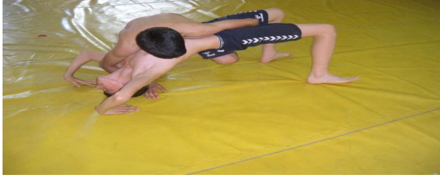
Şekil 5. Köprü

Rakibini yenmek için göbeğin güneşe dönmesi pozisyonu.