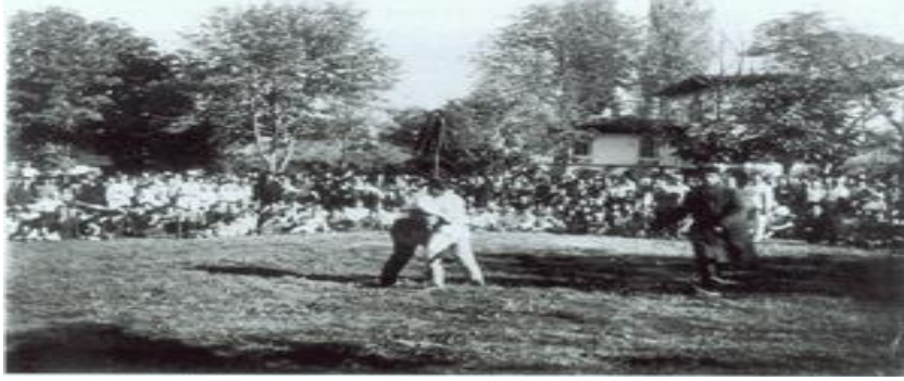
Şekil 8. Malatya ili Yeşilyurt ilçesinde yapılan dutluk güreşleri (1930-1935)

olan bu ritüelin geçmişi biraz net olmasa da yöntem ve usulleri röportajlarla ortaya çıkmıştır.