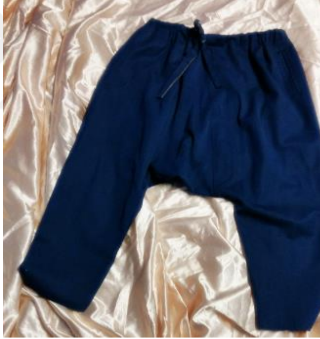
Resim 19: Şalvar