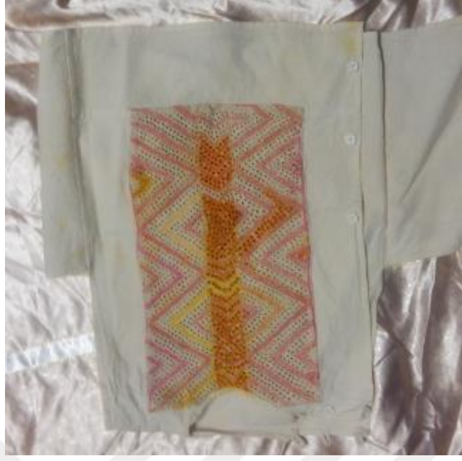
Resim 14: Kirpi okuyla desen verilen Gmlek