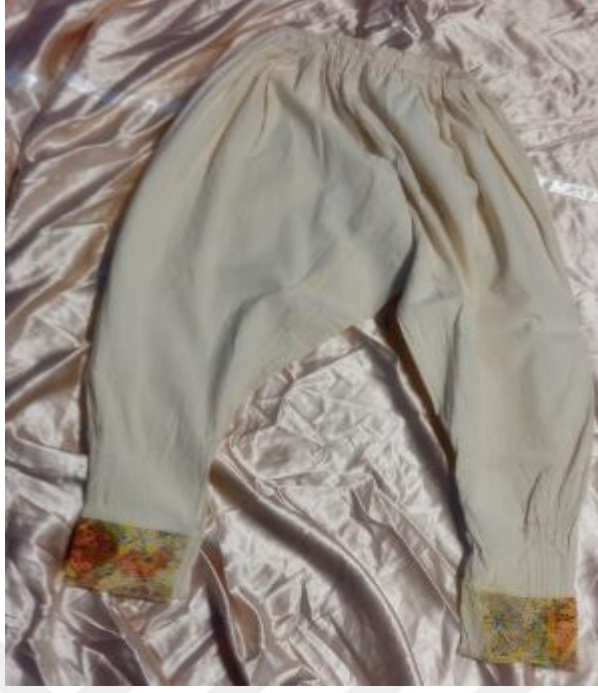
Resim 20: Bilek kısımları kirpi okuyla şekillendirilmiş Şalvar