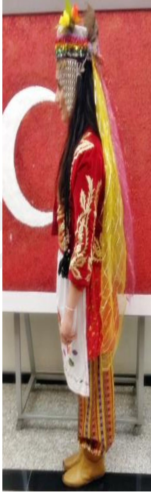
Resim 25: Musabeyli yöresi Kadın giysisinin sol taraftan görünümü