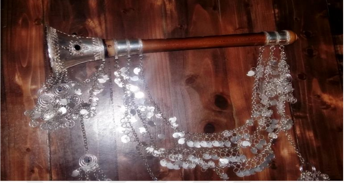
Resim 30: Gümüşlü Zurna