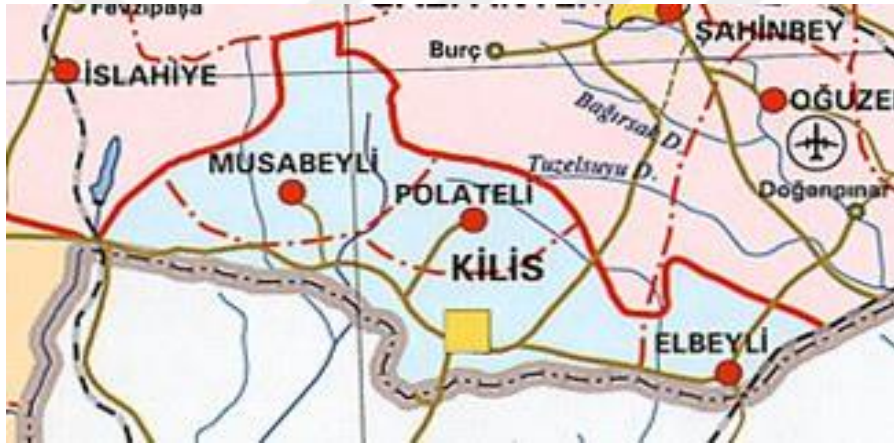
Resim 1: Kilis Haritası

Suriyeli mültecilerin bir kısmı Kilis de kurulan ‘‘Konteyner Kent’’ adını taşıyan prefabrik evlerde yaşamlarını sürdürmektedir. Bazı geliri yüksek aileler ise kent merkezinde veya ilçelerde yaşamlarını sürdürmektedirler.