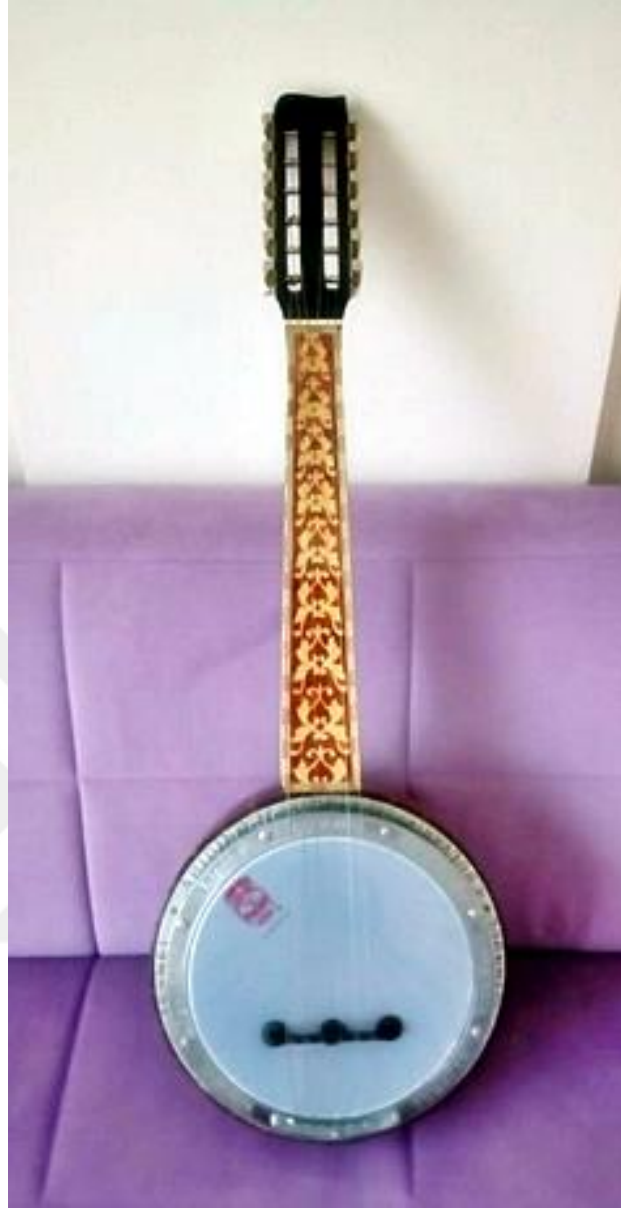
Resim 34: Cümbüş