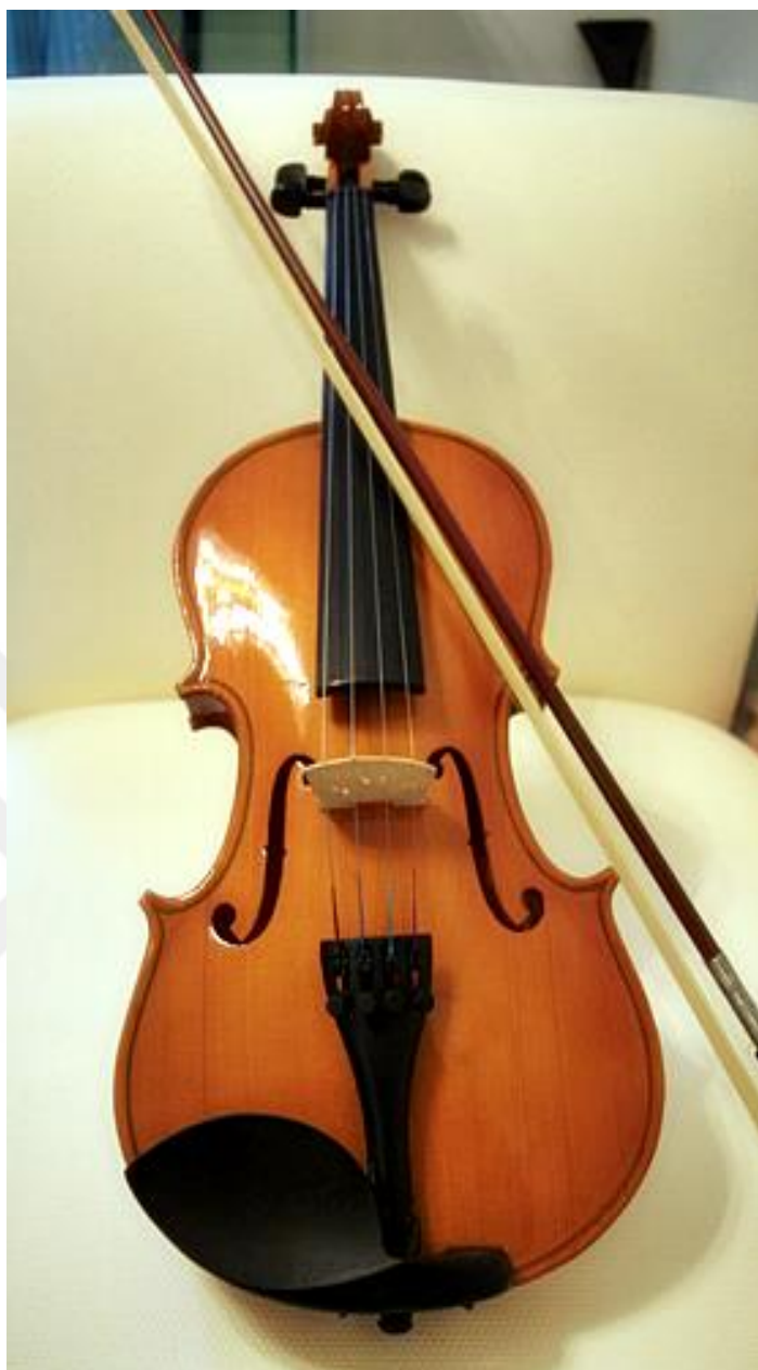
Resim 35: Keman