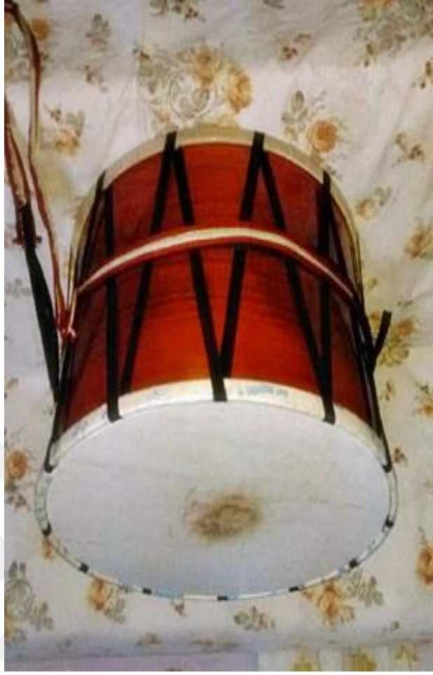
Resim 37: Asma Davul