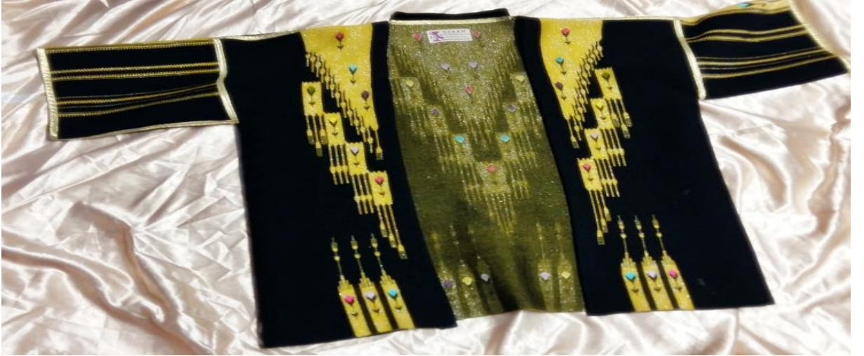
Resim 17: Siyah Aba