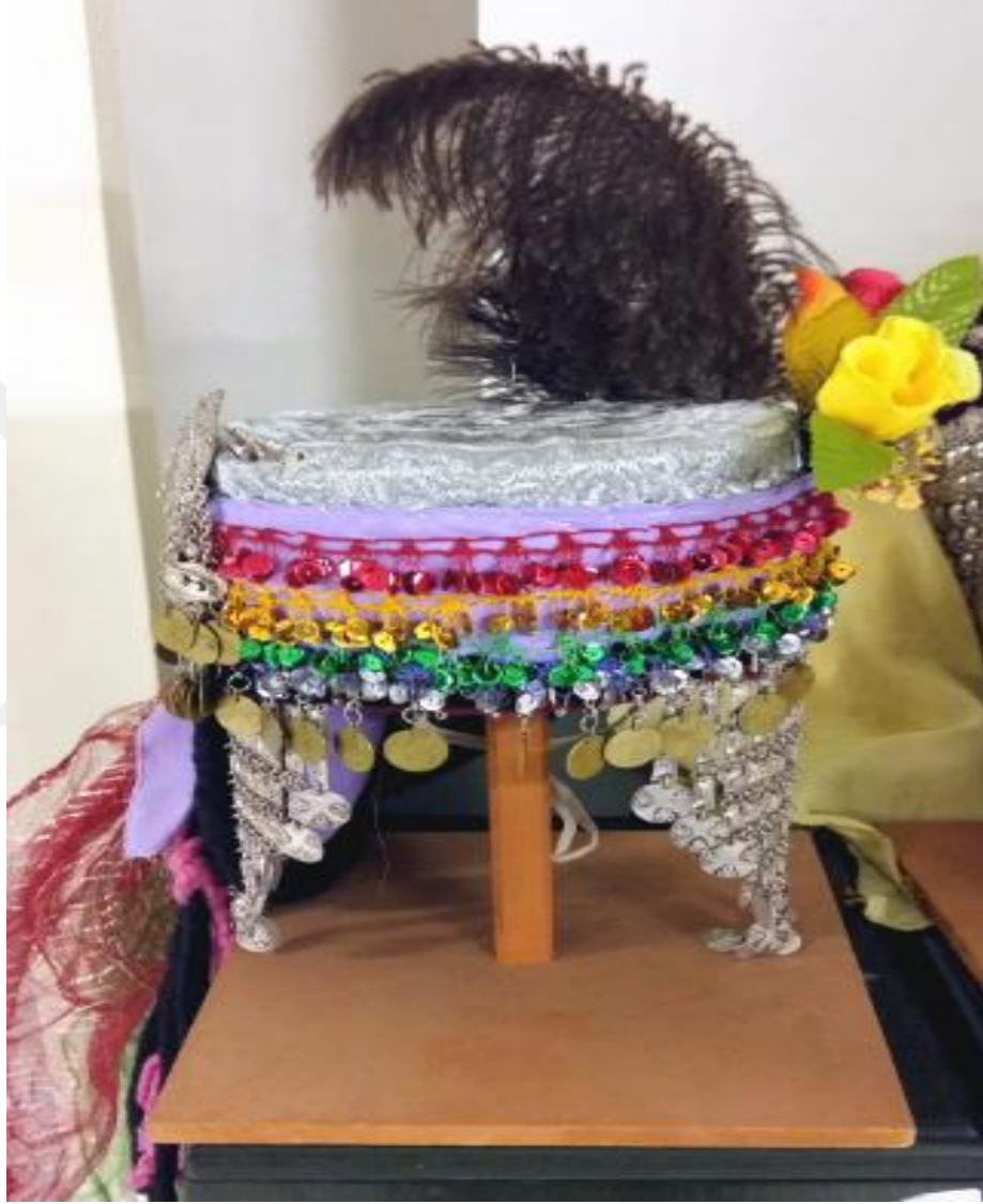
Resim 3: Sırmalı Fes

Ayak kısmında dokuma yn orap giyilir. Gen olanlar kırmızı yemeni, orta yařlar siyah yemeni, iftiler ise postal giymektedir. (Ercan.24.01.2018).