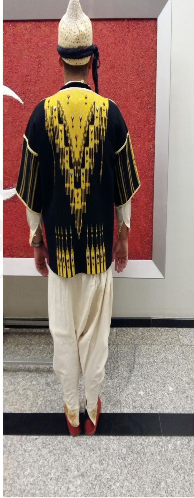
Resim 27: Musabeyli yoresi Erkek giysisinin arka taraftan görünümü