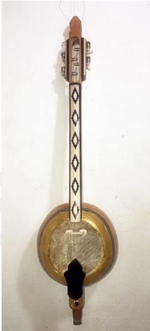
Resim 36: Kabak kemane