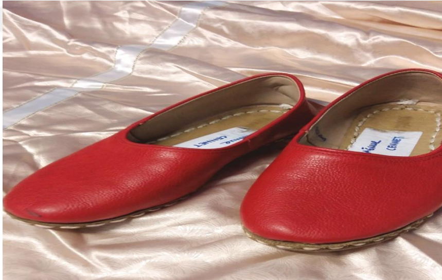
Resim 9: Yemni