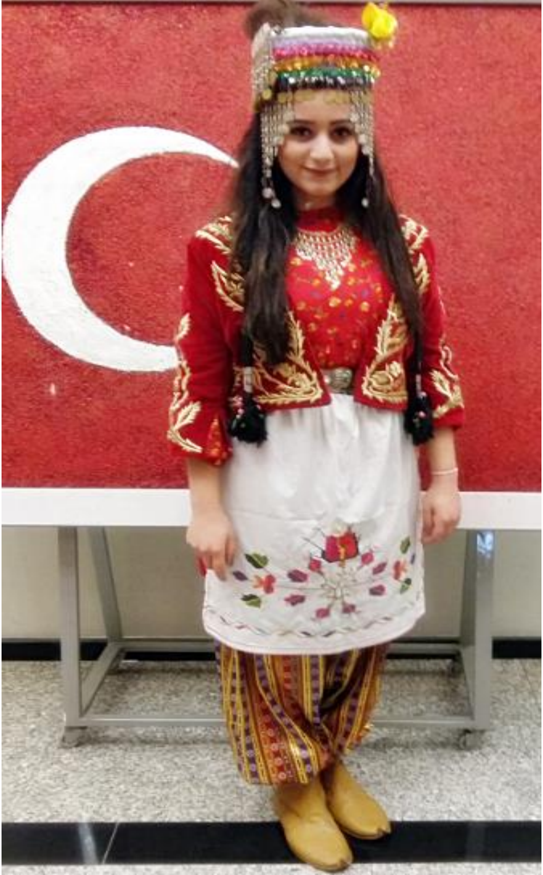
Resim 22: Musabeyli yöresi Kadın giysisinin ön taraftan görünümü