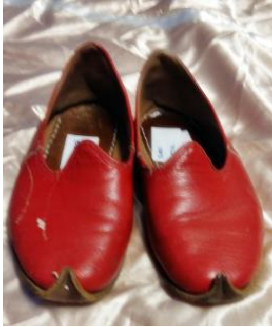
Resim 21: Kırmızı Yemeni