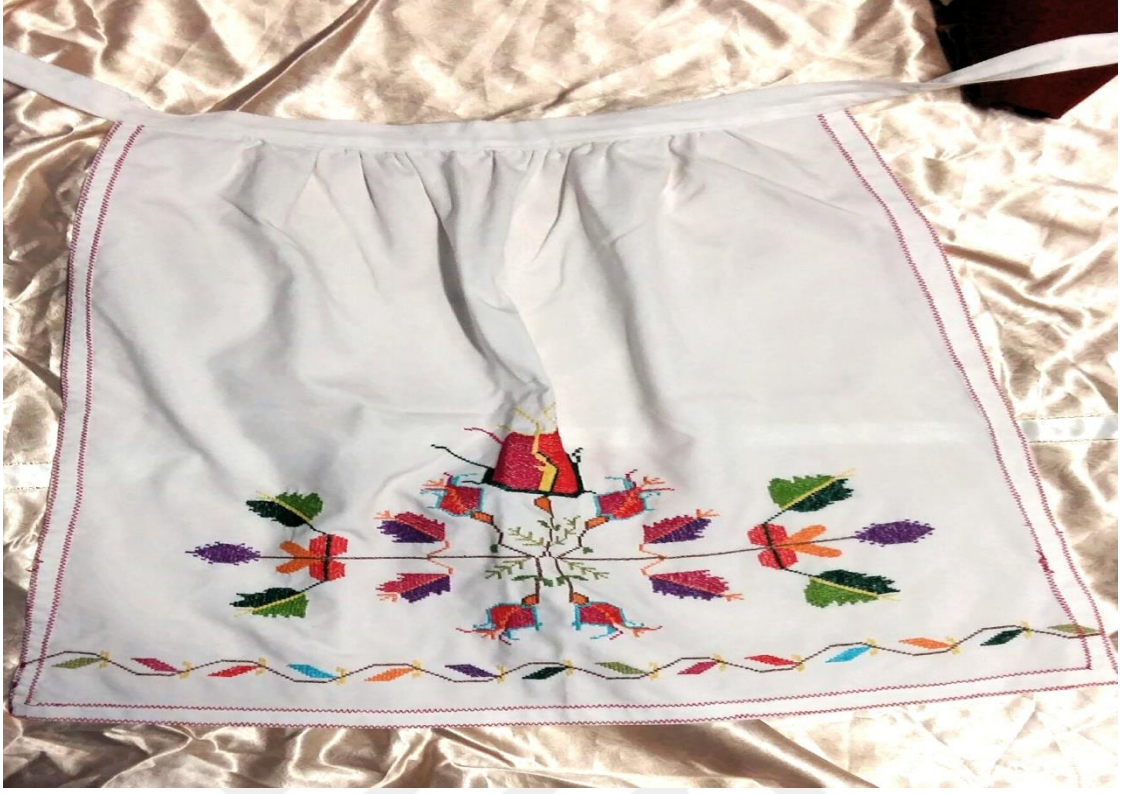
Resim 5: Önlük