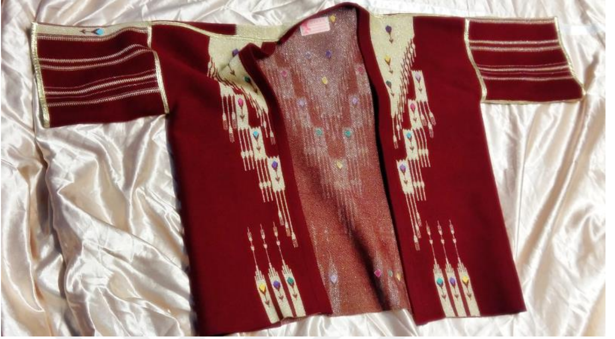
Resim 16: Kırmızı Aba