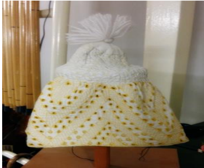
Resim 13: Terlik