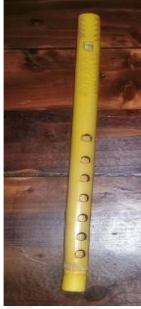
Resim 32: Kamıştan yapılan Ddk