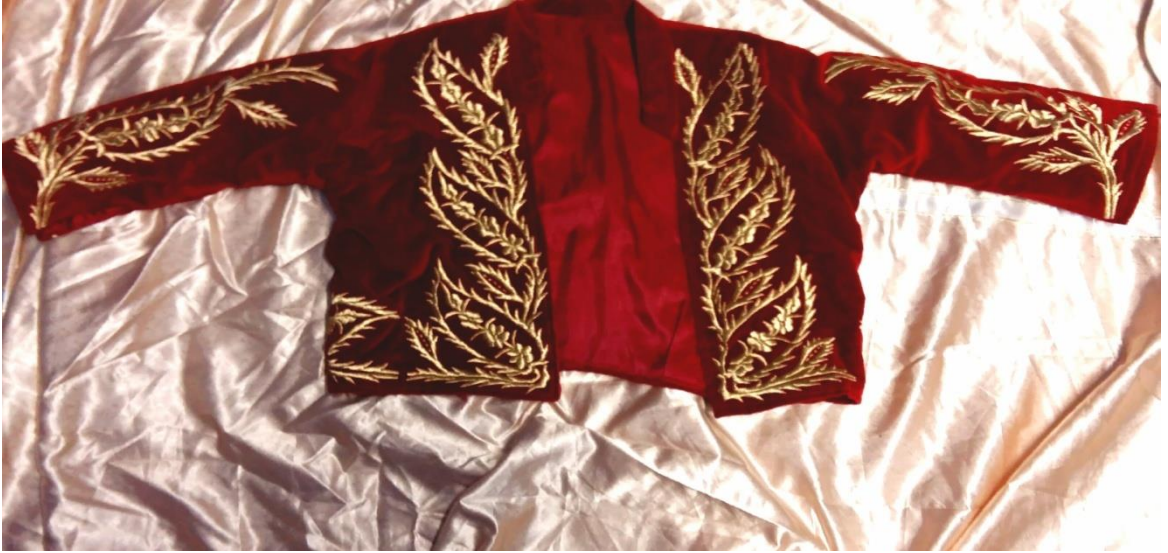
Resim 6: Ferhana