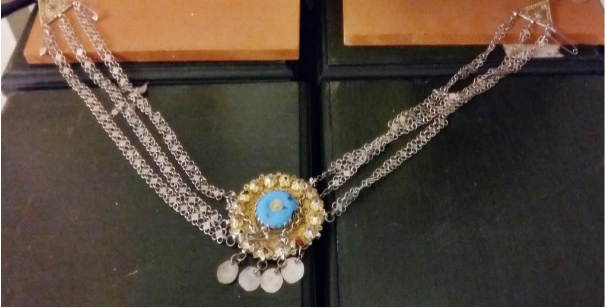
Resim 12: Gerdanlık