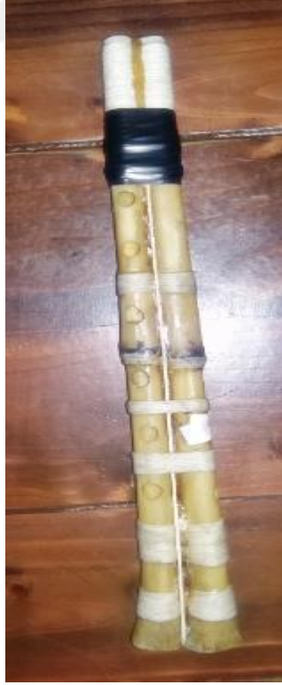
Resim 31: Kartal kanadından yapılan Zambır