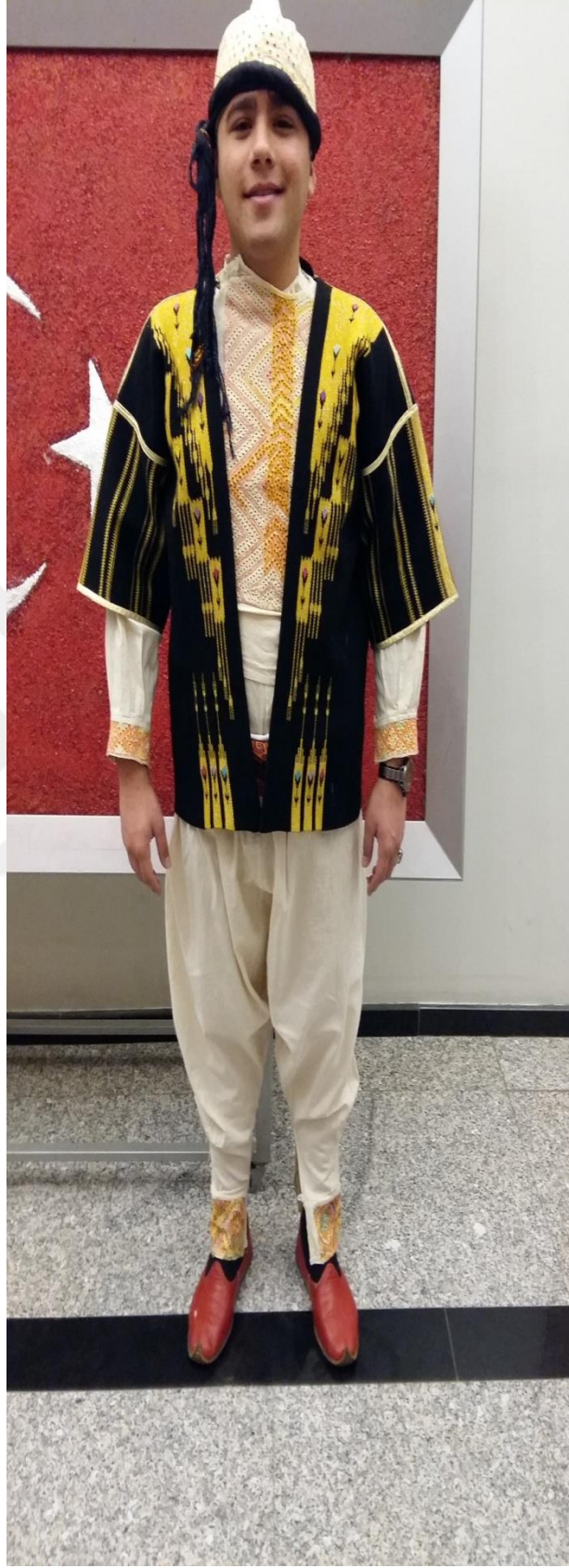
Resim 26: Musabeyli yöresi Erkek giysisinin ön taraftan görünümü