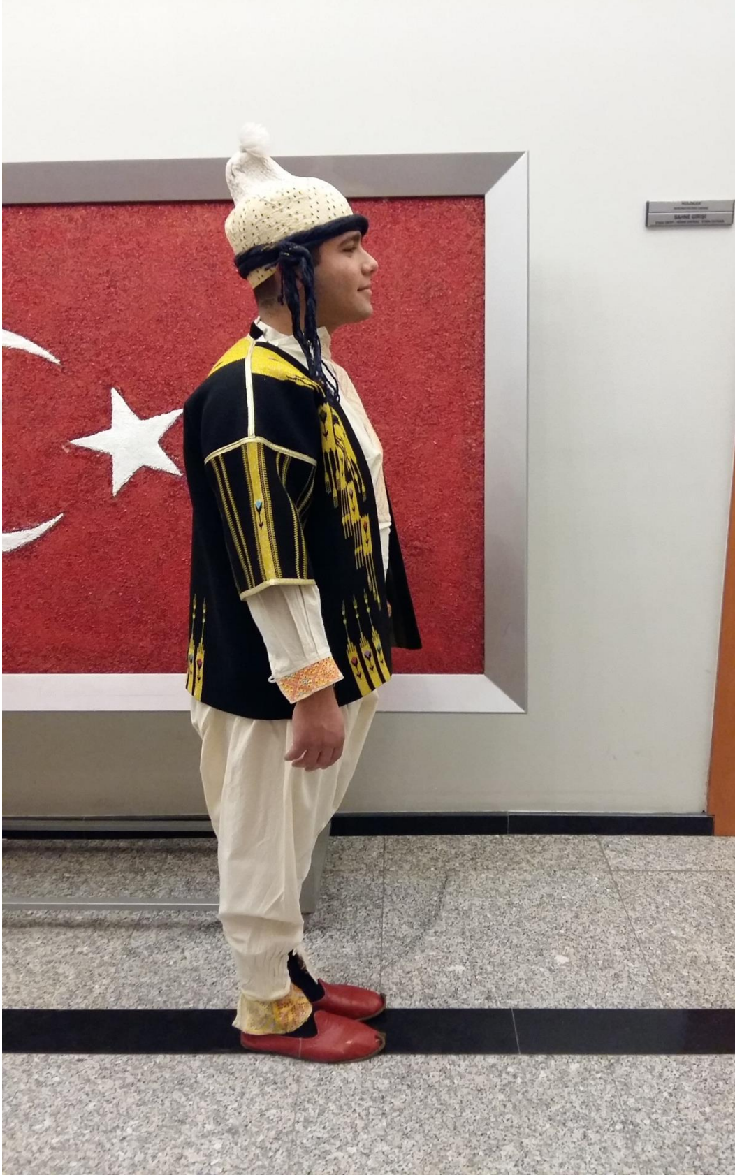
Resim 28: Musabeyli yöresi Erkek giysisinin sağ taraftan görünümü