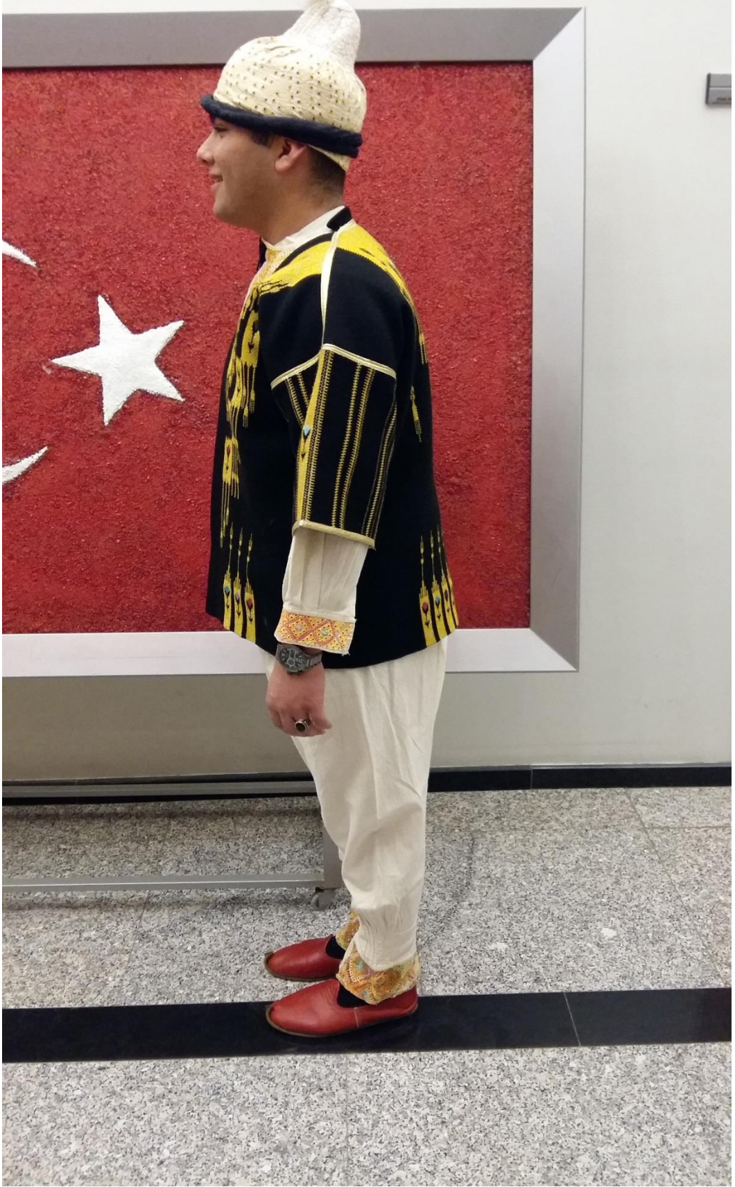
Resim 29: Musabeyli yöresi Erkek giysisinin sol taraftan görünümü