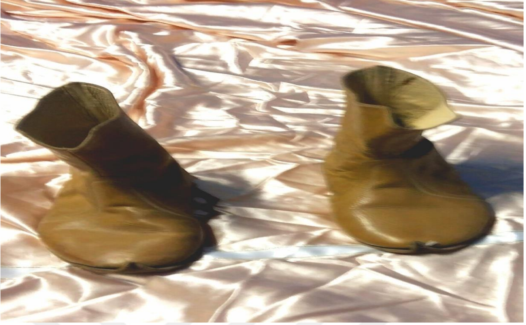
Resim 8: Edik