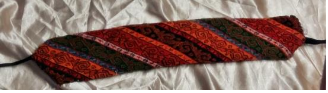
Resim 18: Dokuma Kuşak