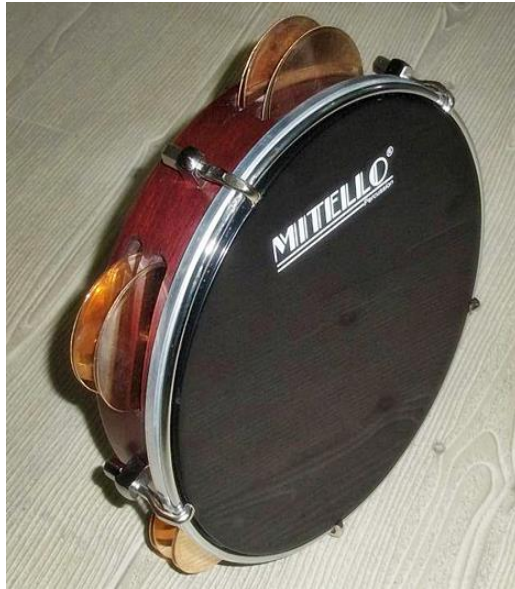
Resim 38: Zilli tef