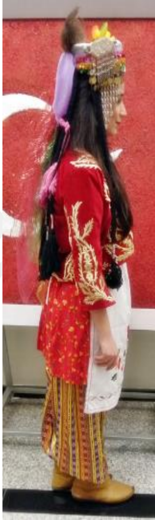
Resim 24: Musabeyli yöresi Kadın giysisinin sağ taraftan görünümü