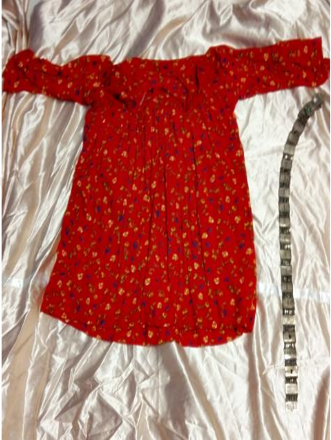
Resim 4: Fistan ve Kemer