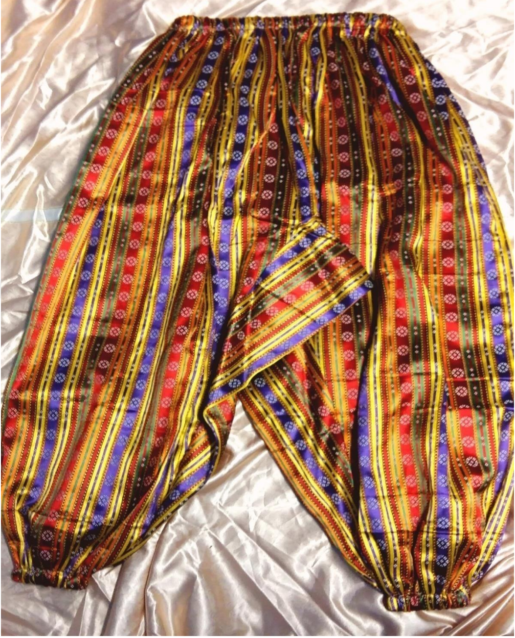
Resim 7: Kutlu Kumaştan Yapılan Dokuma Şalvar