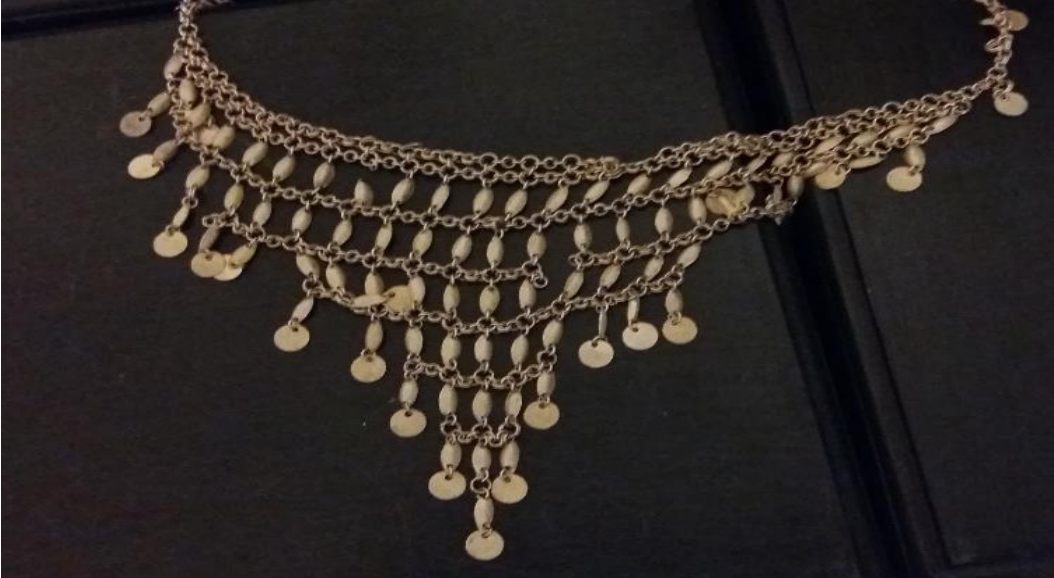
Resim 11: Gerdanlık