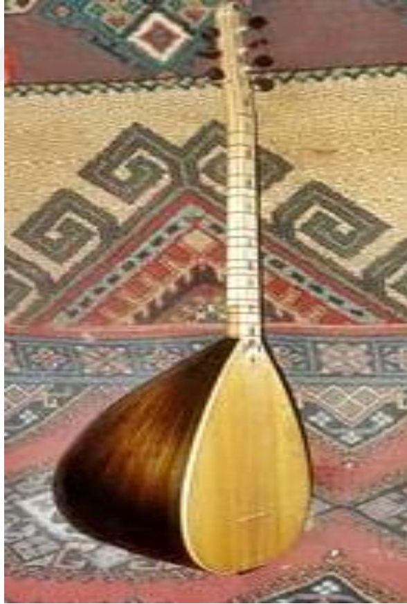
Resim 33: Baęlama