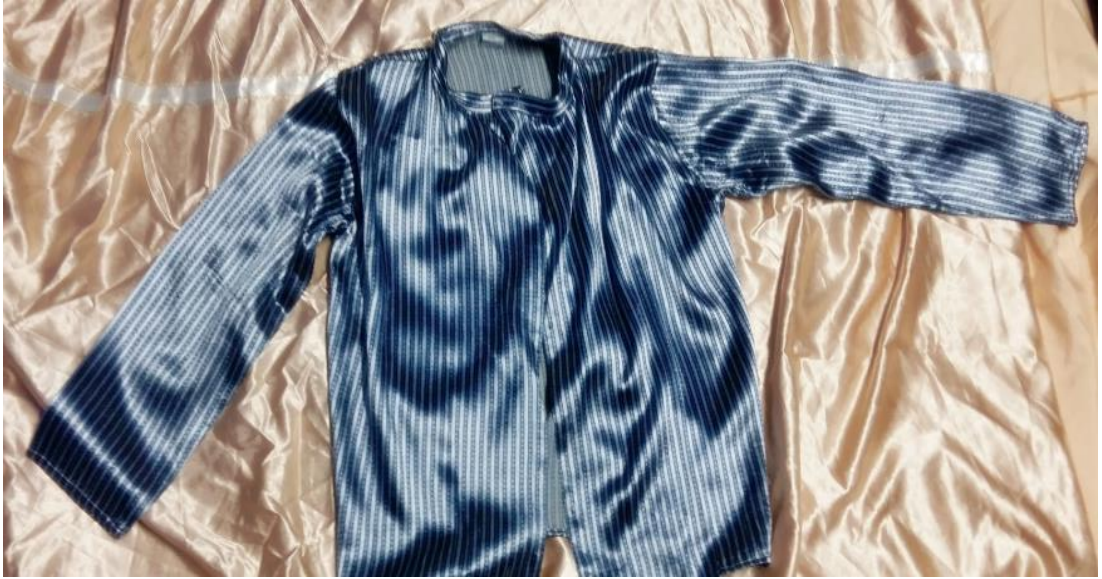
Resim 15: Kutnu kumařtan yapılan Gmlek