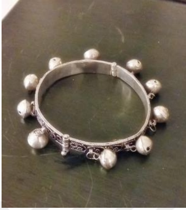
Resim 10: Halhal