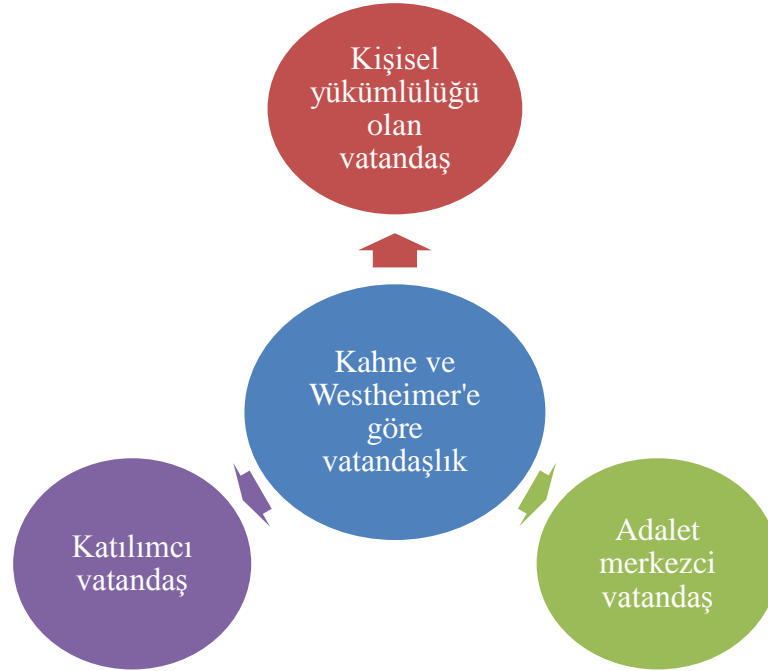
Şekil 2. Kahne ve Westheimer'e Göre Vatandaşlık Türleri

Pierson (2000), vatandaşlık sınıflandırmasında ulus devlette göre vatandaşlığın niteliklerini statü, haklar, görevler, eşitlik ve etkin katılım olarak aşağıda izah etmiştir: