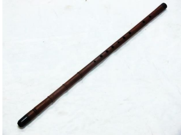
Resim 2.5. Günümüzde dilsiz kaval örneđi

Aynı doğrultuda kavala verilen bu adlandırmanın bu çalgıya yüzyıllar önce yakıştırıldığını belirten Tekşahin bu adlandırmanın tüm nefesli çalgılarda ortak bir kavramı içerdiğini savunmuştur (Tekşahin, 2011:3).