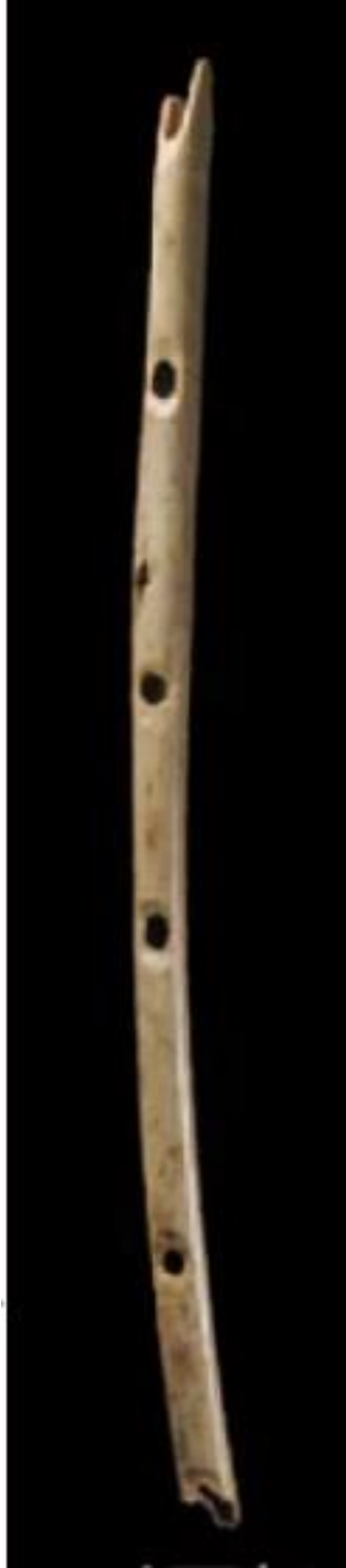
Resim 2.2. İlk Üflemeli Çalgı Örneđi