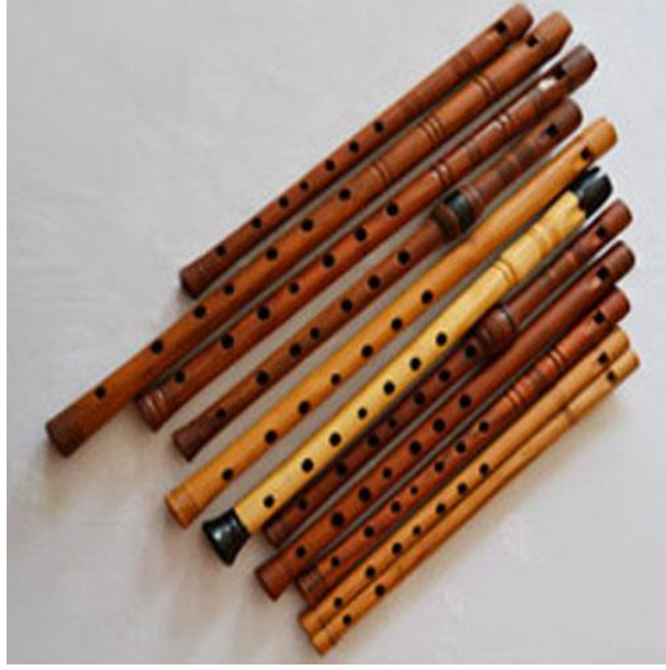
Resim 2.4. Günümüzde dilli kaval örnekleri

Dijital kaynaklara göre ise: Sibuzgu, sebezğu, sıvzğa, bırğa, burğa, borğu, tütek (düdük) gibi adlar ile anılıp çalınan düdüklere genelde SİPSİ adı verildiğini söylemektedir. Eski Türklerin avlanma konusunda oldukça başarılı olduklarından yola çıkarak kaval benzeri ses çıkaran aletleri avcılıkta kullandıkları düşünülmektedir. Bunlardan özellikle dişi geyik sesine benzer bir ses elde ederek avcılıkta erkek geyiklerin dikkatini çekmekte kullandıklarını özellikle belirtmektedir ( http://www.turkuler.com/thm/kaval.asp ).