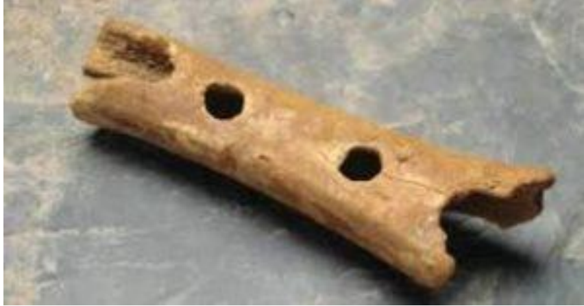
Resim 2.1. İlk Üflemeli Çalgı Örneği

İlk insanların çeşitli iklim koşullarını, hayvan seslerini ve daha bir çok doğada bulunan ve dikkatlerini çeken sesleri taklit etmek yoluyla müzikle tanıştıkları düşünülebilir. Üflemeli çalgıların da insan oğlunun çeşitli hayat tecrübeleri sonucunda ortaya çıkmış ve ilerleyen süreçte gelişim sergileyerek günümüze kadar ulaşmış olduğu söylenebilir. Kaval çalgısı da bu çalgılardandır. Kaval çalgısının dünyanın her yerinde farklı isimlerle adlandırılın fakat benzer özellikler sergileyen yakın akrabaları mevcuttur. Kaval sazının oluşumu, gelişimi ve günümüzdeki mevcut durumuna yönelik bazı tespitler sıralanacak olursa;