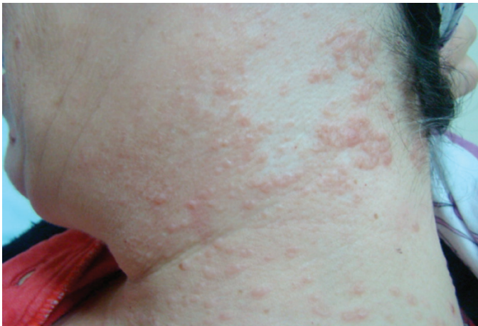
Resim 2. Boyun yan kısmındaki lezyonlar