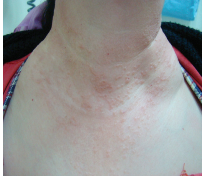
Resim 3. Boyun V'sindeki lezyonlar