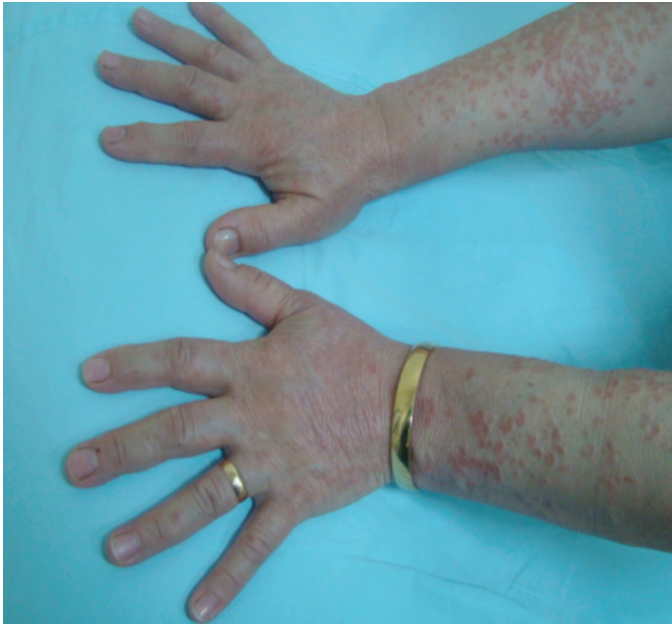
Resim 1. El sırtları ve önkol dış yüzlerindeki lezyonlar

yüzüne yayılan, deriden kabarık, boyutları 5 mm ile 2 cm arasında değişen, bazıları annüler karakterde olmak üzere, eritemli papül ve plaklar gözlemlendi (Resim 1-3). Laboratuvar tetkiklerinde; sedimentasyon hızı 40 mm/saat, glukoz 256 mg/dL ve HbA 1c %7,94 olarak tespit edildi. Histopatolojik incelemede; epidermiste ortokeratoz, fokal parakeratoz, üst dermiste dejenere kollajenöz alanı çevreleyen ve palizatlanan histiyositler, dev hücre varlığı ve perivasküler lenfosit infiltrasyonu gözlemlendi (Resim 4). Mevcut klinik ve histopatolojik bulgularla GA tanısı konan hastaya, oral antihistaminik ve potent topikal steroidler 2 hafta boyunca geceleri oklüzyon şeklinde uygulandı. İntralezyoner steroid (5 mg/mL triamsinolon asetonid) tedavisi de eklenen hastanın lezyonları 2 hafta içerisinde gerilemeye başladı. Glukoz regülasyonu için 3 yıldır gliklazid kullanan hasta, endokrinoloji bölümü ile konsülte edildi ve tedavisine metformin eklendi.