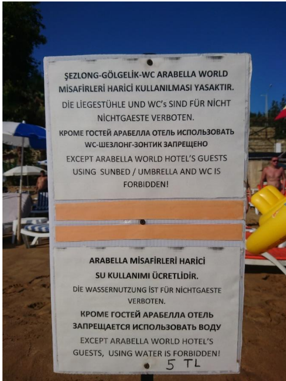
Fotoğraf. 23: Arabella Otel'in Çitlediği Kumsala Diktiği Uyarı Panosu (17.06.2018)

Avsallar'da otel ve sitelerin çitlediği alanlar dışında halkın denize girebileceği, güneşlenebileceği, üç alan kalmaktadır. Bunlar İncekum Tabiat Parkı'ndaki plajlar, çok küçük bir alan olsa dahi boş kalan kumsallar ve beachlerdir 34 . İncekum Tabiat Parkı'ndaki plajlara girebilmek için girişte ücret ödememiz gerekmektedir 35 . Parkın