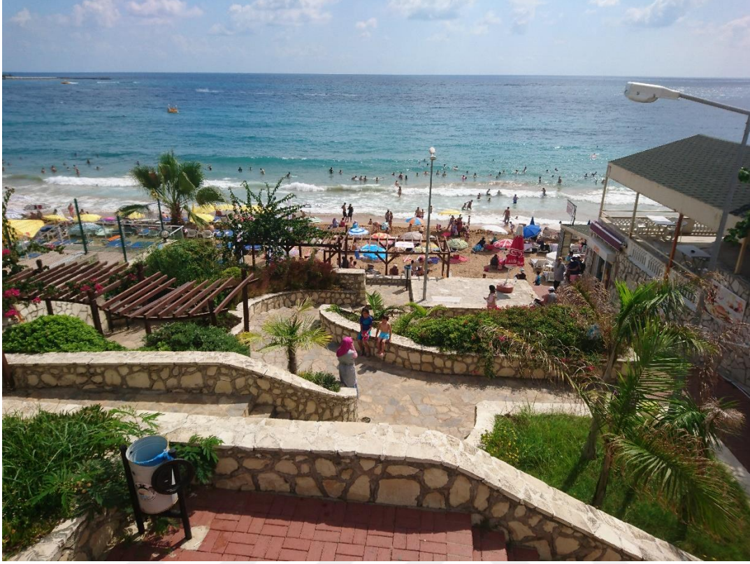
Fotoğraf. 27: Yat Pansiyon İle Tawa Tampa Beach Arasında Kalan Alan 40

Emekli bir Mahalle sakini Avsallar'da denizle yüzmek dışında kurduğu ilişkiyi şöyle anlatıyor: