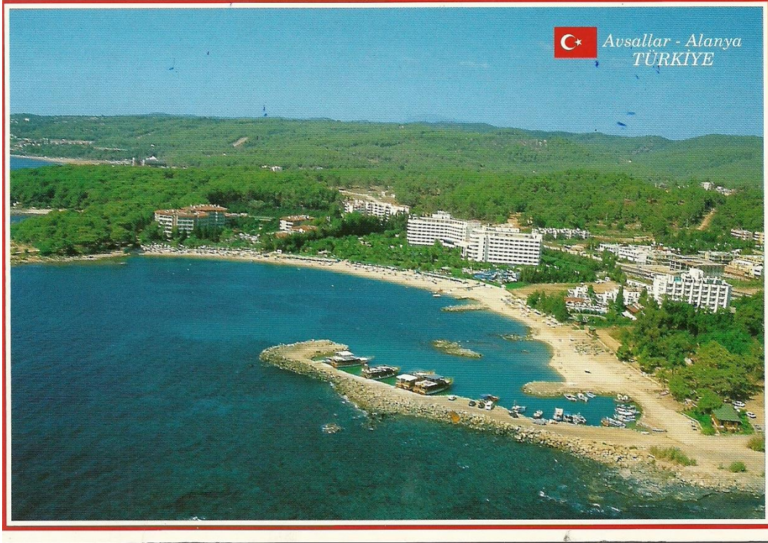
Fotoğraf. 3: Avsallar’ın Yeşil Zamanlarını ve Eski Balıkçı Barınağını Gösteren Bir Kartpostal 16

Bu set içinden sahillere ise beş adet dar ara sokaktan ulaşılır. Ancak bu sokaklar daha çok halkın denize ulaşmasından ziyade otellerin ve sitelerin kendi aralarındaki sınırları belirlemektedir. Bu sokaklar Mahalle sakinleri için birer müşterek olmaktan çıkmıştır neredeyse. Öyle ki çalışma sürecince Avsallar’da yıllarca yaşayıp bu sokaklardan haberi olmayan onlarca insanla karşılaştık. Ayrıca eskiden var olan ancak şu anda yok olan sokaklar vardır. Bu sokaklar oteller tarafından çitlenmiş ve ortadan kaldırılmışlardır. Başlı başına bir müşterek olan sokakların yine kıyı müşteregi olan sahillere ulaşması gerekirken otellerce çitlenerek ortadan kaldırılması ya da peyzaj çalışmalarıyla oradaki otele ait bir mülkmüş gibi gösterilmesi toplumsal, çevresel eşitsizlik üretir. Bu çitlemeler sonrasında doğal varlığa erişim kısıtlanır. Özellikle Rubi Platinium Otel ile İncekum Tabiat Kampı arasında bulunan sokaklar ve kumsallar neredeyse tek bir otel müşterisi olmayan kullanıcı 17 tarafından kullanılamamaktadır. Beş yıldır Avsallar’da yaşayan G 15 “bu alanda hiç denize girdin mi?” sorumuzu “oraya