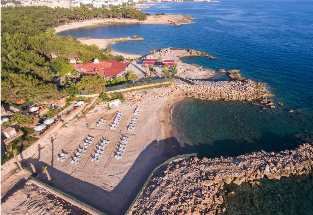
Fotoğraf. 31: Misa Grup’un Modern Saraylar Adlı Otelini Çitlediği Kadınlar Plajı