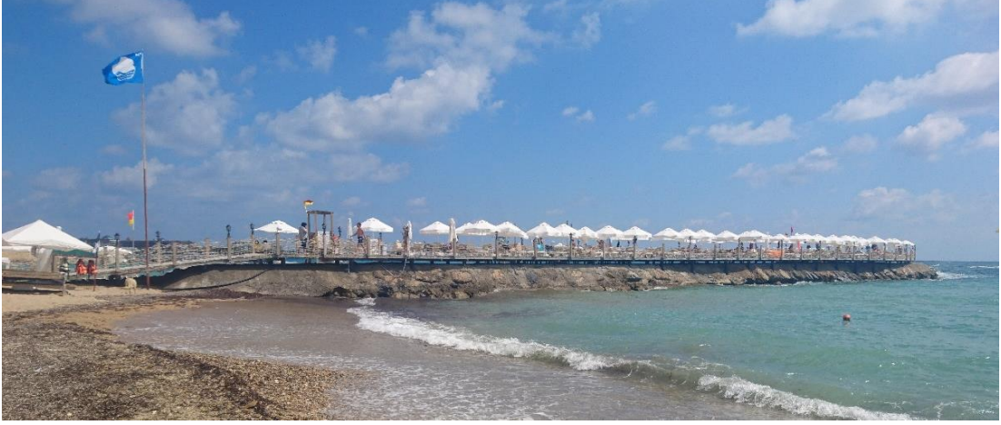
Fotoğraf. 19: Azura Delux'un Yaptığı Dev İskele (17.06.2018).

Otellerin çitleme faaliyetlerini güçlendiren bir olgu olan bu iskeleler deniz içine doğru oluşturdukları koridorlarla deniz içinde de kendilerine sınırlar belirliyorlar. Baştan sona tüm detaylarıyla çevresel sorun olan bu iskeleler müşterek üzerine bir tür kalıcı yapı kurularak toplumsal eşitsizlik üretmektedir.