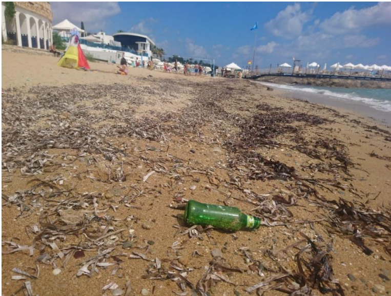
Fotoğraf. 24: Çitlenmeyen Kısıtlı Alanlar Düzenli Olarak Temizlenmiyor (17.06.2018)