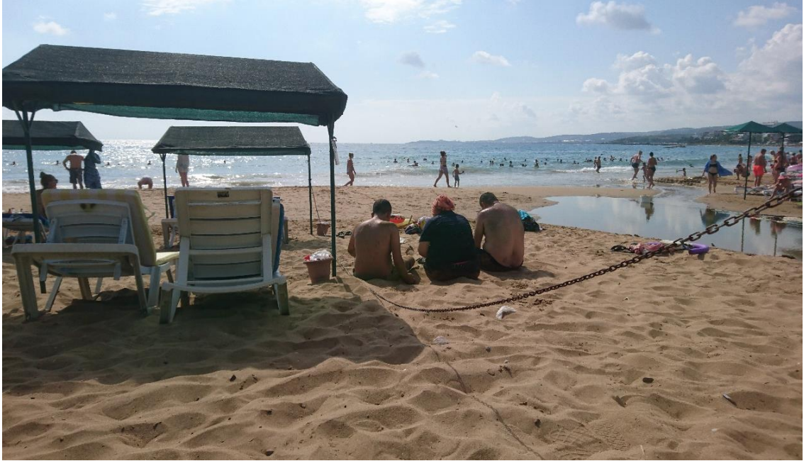
Fotoğraf. 15: Çitlerin Dışında Kalarak da Plajın Ötekisi Olmak (17.06.2018)

Avsallar’da sınıf bilincine sahip olmayan müşterek kullanıcıları toplumsal müştereklere sahip çıkma meselelerinde örgütlenmeleri ve örgütlü bir şekilde mücadele etmeleri güçtür. Ancak Türkiye’nin çeşitli yerlerinde kıyı müşterekleri üzerinde yapılan bu tür çitlemelere artık belirli toplumsal tepkiler verilmektedir. Bu tepkilerden iki tanesi de bu tezin yazıldığı esnada Avsallar’a ortalama 30 km uzaklıkta olan Manavgat’ın Kızılağaç Mahallesi’nde verilmiştir. Manavgat’a bağlı beş mahalleden oluşan yaklaşık 100 kişilik bir grup bir araya gelerek önce bir basın açıklaması yapmış sonrasında