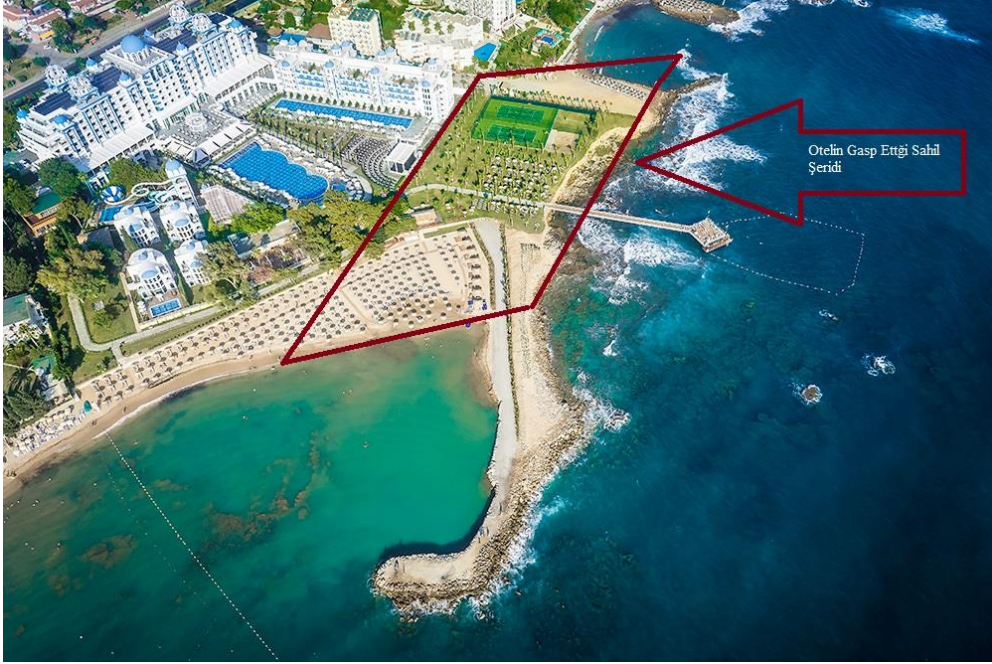
Fotoğraf. 8:Rubi Platinum ve Kolibri'nin Çitlediği, Yıkımı Gerçekleşen Alan

değillerdir. Avsallar Mahallesi'nin denize açılan en önemli sokaklarından İskele Sokağı tamamen çitleyen bu oteller bir anda meselenin mağduru olabilmışlerdir. Bununla birlikte hem suçlu hem de güçlü olduklarını bu yıkımdan sadece üç ay sonra her şeyi eski haline getirerek göstermişlerdir.