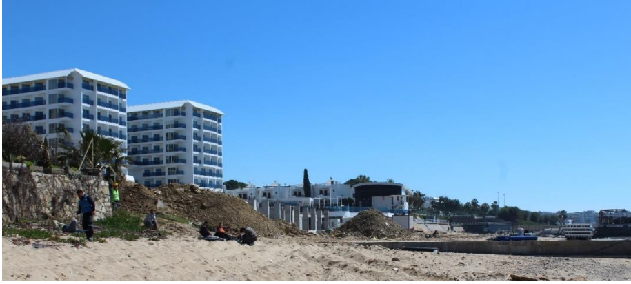
Fotoğraf. 14: Granada Otel'in Şantiyeye Çevirdiği Kumsal Alanı (17.03.2019)