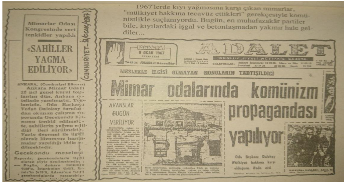
Fotoğraf. 1: Dalokay’ın Konuşmasından Bir Gün Sonra Konuyla İlgili Haber Yapan İki Gazetenin Çok Farklı Pencerelerden Yaptığı İki Haber Küpürü

Son olarak durumun ciddiyetini çok uzun yıllar önce gören Ankara Mimarlar Odası Başkanı Vedat Dalokay’ın 1967 yılının Ocak ayında kurduğu cümlelerden anlamak mümkündür: “Bugün bütün turistik değerdeki arsa ve araziler ile sahillerimiz büyük bir yağmaya hedef tutulmuştur. Ve yarın denizde boğulma tehlikesi geçirecek bir Türk vatandaşı, karaya çıkarabileceği, kamuya açık bir sahil parçası bulamayacaktır” (Ekinci, 1994: 7-11).