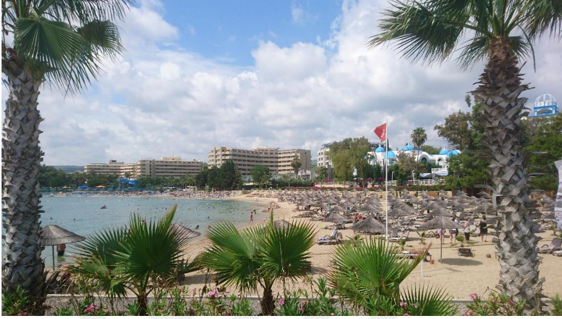
Fotoğraf. 12: Girilmesi Güç “Özel Plajlar” (17.06.2018)

Avsallar’da her ne kadar sahiller otellerin, kafelerin ve özel sitelerin şezlonglarıyla dolu olsa da istediğiniz yere havlunuzu serip denize girebilirsiniz. Ancak hem zaten oldukça dar olan kumsalın olması gerekenden fazla şezlongla doldurulmasıyla bu durum güçleşir hem de otel müşterilerinin ve güvenliklerinin rahatsız edici bakışlarıyla kendinizi o mekânın “ötekisi” hissedersiniz. Otel müşterilerinin “onlardan olmayanı” tanıdıkları bileklikli sistemde eğer otel müşterileri gibi bilekliğe sahip değilseniz onlarla aynı kumsalı kullanmak size şüpheli gözlerle bakmalarına sebep olmaktadır. Yine kumsalları tek tipleştirilen aynı renk şezlong minderleri ve şemsiyeler mekânda ötekileştirmeyi kolaylaştıran bir diğer etkidir.