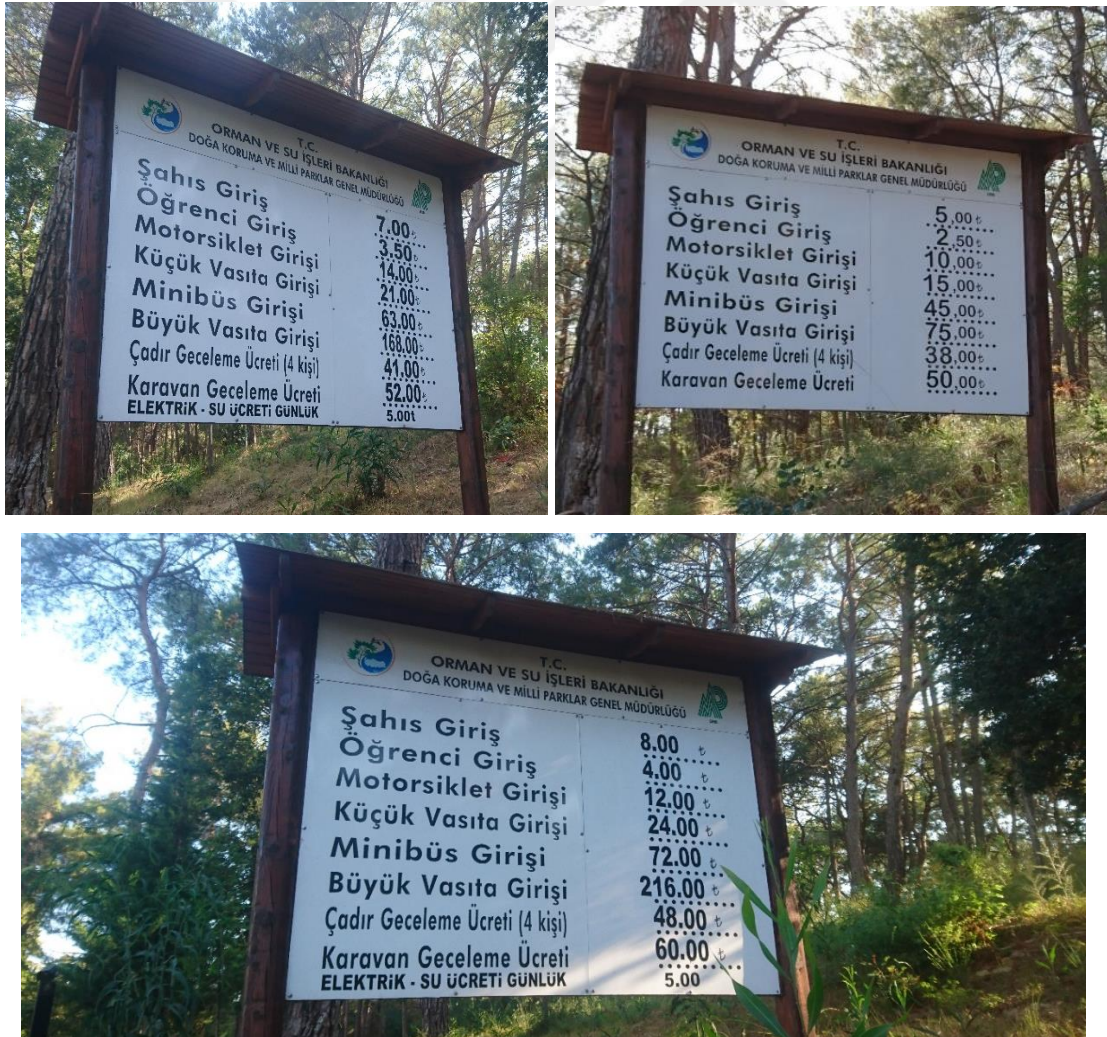
Fotoğraf. 32: İncekum Tabiat Parkı'nın 2017, 2018 ve 2019 Yıllarına Ait Giriş Tarifeleri (Sol Üstteki Resim:01.02.2018, Sağ Üstteki Resim: 22.07.2018, Altteki Resim: 18.07.2019)

olmayanlar arasında eşitsizliğe neden olur. 8 TL ayda yılda bir defa buraya erişebilen bir kullanıcı için önemli bir meblağ olarak da görünmeyebilir. Ancak Avsallar Mahallesi sakinlerinin günlük yürüyüşlerini, sporlarını ve diğer tüm fiziksel ve ruhsal aktivitelerini gerçekleştirebileceği bu alana ödeme yoluyla girmek hatırı sayılır bir meblağ tutmaktadır. Haftanın 20 günü kapınızın önündeki ormana ulaşmanın bedeli 160 TL tutmaktadır. Çadır ücretleri açısından bakıldığında ise dört kişilik konaklama açısından fiyatlar Akdeniz kıyılarında kamp yapılan diğer alanlarla karşılaştırıldığında uygundur. Ancak tek kişiyeniz de bu ücreti ödemeniz gerekmektedir. Tek kişilik ortalama kamp geceleme ücreti 25 TL iken diğer yerlere göre ücret neredeyse yüzde yüz daha pahalıdır. Ayrıca bu alanda tuvaletler, lavabolar oldukça kirli, hijyenden uzak ve bakımsızdır.