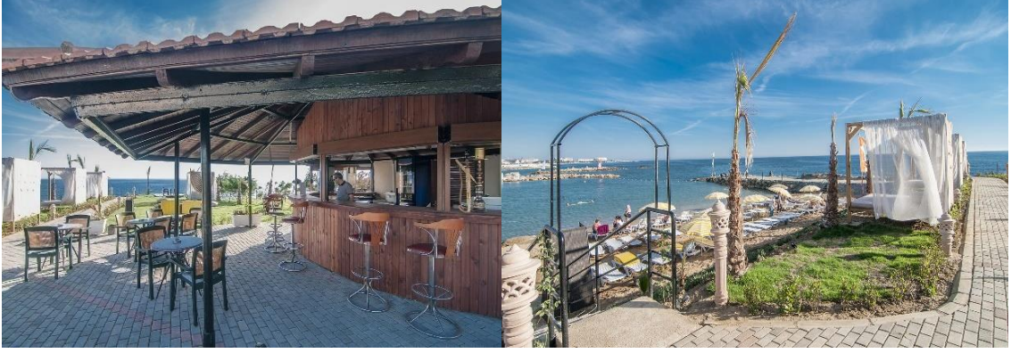
Fotoğraf. 7: Kolibri Hotel'in Yıkımdan Önce Çitlediği Bazı Alanlar