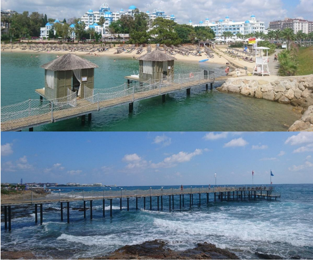
Fotoğraf. 17: Rubi Platinum Yaptığı Çardaklı Lüks İskele ve Otelin Diğer İskelesi (17.06.2018).

Kıyılara inşa edilen bu iskeleler her şeyden önce denizin doğal yapısını bozmakta ve çevresel kirlilik üretmektedir. Bilemediğimiz onlarca belki de yüzlerce deniz canlısının yaşamını tehlikeye sokmaktadır. Özellikle inşa süreçlerinde denizler ciddi miktarda kirlenmektedir. Doldurularak inşa edilen iskeleler denizi tam anlamıyla tam