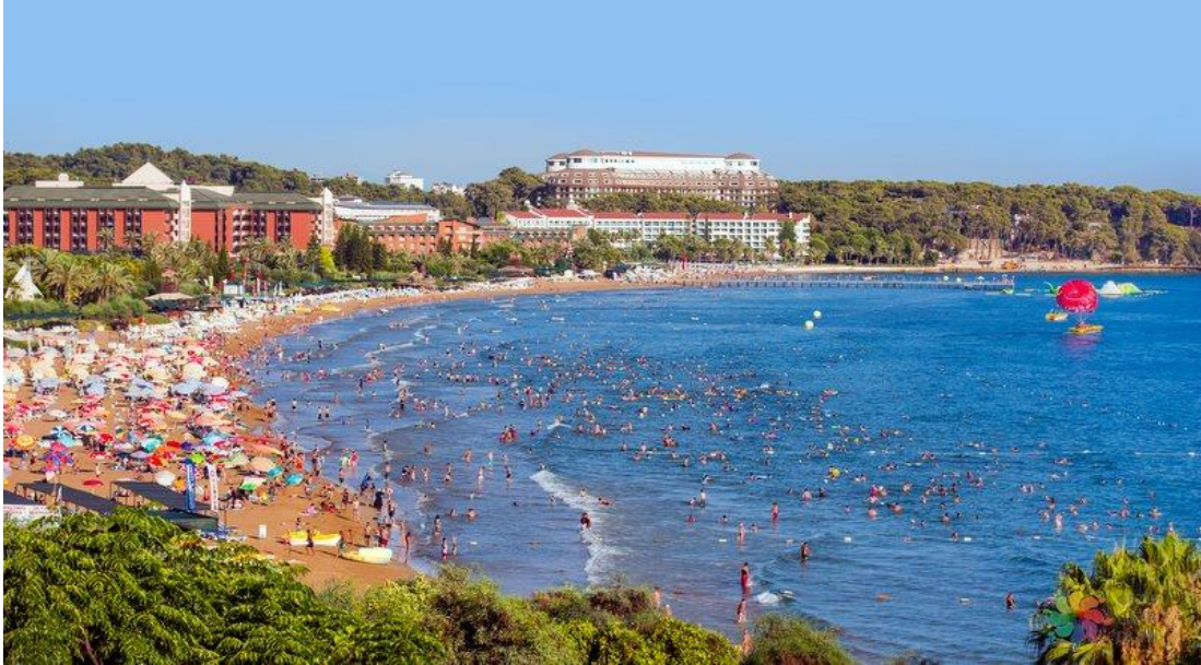
Fotoğraf. 26: Avsallar Sakinlerinin Yoğunlukla Tercih Ettikleri İncekum Plajı 38

gelirli ve özellikle kalabalık aileler halk için ayrılan plajı kullanırken gelir düzeyi orta ve üzerinde olanlar beach işletmeleri kullanır. Bu işletmelerde şezlong ve şemsiye her birinin adeti 10 liradır 36 . İncekum Plajı'nın civardaki halk tarafından çok rağbet görmesinin başka bir nedeni de burada bulunan işletmelerin önünde her ne kadar “dışarıdan yiyecek ve içecek getirmek yasaktır” uyarı tabelası olsa da bu konu da kimseye herhangi bir şekilde müdahale etmemektedirler. Ancak Avsallar Mahallesi sınırlarındaki beach işletmeler kesinlikle dışarıdan getirilen yiyecek ve içeceklere izin vermiyorlar 37 .