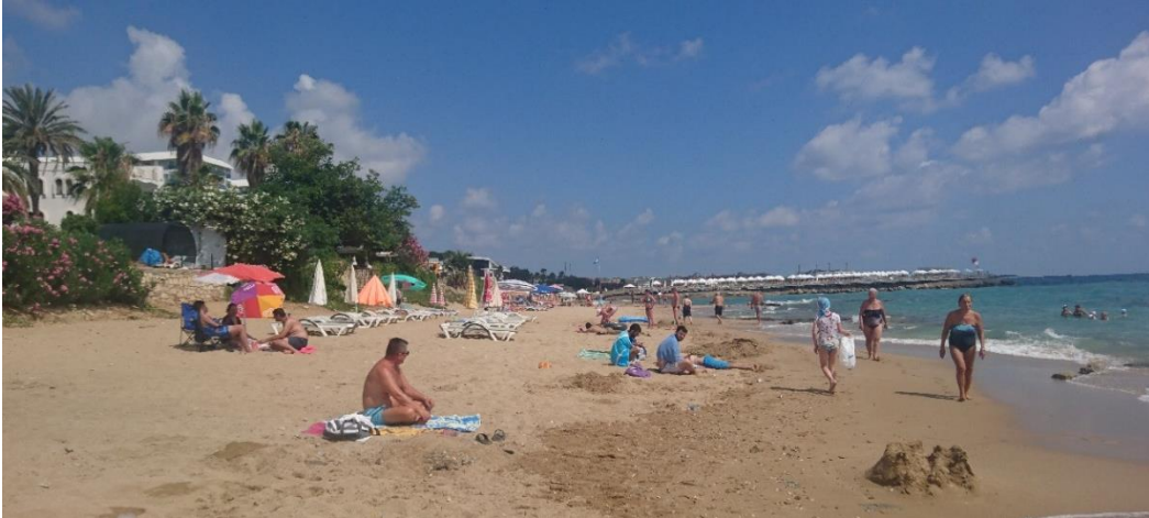
Fotoğraf. 20: Tamamlanmamış Olmasına Rağmen İskeleden Önce ve Sonra Kumsal Alan (Üstteki 17.06.2018; Alttaki 17.03.2019)

Otellerin çitleme faaliyetlerini güçlendiren bir olgu olan bu iskeleler deniz içine doğru oluşturdukları koridorlarla deniz içinde de kendilerine sınırlar belirliyorlar. Baştan sona tüm detaylarıyla çevresel sorun olan bu iskeleler müşterek üzerine bir tür kalıcı yapı kurularak toplumsal eşitsizlik üretmektedir.