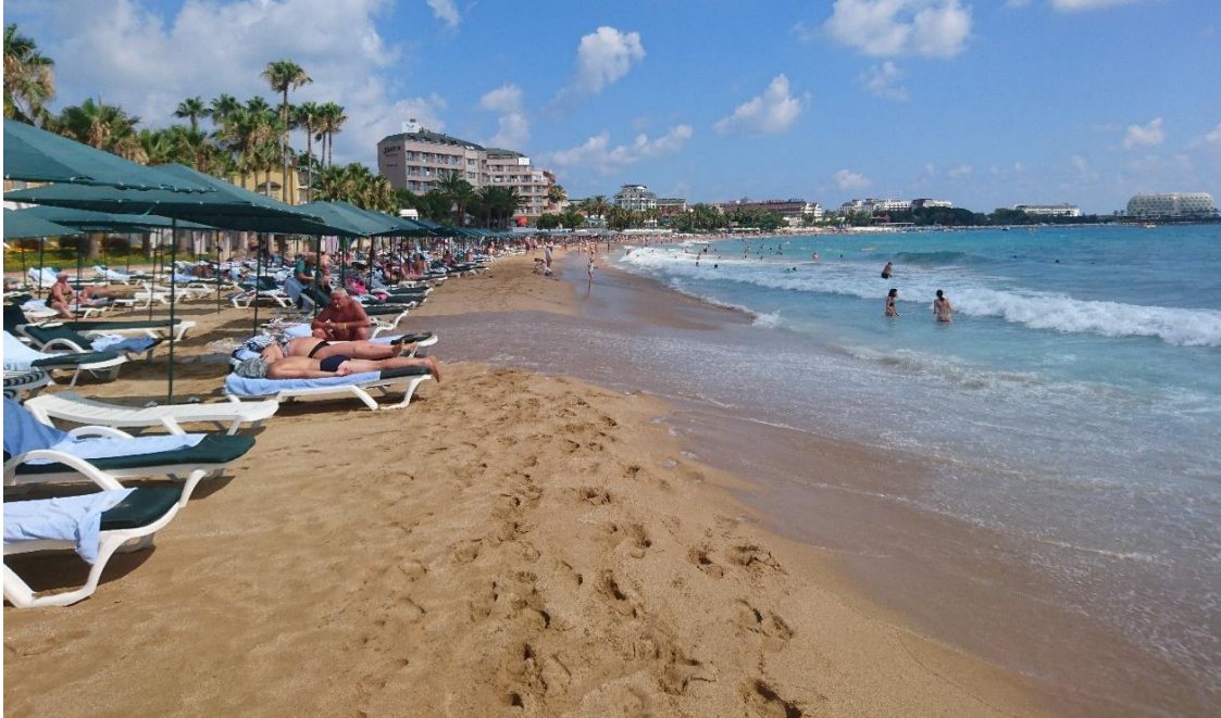
Fotoğraf. 11: Sulara Değen Şezlonglar (17.06.2018)

Öyle ki otellerin çoğu kumsalları öylesine sahiplenmişlerdir ki, otellerini tanıttıkları mecralarda bu kumsalları kendi özel plajına sahip olan 27 cümleleriyle sahiplenmektedirler. Bu uygulamalar bölgede yıllar önce uygulanmış yanlış turizm politikalarını bugün de gözler önüne sermektedir. Alanya hatta Antalya bölgesinde yapılan turizm neredeyse tamamen kum ve güneş üzerine inşa edilmiştir. Sahilin hemen kıyısındaki otellerde müşteriler neredeyse tüm tatilleri boyunca otelden çıkmadan tatillerini geçirmektedirler. Bu ise bölgeye ekonomik getirisi olmayan, bölgenin sağlıklı bir şekilde kalkınmasına yardım etmeyen bir turizm anlayışına sebep olmuştur. Turistler tatilleri süresince havayolu, tur ve otel şirketlerine para kazandırıp daha sonra memleketlerine geri dönmektedirler.