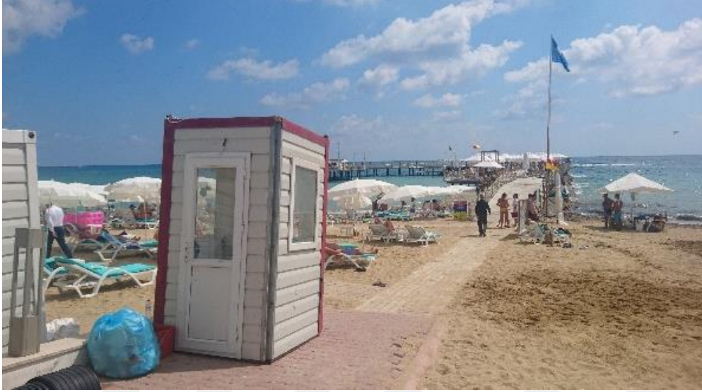
Fotoğraf. 10: Çitlenen Alanı Koruyan Bir Güvenlik Görevlisi Kabini, Kumsala Yapılmış Kaldırım ve Deniz Üzerine İnşa Edilmiş Bir iskele (17.06.2018)

Stratejinin ikinci aşaması ise plajda kurulan sistemle gerçekleşir. Bu otellerin hemen hepsi kumsallara koydukları barlardan otel müşterileri içeceklerini alır. Oteller bu barlarda çalışan personel ve dışarıcı 25 denilen işçilerle kumsalı bir özel mülk gibi yönetir. Yine her otelin önündeki kumsalda temiz suyun aktığı soğuk duşlar vardır ve bu duşlar sadece otel müşterileri tarafından kullanılabilir. Otel müşterilerinin hepsinin bileğinde o otelin müşterisi olduklarını gösterir bileklikler vardır. Eğer bileğinizde bileklik yoksa bu kumsaldaki hemen hiçbir şeyi kullanamazsınız ve bilekliğe sahip olmayan kişilere hem otel personeli hem de otel müşterileri tarafından ötekileştiren gözlerle bakılır. Ne yazık ki burada aynı sınıfsal konuma sahip bireyler bir çelişki içinde davranırlar. Bu otellerin cankurtaranlarının otel bilekliği olmayan birini boğulması halinde kurtarmayacağı da Mahalle'de espri konusudur. 26