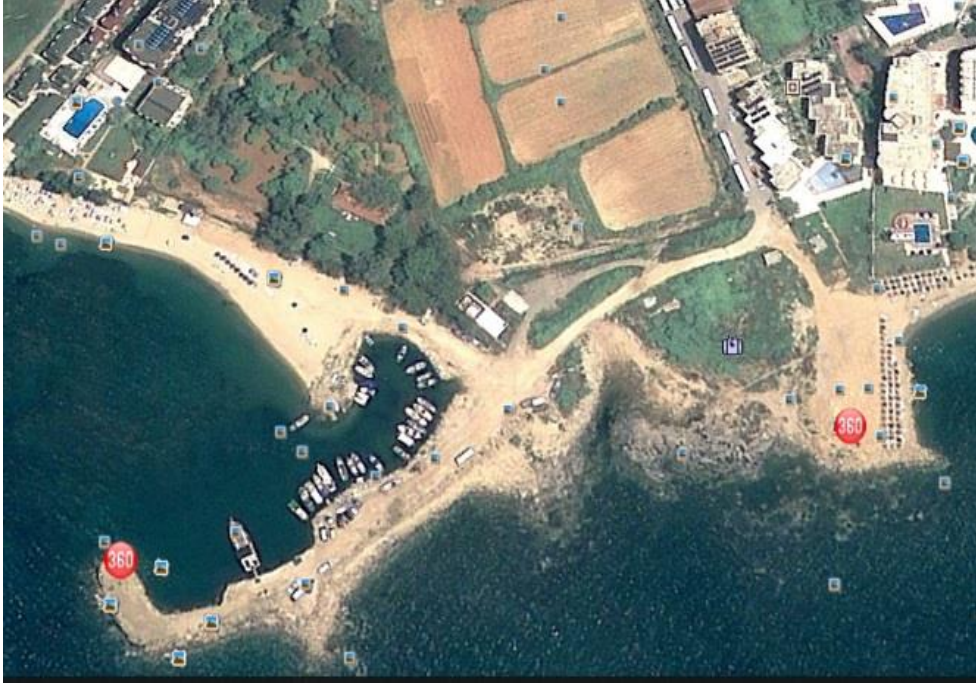
Fotoğraf. 9: Rubi Platinum’un Plaja Çevirdiği Balıkçı Barınağı ve İskele Sokak

Bu açıklama su götürmez biçimde Rubi Platinum Otel’in herkesin kullanımına açık kıyıyı sadece kendi otel müşterilerine özel bir alan haline getirdiklerinin bir itirafıdır. Bu otel balıkçı barınağını “otele özel bir koy” haline getirip misafirlerinin gizliliklerini korumaya özen gösterirken, bu çitleme ile birlikte Avsallar’da çevresel müşterekle geçimlik bir ilişki kuran balıkçılar başka bir barınağa taşınmış ve Mahalle’de bu müşterek açısından bir dönemin sonuna gelinmiştir.