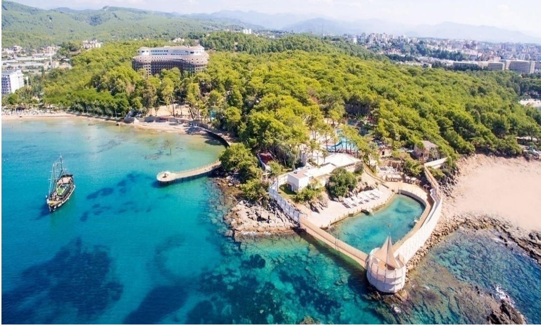
Fotoğraf. 30: İncekum Tabiat Parkı İçerisindeki Wome Delux Otel'in ve Kadınlara Özel Havuz ve Plajının Görünümü