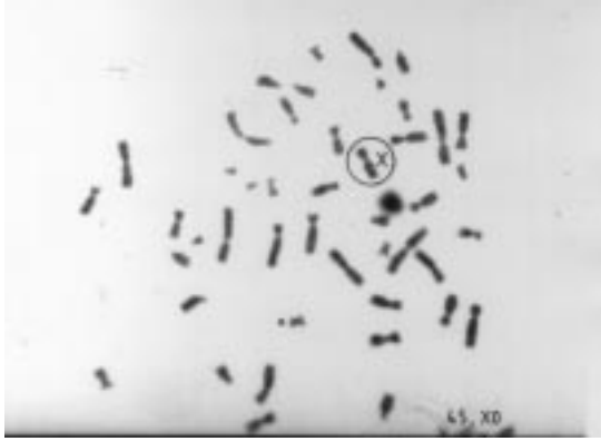
Resim 2. Olgunun G-bandlama yöntemiyle yapılan kromozom analizinde 45,XO karyotipi görülmektedir.

ölçülmüş, aynı yaş normal kontrollerle ve kısa boylu olup normal gelişim gösteren kız çocuklarıyla karşılaştırıldığında düşük bulunmuştur. Normal çocuklarda GH salınımında gözlenen senkroni bu hastalarda görülmemekte ve GH pik değeri hepsinde, özellikle yaş büyüdükçe azalmaktadır (2).