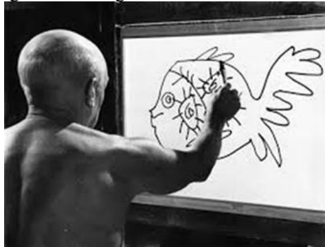
Resim 2. Picasso çalışırken

Picasso'nun yaşamı kimliğini yaptığı sanatsal eserleri etkilemiştir. "Picasso'nun babası desen hocasıydı. Çocuk Picasso, edebiyat öğrenimini öteki okullar gibi, resmi "yazı ile öğrendi."(Buchholz, E. L. ve Zimmermann, 2005: 9). Resmi yazı ile öğrenen Picasso'nun kontur çizgileriyle çizilen resimlerinde de yazının çizgisel etkileri görülmektedir.