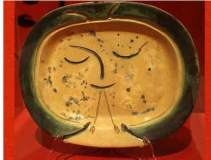
Resim 7. Pablo Picasso, Müzesyen Faun, Sırlı Seramik Tabak.

İnsan başını kendi stili olan basitleştirme formlarıyla yapan sanatçı, bronz heykeli resimsel ifade biçimine uygun şekilde üç boyuta dönüştürmüştür. Bu çalışmada figürde anatomik ve estetik kaygı gözetilmemiştir. Baş ve göz çukurları geometriksel verilmiş kübistik etki hissettirilmiştir. Yaptığı heykel çalışmalarının da üç boyutlu seramik çalışmalarıyla benzerlik gösterdiği görülmektedir.