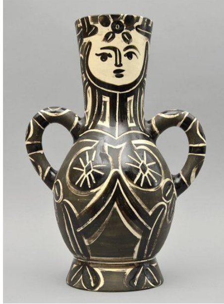
Resim 9. Vase Deux Anses Hautes (Vase with two high handles) (The Queen), 1953

Kulplu yapısından yararlanarak yaptığı 'fish' isimli seramik eserinde; sanatçı kili geometrik formda balık şekline benzetmiş, basit noktasal ve çizgisel çizimlerle nesneyi meydana getirmiştir. Sanatçı çalışmada hem nesnenin boyutundan hem de kendi resim çizim tekniğinden yararlanarak eserini meydana getirmiştir. Böylece üç boyuttan yararlanıp bazı formları verip resimsel çizgileri de kullanıp sanat üslubunu farklı bir yolla icra etmiştir.