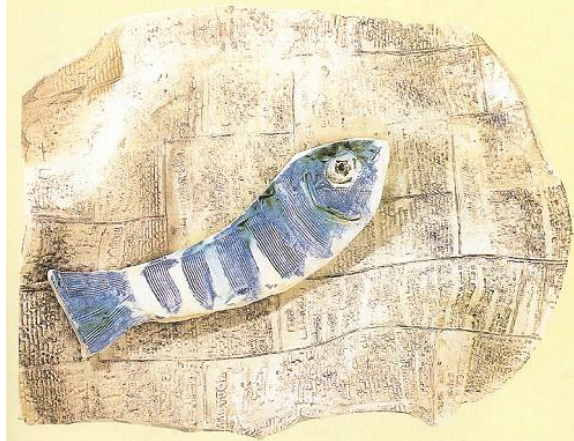
Resim 5. Gazete üzerindeki balık, 1957'ler, Nice komünist gazetesi, “La Patriote”a alınan kalıba basılmış kil ve boyalı seramik (Herscher, 2002:145).

Pablo Picasso özel yaşamını eserlerine yansıtmaktaydı. Buna en iyi örneklerden bir tanesi de yemek alışkanlığıdır. Picasso özellikle yemek alışkanlığını sanatına da yansıttı. Yaptığı resimler de ve seramik çalışmalarında balıklar, natürmortlar ve yemekleri görmek mümkündür.