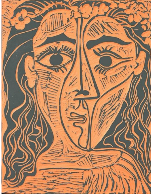
Resim 4. Pablo Picasso, Tetede femme a la courronne de fleurs (Woman's Head with Crown of Flowers), 1964,

Picasso yaptığı Pablo Picasso “Ağlayan Kadın” isimli resim eserinde olduğu gibi “Woman's Head with Crown of Flowers” isimli seramik eserinde de figürde eş zamanlı gösterim yapmıştır. Sanatçı hem profilden hem de cepheden gösterimi aynı düzlem üzerinde yapmıştır. “Woman's Head with Crown of Flowers” isimli seramik figür uygulamasında da Kübistik etki net bir şekilde görülmektedir.