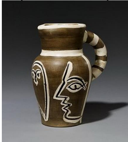
Resim 11. Grey Engraved Pitcher

Sanatçı bu seramik vazo çalışmasında çukur ve tümsek etkileri kullanılmıştır. Sanatçı şekillendirdiği portre imgesinin bazı yerlerini kazımış bazı yerlerine de üst zemine kil ekleyerek boyutlandırmıştır. Sanatçı vazoda yer alan portre imgesinde çizgisel basit formlar kullanmıştır. Sanatçı basit ve sade formlarla uygulamayı kendi sanatsal üslubuyla tamamlamıştır.