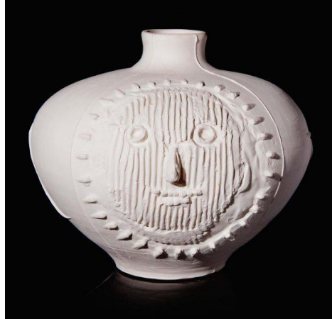
Resim 10. Grand Vase Pékiné (Big candy-striped vase), 1956

Sanatçı bu seramik vazo çalışmasında çukur ve tümsek etkileri kullanılmıştır. Sanatçı şekillendirdiği portre imgesinin bazı yerlerini kazımış bazı yerlerine de üst zemine kil ekleyerek boyutlandırmıştır. Sanatçı vazoda yer alan portre imgesinde çizgisel basit formlar kullanmıştır. Sanatçı basit ve sade formlarla uygulamayı kendi sanatsal üslubuyla tamamlamıştır.