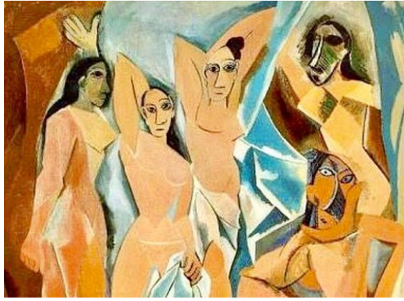
Resim 3. Avignonlu Kızlar- Les Femmes d'Alger (O. J.) , 1907 (New York Modern Sanat Müzesi)

Kübizm akımının babalarından olan "Picasso'nun en etkili vurgusu "bir resim, yıkmalardan oluşan bir toplamdır" sözüdür"(Eroğlu, 2016:15). Kübizmi, en önemli yapıyla ifadelendiren Picasso eserleri ve öncülüğüyle kübizm sanat akımına önemli katkılarda bulunmuştur. "Picasso, söz konusu zaman dilimi içinde, iki türlü analitik ve sentetik kübizme dayalı olmak üzere çalışmalar sunmuştur"(Eroğlu, 2016:74). Kübizm akımına katkıda bulunduğu eserlerden bazıları; Avignonlu Kızlar, Guernica, Ağlayan Kadın, Ma Jolie, Ayna Karşısındaki Kızlar ve sayılacak başka birçok eseri başlıca yapıtları sayılabilir.