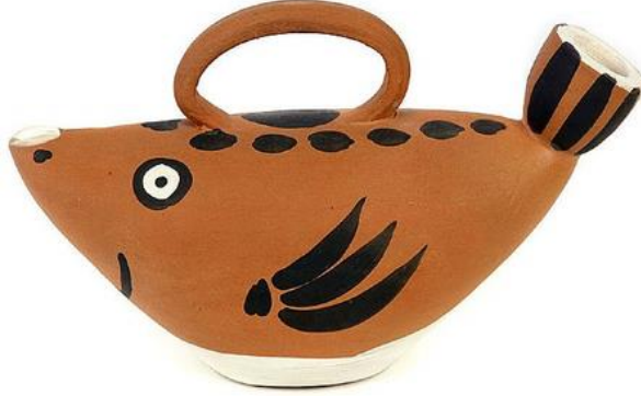
Resim 8. Pablo Picasso, Fish , 1952.

kısımını ise dışa dönük iki kavisli çizgiyle dış hattın devamı olarak verdiği görülür. Çizimde içe dönük çukura yerleşen basit çizgilerle verdiği yüz formu ve boyut sanatçının hem kişiliğini hem de sanatçı kimliğini ortaya çıkartmaktadır.