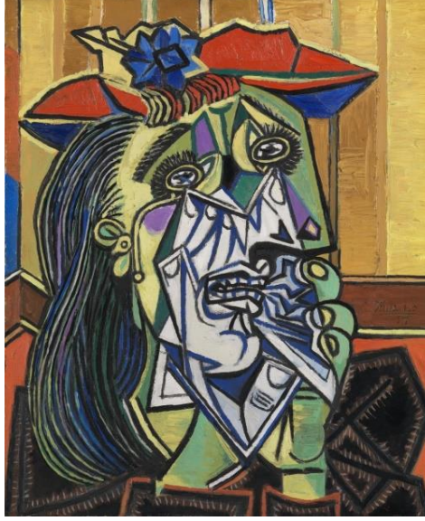
Resim 1. Pablo Picasso Ağlayan Kadın

ifade biçimi ile resmi çözümlenmesi (şematik dönem çocuklarında görüldüğü gibi resmin formları geometriksel biçimlerle betimlenmiş) örnek gösterilebilir.