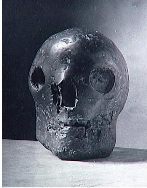
Resim 6. Human Skull. Paris, 1943. Bronze. Height, II 5/8 (Praeger, 2007:213)

Picasso seramik çalışmaları dışında resimsel ifadelerini boyutlandırabildiği diğer bir alanda heykeldir.