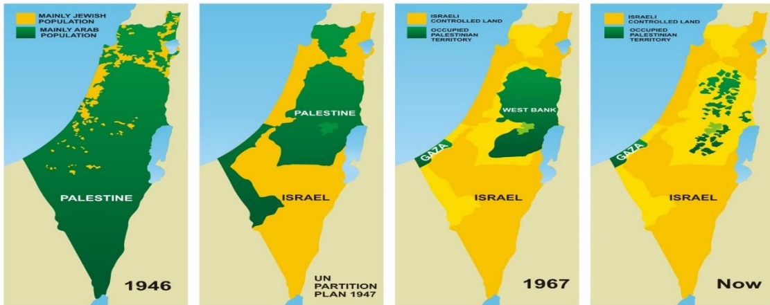
Harita 2. Filistin- İsrail Toprakları 1946-2017

Kaynak: https://yandex.com.tr/gorsel/search?text=filistin%20haritas%C4%B1&styp=image&lr=103885&noreask=1&parent-reqid=1491751556812802-4386342974161423911125287-sf10-000&source=wiz