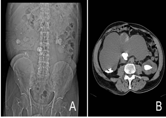
Resim 1. A-Direk üriner sistem grafisi B. Bilgisayarlı tomografi

yarısına kadar uzanan sağ böbrek saptandı (Resim 1b). Sintigrafide ise sağ böbrekte fonksiyon gözlenmedi. Bunun üzerine hastaya önce sol perkütan nefrolitotomi yapılarak sol böbrek taşsız hale getirildi.