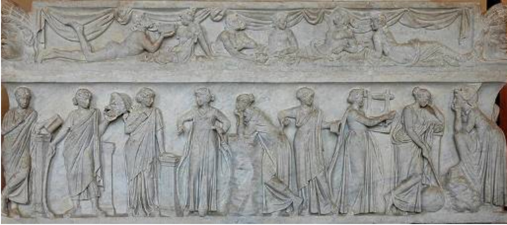
Şekil 1. Musalar: İ.Ö. 2. yy’daki bir mermer lahit, Louvre Müzesi. (Jastrow, 2006)

Musaların dokuz tane olması ve birbirini tamamlaması, dokuz sayısının gizemli bir sayı olarak kabul edilmesinden kaynaklanıyor olabileceği gibi, insanın ana karnında dokuz ayda olgunlaşması ve Musaların da yaratıcılıklarının doğurganlıkla özdeş olarak algılandığı insansı birer Tanrıça olmaları ile ilgili olabilir (Şekil 1). Dokuz Musa’nın kız olması ise, Batı kültüründe yaratıcılık ve ilhamla özdeş tutulan müziğe ‘dişil’ bir anlam yüklendiğini göstermektedir. Antik Yunan algısında kadının müziğin ortaya çıkışındaki yeri, müzik sözcüğü ile Musa’lar arasındaki ilişkiden bile yeterince anlaşılmaktadır.