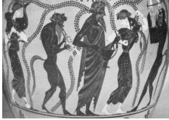
Şekil 3: Vulci bölgesinden, üç kulplu, siyah figürlü antik Yunan vazosu, M.Ö. 520. Dionysos, Maenad ve Satirler (Fitzsimons, 2010)

izlerdi. Şairler, oyuncular ve şarkıcılara tanrının uşağı gözünde bakılırdı. Dionysos'un rahibi de tanrı adına bu şenliklere katılırdı (Şekil 3).