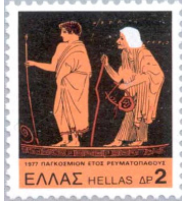
Şekil 7. Bir Yunan Pulu: Linos, Herakles'e lir çalmayı öğretmeye çalışırken (Lahanas, 2010)

Aşağıdaki resimde, liri tutan müzisyen olarak tasvir edilen Linos, Eumolpusla birlikte Herakles'in müzik öğretmenidir (Şekil 7). Linos, Herakles'i, müzik yeteneği olmadığı için cezalandırmış, ancak Herakles sinirlenmiş ve gücünü kontrol edemediği için hocası Linos'u öldürmüştü. Bu ifadeden, diğer bir adı da Herkül olan aşırı güçlü Herakles'in, kaba kuvvete sahip olmakla birlikte ince fikirden yoksun olduğunu anlamaktayız. Bu nedenle müzik hocası Linos, O'na müzisyenliği öğretememişti ve Herkül, öfkesini kontrol edemediği için O'nu öldürmüştü. Bu mitem, ince fikirden yoksun yaratılıştaki birine, inceliğin ve humorun öğretilmeyeceği sonucu çıkmaktadır. Linos, bir şarkıcı olarak algılanır. Tradisyonlardan birine göre, Argos kralı Krotopos'un kızı Psamathe ve Apollon'un çocuğudur. Krotopos, bu ilişkiyi onaylamadığı için hem kızı Psamathe'yi öldürür, hem de Linos'u köpeklere parçalatır.