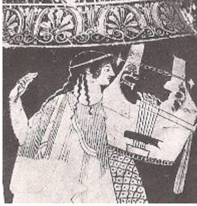
Şekil 2. Tanrı Apollon'un Liriyle Tasviri, Kırmızı Figürlü Atina Vazolarından (Boardman, 2002: 197)

etkilenmişti ki, Hermes'in liriyle kendi sürülerini deęiş tokuş etmişti. Buradan da lir çalan Apollon'un liri Hermes'ten aldığını öğrenmekteyiz. Ama aslında tradisyonlardan birine göre de Apollon doğduğunda, babası Zeus'un O'na verdiği armağanlardan biri lirdir (Grimal, 1997: 82). Antik Yunan mitolojisindeki bu farklı tradisyonlar göz önünde bulundurulduğunda, Apollon'un liri Hermes'ten de, babası Zeus'tan da almış olabileceğini görüyoruz. Ancak Apollon'un lir çalar bir Tanrı olduğundan eminiz.