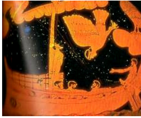
Şekil 8. Odiseus ile Sirenler, M.Ö. 150, Arkeoloji Müzesi Floransa (Magalhaes 2007: 827)

Efsaneye göre Sirenlerin sesleri çok büyüleyici, etkileyici adeta hipnoz edici idi. Akdeniz'de bir adada oturuyorlar, yakınlarından geçen denizcileri müzikleriyle kendilerine çekiyorlardı. Böylece gemiciler kayalıklara çarparak parçalanıyorlar ve Sirenler de onları yiyorlardı (Grimal,1907: 726). Argo gemicileri, Sirenlerin tuzağına düşmekten, Orpheus'un çaldığı daha güçlü ezgilerle kurtulmuşlardı (bkz. Orpheus maddesi). Müziğin ikna edici, cezp edici ve baştan çıkarıcı etkisi, Antik Yunanlılar tarafından da iyi bilindiği için, mitolojide işlenmiştir.