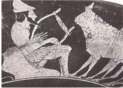
Şekil 4. Hermes, Liri ve Sığırlarının Görsel Tasviri, Kırmızı Figürlü Atina Vazolarından (Boardman, 2002: 96)

Kylene mağarasında bulduğu bir kaplumbağanın içini boşaltarak, Apollon'dan çalarak kurban ettiği hayvan bağırsaklarını bu kabuğa tel olarak takması ve bu tellerden lir üretmesi öyküsü ise, lirin icadının bu zeki Tanrıya atfedildiğini bize göstermektedir. Lir, tıpkı gitar ya da bağlama gibi söze hizmet eden, söze eşlik eden, ezgilerin sözlerle birlikte sunulmasını sağlayan bir çalgıdır (Şekil 4). Dolayısıyla Lir kökünden türeyen 'lirik' sözcüğü, 'lirle ilgili' anlamındadır. Lirle ilgili olan, edebi olandır ki bu anlam, bir çalgı olarak 'lir' in kökünden türemiştir. Şarkı sözü anlamındaki 'Lyrics' de, bu sözcükten türemiştir. Bu çalgı, Yunan mitolojisinde Hermes'e atfedilir.