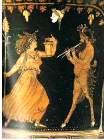
Şekil 6. Pan'ın görsel tasviri, M.Ö. 4.yy. Eolian Müzesi, Lipari (Magalhaes 2007: 445).