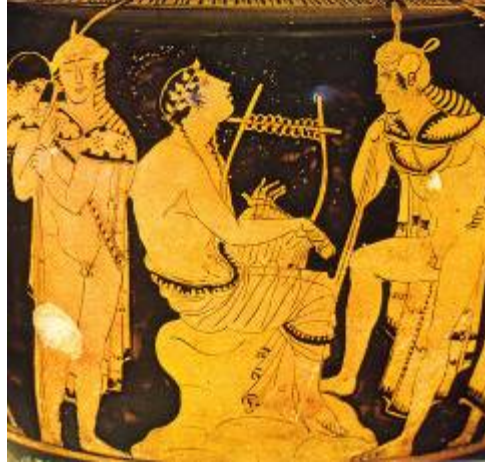
Şekil 5. Orpheus Tasviri, Kırmızı figür tekniği ile yapılmış M. Ö. 5. yy. da Attika Vazosu

Yine Orpheus'un ölümüne ilişkin diğer bir tradisyona göre de, öldükten sonra liri gökyüzüne çıktı ve bir takımyıldıza dönüştü. Bu hikâyeden, müziğe göksel bir anlam yüklendiğini anlamaktayız. Orpheus'un ruhu da Elysion'a (ölüler ülkesi) götürüldü, orada beyaz ve uzun bir giysiyle mutlu insanlar için şarkılarını söyledi ki, bu tradisyondan da, şairin beyaz ve uzun kıyafetinden saf ve temiz olarak, belki melek olarak algılandığını, mutlu insanlara şarkı söylemesini de cenneteki insanları tasvir ettiğini düşünebiliriz.