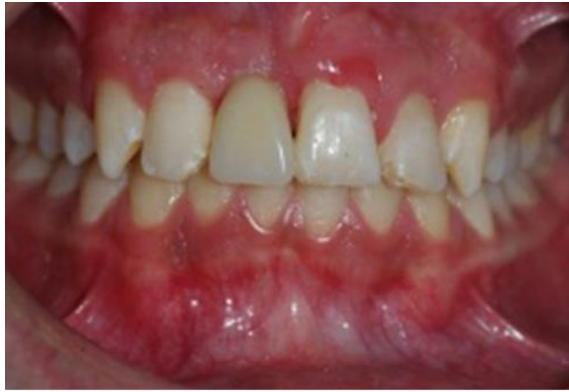
Resim 5. Protetik tedavi sonrası görünüm