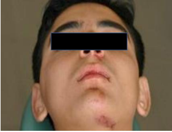
Resim 1. Tedavi öncesi ağız dışı görünüm

ise mediale yer değiştirdiği görüldü. Ayrıca ağız içinde ve dışında yumuşak doku travması tespit edildi. (Resim1 ve 2)