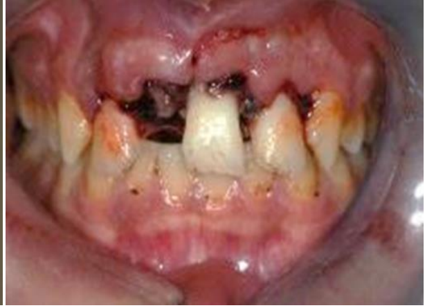
Resim 2. Tedavi öncesi ağız içi görünüm

Radyografik muayenede travma bölgesinde herhangi bir patolojik bulguya rastlanmadı. Hastaya tedavi prosedürü anlatılarak "bilgilendirilmiş olur belgesi" alındı. Hasta ortodonti bölümü ile konsülte edilerek kaybedilen sağ üst