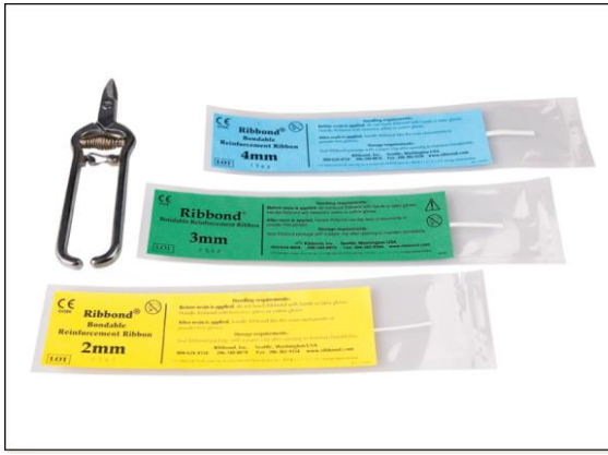
Resim 4. Polietilen fiber materyali (Ribbond; Ribbond, Seattle, WA, ABD)