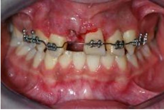
Resim 3. Ortodontik tedavi başlangıcı ve tedavi sonrası görüntü

santral dişe yeterli yer sağlamak amacıyla sabit ortodontik tedavi uygulanmasına karar verildi. 6 aylık ortodontik tedavi süreci sonundaki boşluğun restore edilebilmesi için yeterli yer sağlanmış oldu. (Resim 3)