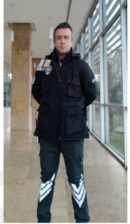
Şekil 2.1. Belediyede çalışan örnek özel güvenlik görevlisi resmi