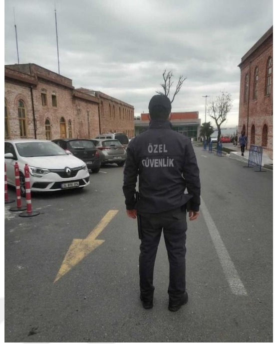
Şekil 2.2. Örnek özel güvenlik görevlisi resmi

6. Özel güvenlik görevlileri, Ceza Muhakemeleri Usulü Kanunu 127. Maddesine göre yakalamalarda orantılı arama yapabilir. (5188 S.K Md 7)