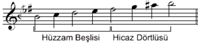
Şekil.14 Hüz zam makamı dizisi

“Makam dizilerinin komalı sesleri tampere sistemde en yakın seslerle birleştirildiğinden koma si bemol (segâh) sesi; si natürel, bakiye mi bemol (hisar) sesi ise mi bemol olarak çalınır(Yıldırım-Çelikkanat, 2014:57). İfadesi yer almakta ve dizi aşağıdaki şekilde gösterilmektedir.