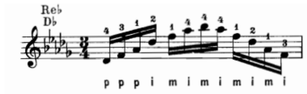
Şekil.20 Gitarda arpej tekniği için bir örnek.

Akorlardaki seslerin değişik sıralamalara göre çalınması ya da tınlatılmasıdır. Klasik gitarda arpej tekniğini çalmak için; sağ el parmakları, sol elin basarak hazırlanmış olduğu akorları ayrı zamanlarda tınlatmalıdır. Arpej de, eşlik etmede kullanılan diğer teknikler gibi üç veya daha fazla tel kullanılarak çalınabilir.