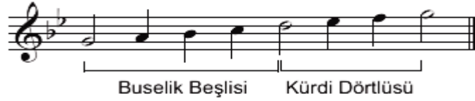
Şekil.11 Nihavent makamı dizisi

(Buselik dördlüsü+ 5. Derecede Kürdi veya Hicaz dördlüsü)