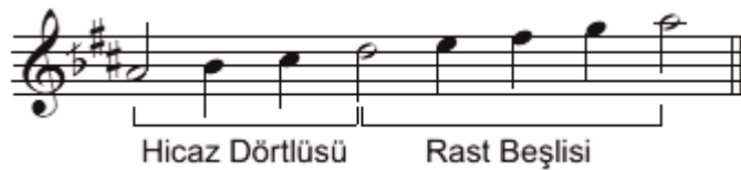
Şekil.7 Hicaz makamı dizisi

(Hicaz dörtlüsü + 4.derecede rast beşlisi).