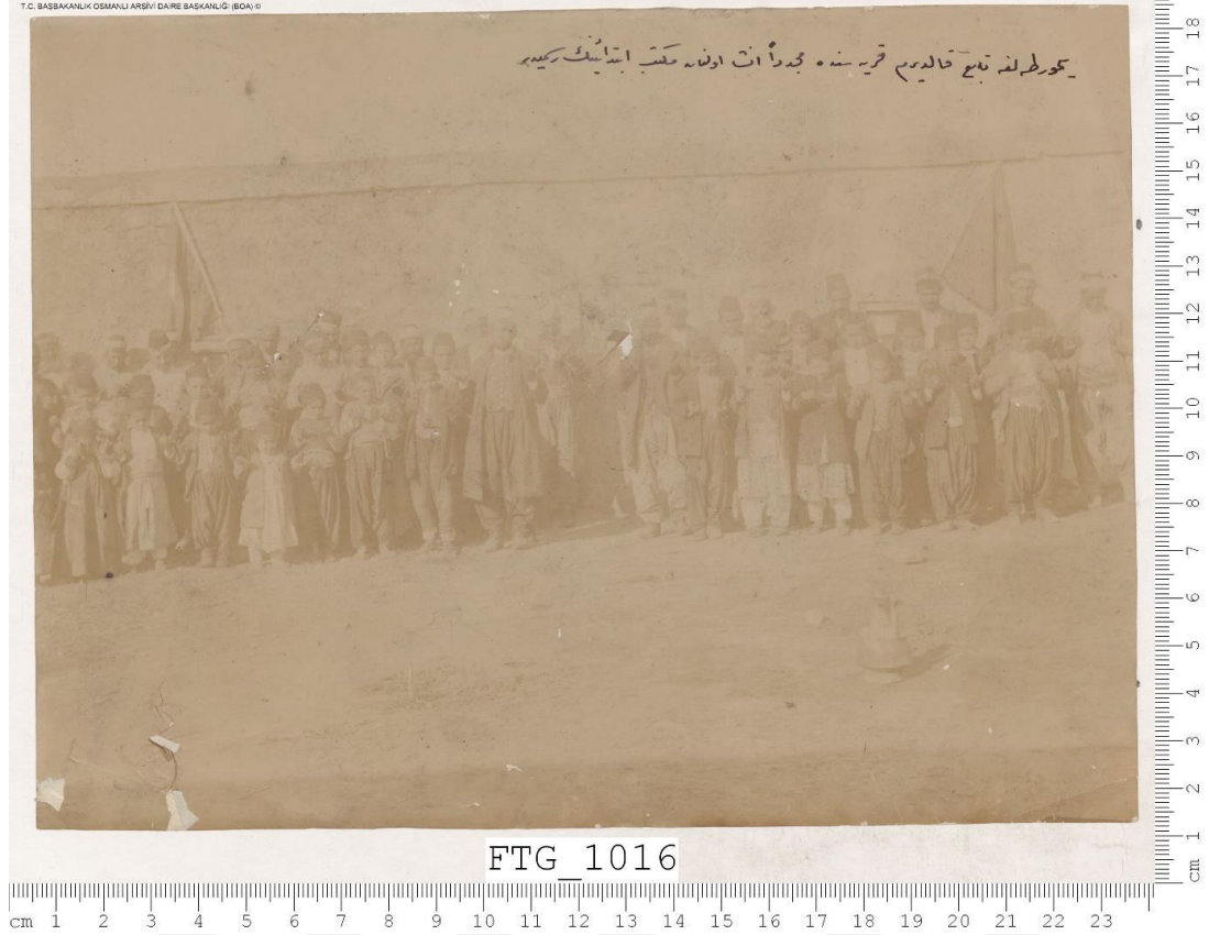
Resim 5: Bir ibtidaî mektebi açılış töreni (Yumurtalık-Kaldırım karyesi)