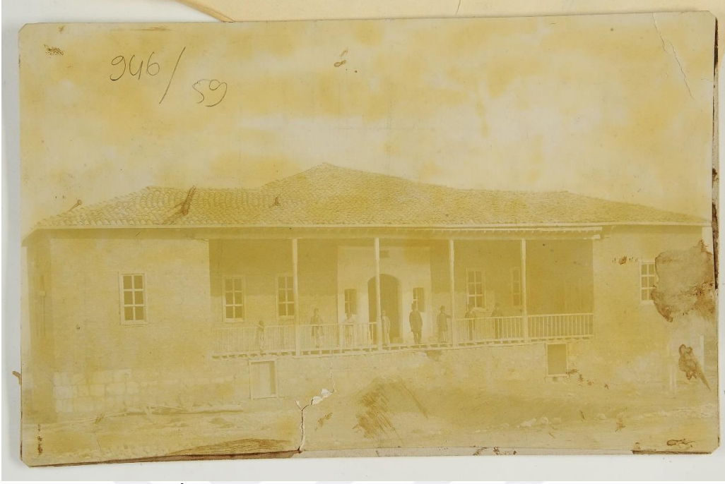
Resim 4: Akçadağ İbtidâî Mektebi

Kaynak: Nalcı, Ahmet, Osmanlı Modernleşme Döneminde Malatya'da Eğitim (1869-1919) Mersin Üniversitesi Sosyal Bilimler Enstitüsü Yayınlanmamış Doktora Tezi, Mersin 2020, s.576. Geniş bilgi için bakınız: BOA. MF. MKT. 946/59, (18 C. 1324/9 Ağustos 1906).