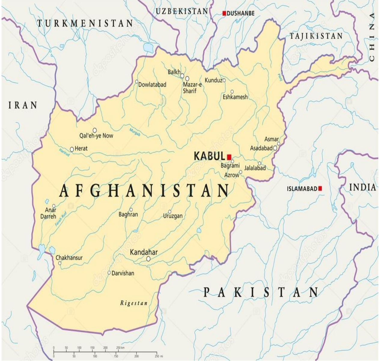
Ek.1.Afganistan Siyasi Haritası