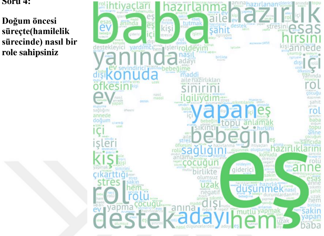
Şekil 4.5. Araştırmaya Katılan Babaların “Doğum öncesi süreçte(hamilelik sürecinde) nasıl bir role sahipsiniz?” Sorusuna Verdiği Yanıtlara Ait Kelime Bulutu

Doğum öncesi süreçte(hamilelik sürecinde) nasıl bir role sahipsiniz