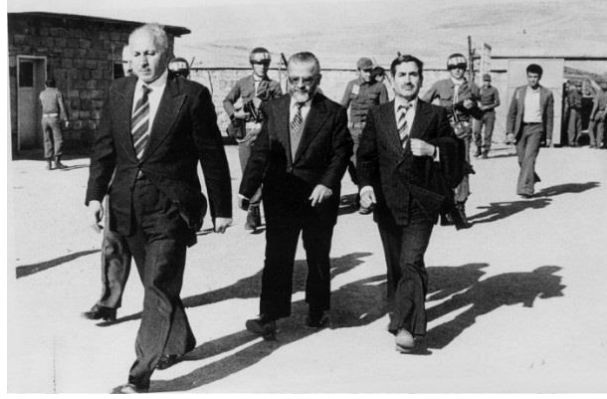
Görsel: “Necmettin Erbakan Uzunada’ya sürgünü”, (Yeni Şafak 2020).

darbeci generaller tarafından şeriatçı olarak nitelendirilen Necmettin Erbakan'ın sürgüne uzun adaya gönderilmesi kararlaştırılmıştır.