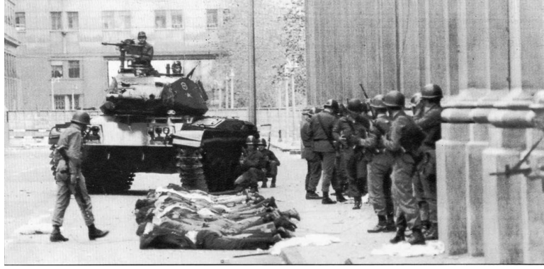
Görsel: “12 Eylül Sokakları, 1980”, (Yeni Şafak 2020).

Bu plan yine aynı kod adıyla 12 Eylül bayrak harekâtı sabahın ilk vakitlerinde uygulamaya koyulmuştur. 12 Eylül sabah 04:00 sularında şehir ve sokaklarda tank paletlerinin postal seslerinin hâkim olduğu sabah sabah yaşanmıştır.