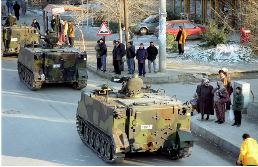
Görsel: “4 Şubat 1997 Askerî Geçit Töreni”, (Anadolu Haber Ajansı. 2021)

Ordu, bu memnuniyetsizliğini 4 Şubat'ta Ankara'nın Sincan ilçesi sokaklarında tankların da yer aldığı bir “Askerî Geçit Töreni” düzenleyerek dile getirmiş, Geçit töreninin ardından dönemin Genelkurmay Başkan Yardımcısı Çevik Bir, bu etkinliğin “demokrasiyi istikrara kavuşturma” amaçlı olduğunu ifade etmiştir.