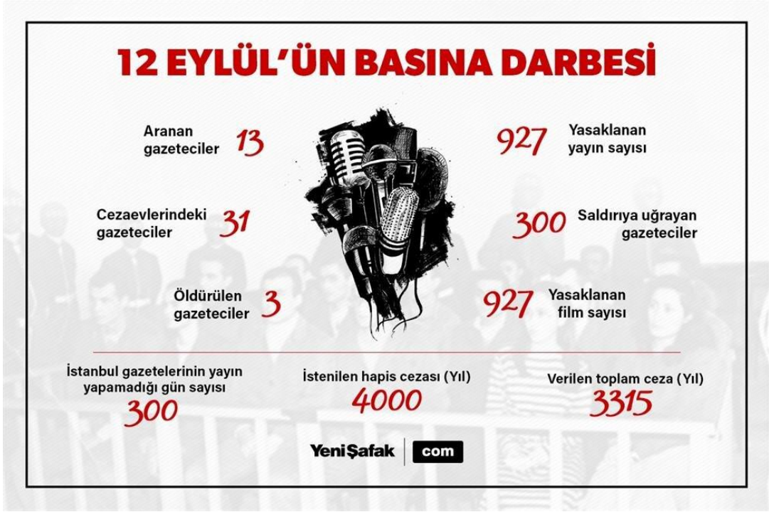
Görsel: “12 Eylül’ün Basına Darbesi”, (Yeni Şafak 2020).

12 Eylül askeri müdahalesi sonrasında medya kuruluşlarına karşı açılan davalara ilişkin Yeni Şafak gazetesi tarafından “12 Eylül’ün Basına Darbesi” başlığı ile kamuoyuna sunulan veriler; o dönemin generallerinin, sadece sivil siyaseti ve toplumsal çatışmaları değil ülkenin her kesimini hedef aldığını göstermektedir. Sunulan bu veriler Basına yöneltilen yargısal cezaların 3.315 hüküm ile neticelendiğini, basın için istenilen hapis cezalarının toplam 4000 yıllık bir istem oluşturduğunu yansıtmıştır. Askeri müdahale sürecinde İstanbul gazetelerinin 300 gün yayın yapamadıkları, 300 gazetecinin saldırıya uğradığı, 31 gazetecinin hapsedildiği görülmektedir. Yeni Şafak gazetesi o dönem çıkan kararlar doğrultusunda 13 gazetecinin arandığını 3 gazetecinin ise yaşamını yitirdiğini bu veriler ile sunmuştur. Bu veriler doğrultusunda 12 Eylül sürecinde, o dönem yayınlarına devam eden medya kuruluşlarını ve çalışanlarını derinden sarsan kararlara ve yargılamalara imza atıldığı görülmektedir. Bu yargılamaların devamına ilişkin veriler şöyledir;