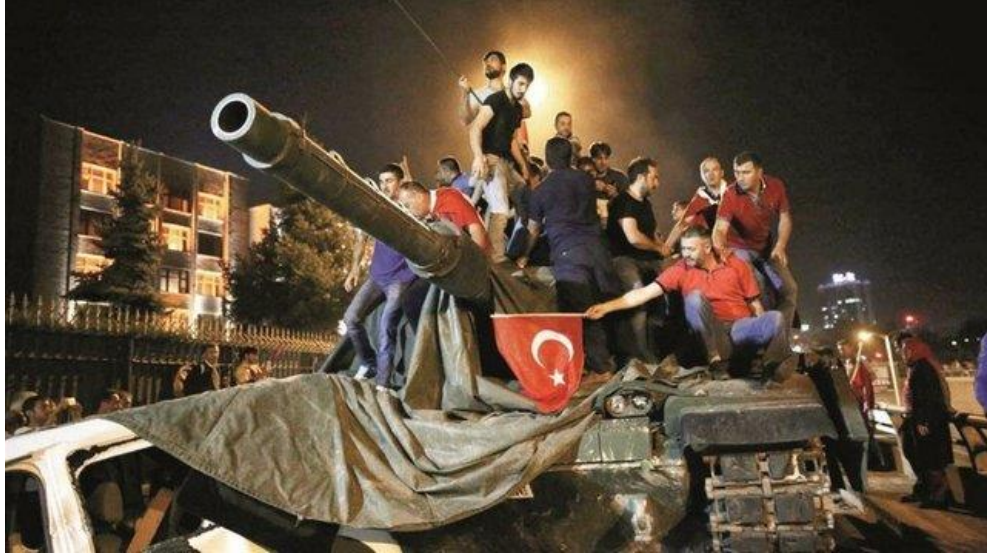
Görsel: “Genelkurmay Önündeki 15 Temmuz Tanklarının Ele Geçirilmesi”

Türkiye, 15 Temmuz akşamı Türk Silahlı Kuvvetleri’ne (TSK) gizlice sızan Fethullahçı Terör Örgütü’nün (FETÖ) uzun vadeli hedeflere ulaşmak için belirlediği bir askeri darbe girişimine tanık olmuştur. Eşzamanlı olarak gerçekleştirilen bombalamalar ve toplu kurşunlamalar nedeniyle 241 sivil katledilmiş, 2195 kişi de yaralanmıştır. Her ihtimale karşı; Türk halkı, siyasi partiler, medya ve STK’lar mücadeleyi ülke çapında güçlü bir direnişle yürüterek büyük bir zafer kazanmıştır. Hükümete inanılmaz bir destek veren bu güçlü duruş, FETÖ’cülerin beceriksizce yürütülen ama yine de çok kanlı bir başarısız darbe girişiminin kent meydanlarında toplanarak olası terör saldırılarına karşı