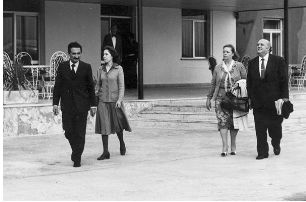
Görsel: “Süleyman Demirel ile Bülent Ecevit Hamzakoy’a sürgünü”, (Yeni Şafak 2020).

Uzun adaya sürgüne gönderilen isimler arasında Necmettin Erbakan'ın yanı sıra Alparslan Türkeş de yer almıştır. Sivil siyasetçilere yöneltilen bu sürgün Süleyman Demirel ve Bülent Ecevit in Hamzaköy'e sürgün edilmesiyle devam etmiştir.