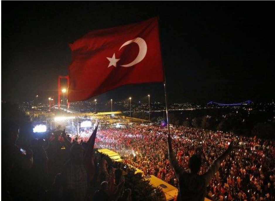
Görsel: “15 Temmuz Gecesi Boğaziçi Köprüsü”, (Haber Türk. 2021)

karşıya kalacakmış gibi bir manzara oluşmuştur. Ancak bu noktada Türk Siyasi tarihinde eşi benzeri olmayan bir şey olmuş, 15 Temmuz darbe girişimine karşı çıkmak için binlerce vatandaş sokaklara dökülmüştür. Darbe girişimi haberleri sosyal medyada yayılırken, ellerinde mutfak gereçlerinden başka bir şey olmayan binlerce sıradan vatandaşlar, Anadolu'nun dört bir yanındaki sokaklarda ve meydanlarda darbeye karşı toplanmıştır. Tank ateşine ve hava bombardımanına direnen kalabalık, sadık asker ve polis güçlerinin de yardımıyla darbe girişimini birkaç saat içinde bozguna uğratmıştır. Bir sahil beldesinde tatilde olan Erdoğan, taraftarlarını protesto için sokağa çıkmaya çağırmış ve İstanbul'a dönmüştür. Bu gecede askerler televizyon kanallarını bastı, İstanbul ve Ankara'da patlamalar duyulmuş, protestoculara ateş açılmış, meclis ve cumhurbaşkanlığı binalarına bombalar atılmış, bir askeri helikopter düşürülmüştür. Hükümet süratle zafer ilan etti ve darbeye katılan çok sayıda asker İstanbul Boğazı Köprüsü'nde teslim olmuştur. Bu direnişe ilişkin Haber Türk tarafından 2021 yılında düzenlenerek kamuoyuna yansıyan görseller yaşanan süreçte gösterilen milli iradenin boyutunu ortaya koymaktadır;