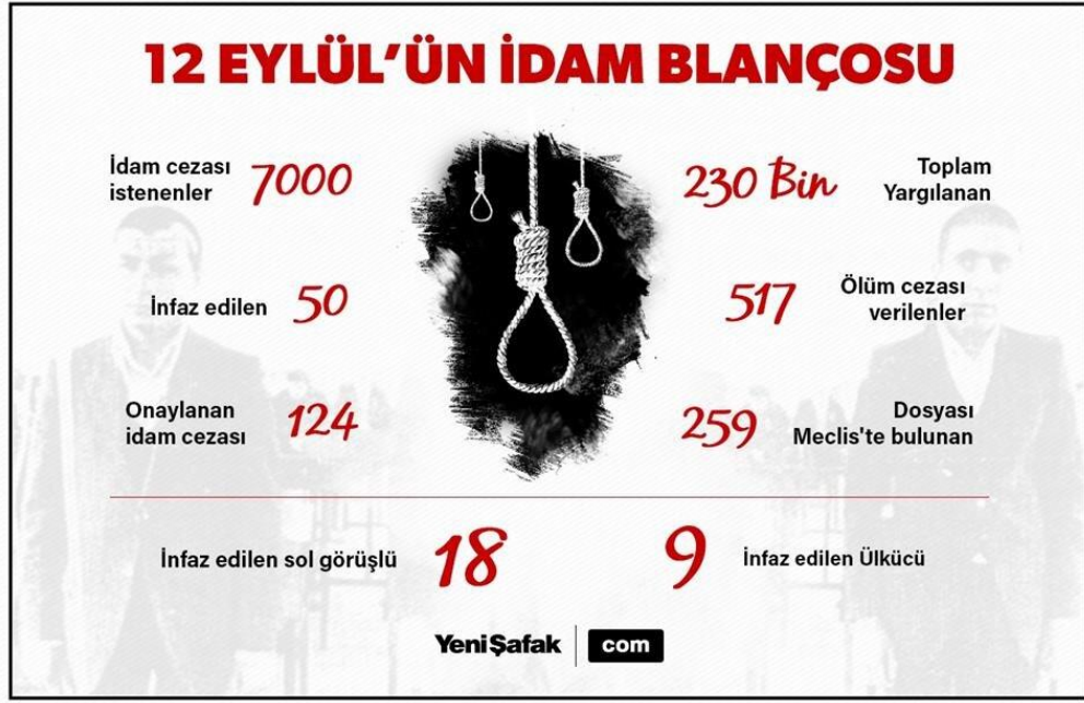
Görsel: “12 Eylül’ün İdam Bilançosu”, (Yeni Şafak 2020).

12 Eylül sonrasında alınan idam kararlarına ilişkin Yeni Şafak gazetesinin yayınlamış olduğu “12 Eylül’ün idam bilançosu” başlığında; bu süreçte yargı yolu ile gerçekleştirilen müdahalelerin boyutu ortaya konmuştur. 230 bin kişinin yargılandığı bu süreçte 7000 kişinin idamının istenildiği, 517 kişinin ölüm kararın çıktığı, infaz edilenlerin sol görüşlü ya da ülkücü olarak tasnif edildiği görülmektedir. Bu süreç toplumun çatışma içerisinde olan ana fraksiyonlarının tüm taraflar açısından olumsuz sonuçlarla neticelendiğini göstermektedir. Darbe öncesi yaşanan ideolojik çalışmalarda kazanan tarafın olmadığı bu veriler ışığında tekrar dikkat çekmektedir.