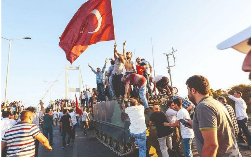
Görsel: “Boğaziçi Köprüsü’ndeki Tanklarının Ele Geçirilmesi”