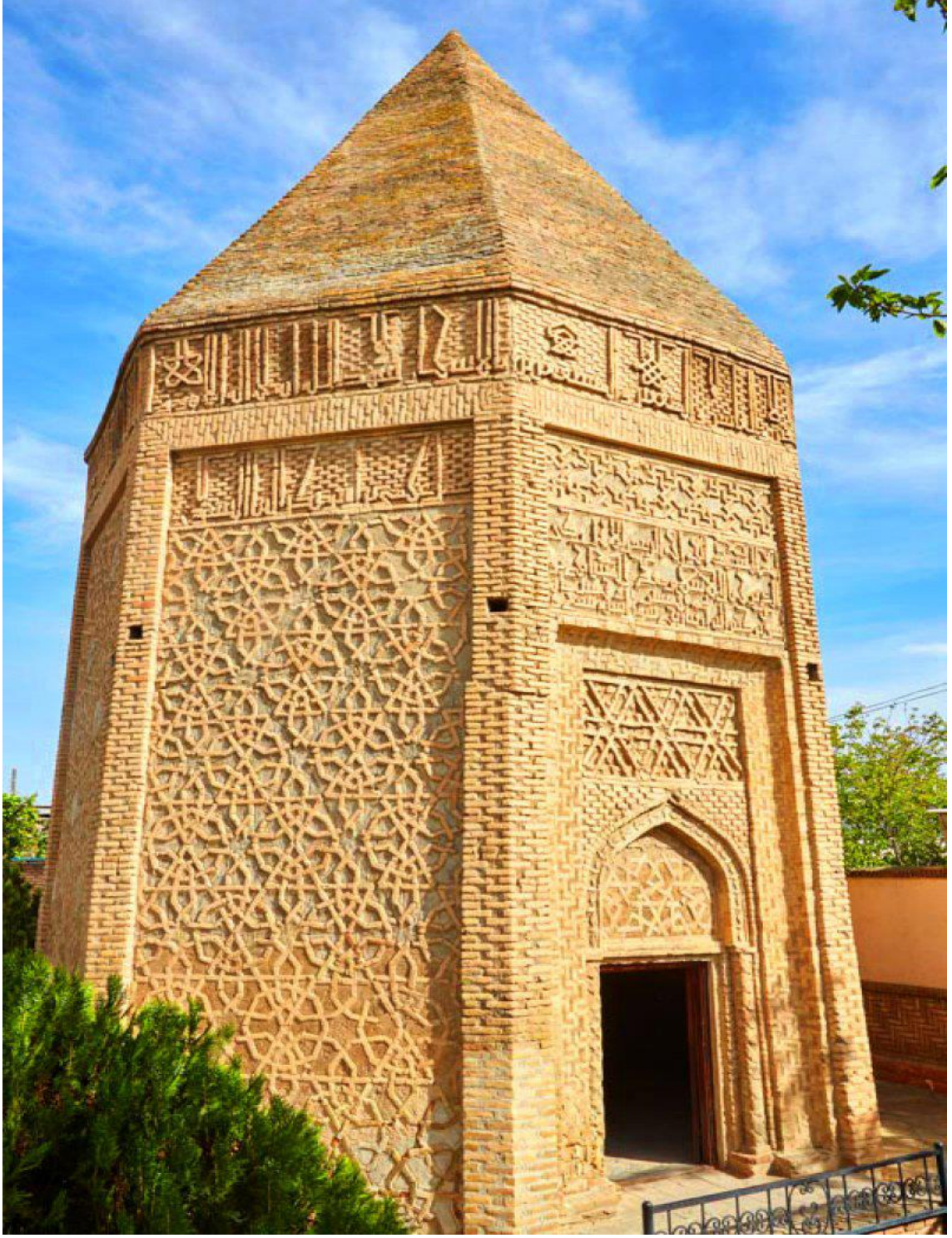
(Ek: 2) Yusuf İbn Kuseyir Türbesi / Nahçıvan