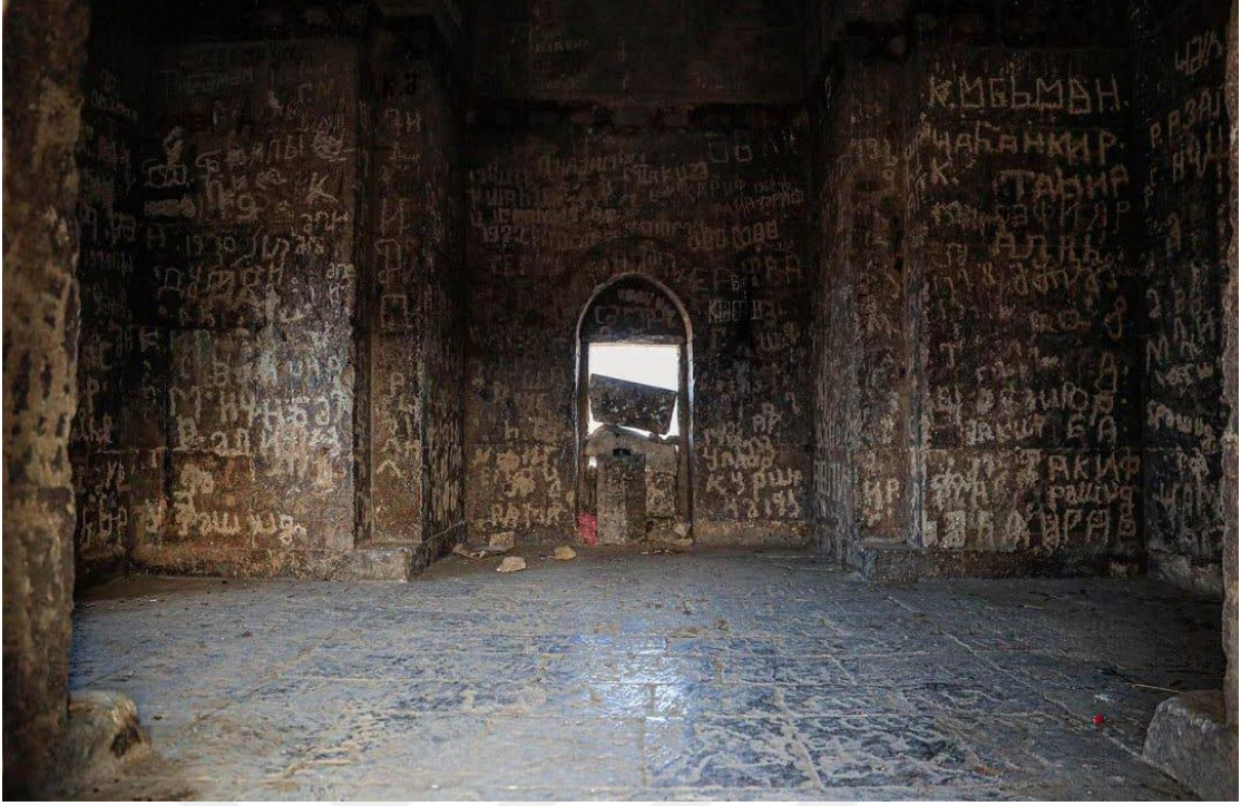
Kutlu Musa Türbesi'nin içi. Karabağ'ın Ermeni işgalinde bulunduğu dönemde türbe tahrip edilmiştir. Fotoğraf 2020 yılında Ağdam'ın işgalden kurtuluşundan sonra çekilmiştir.