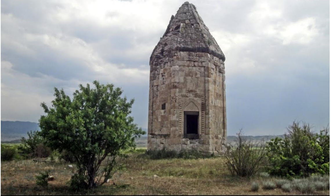
INV#: 391 - Mausoleum of Yahya ibn Muhammad al-Haj - 1304