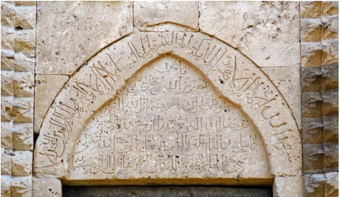
INV#: 391 - Mausoleum of Yahya ibn Muhammad al-Haj - 1304

Azərbaycan'ın Zəngilan şəhərində yer alan Yahya ibn Muhammed (Memmedbeyli) Türbəsi (Ek: 8)