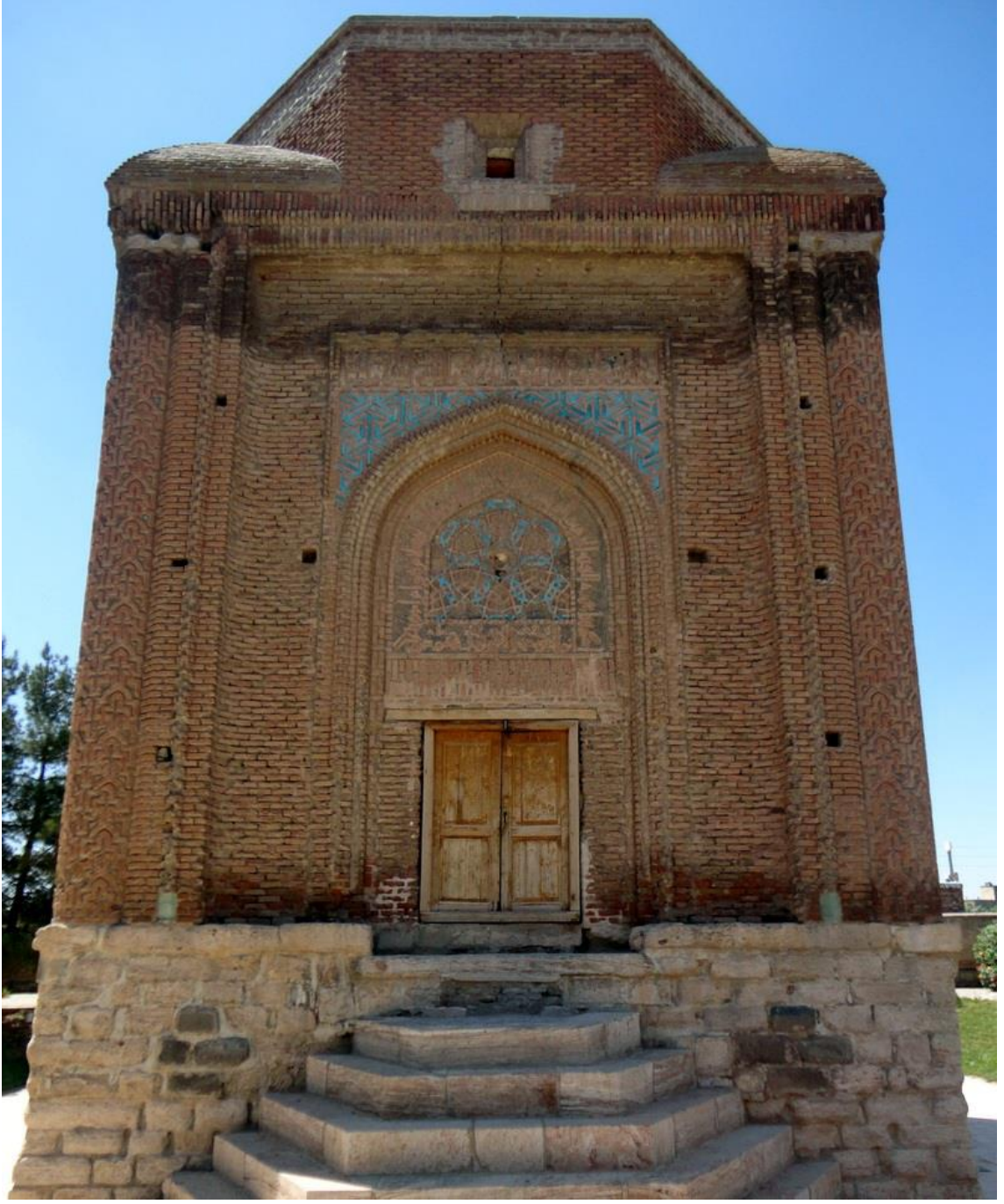
(Ek: 3) Kirmızı Kumbet / Meraĝa