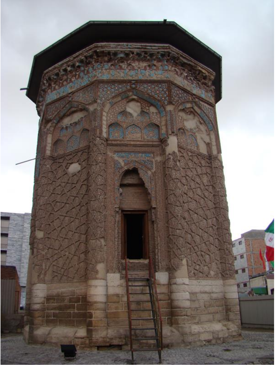
(Ek: 4) Gök Kumbet / Meraĝa