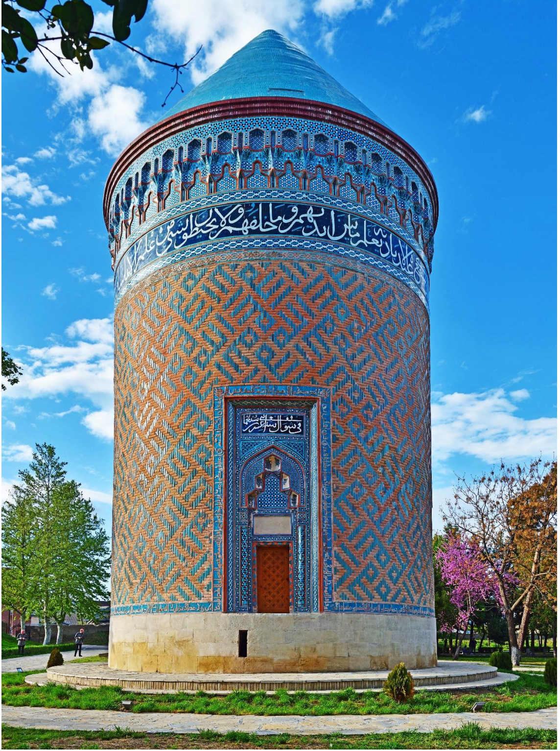
Azerbaycan'ın Berde şəhrinde bulunan Nüşabe Kalesi veya Allah Allah Türbesi (Ek: 6)