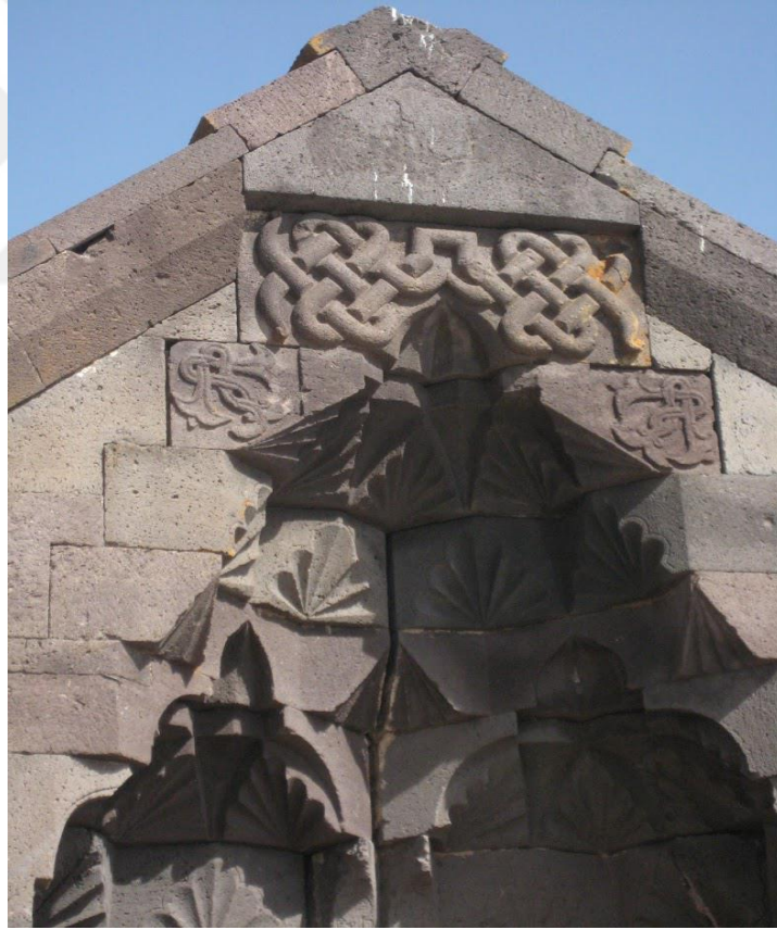
Selim Kervansarayı / Nahçıvan'a yakın Dereleyez bölgesi. (Günümüzde Ermenistan sınırları içindeki İlhanlı dönemi kervansarayı, Ebu Said Bahadır Han döneminde inşa edilmiştir. (Ek: 5)