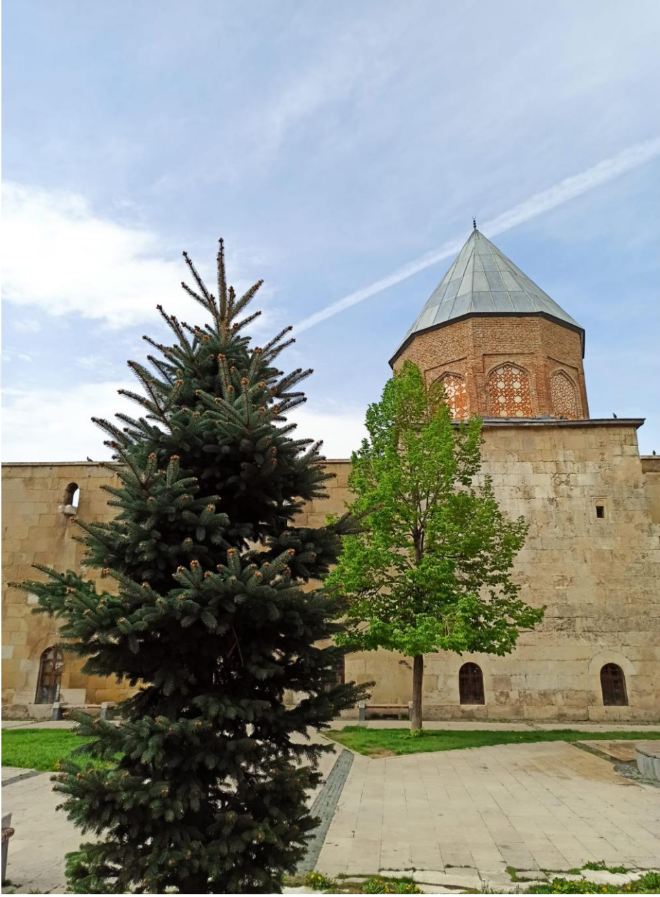
(Ek: 1) Sultan I. İzzeddin Keykavus Türbesi / Sivas