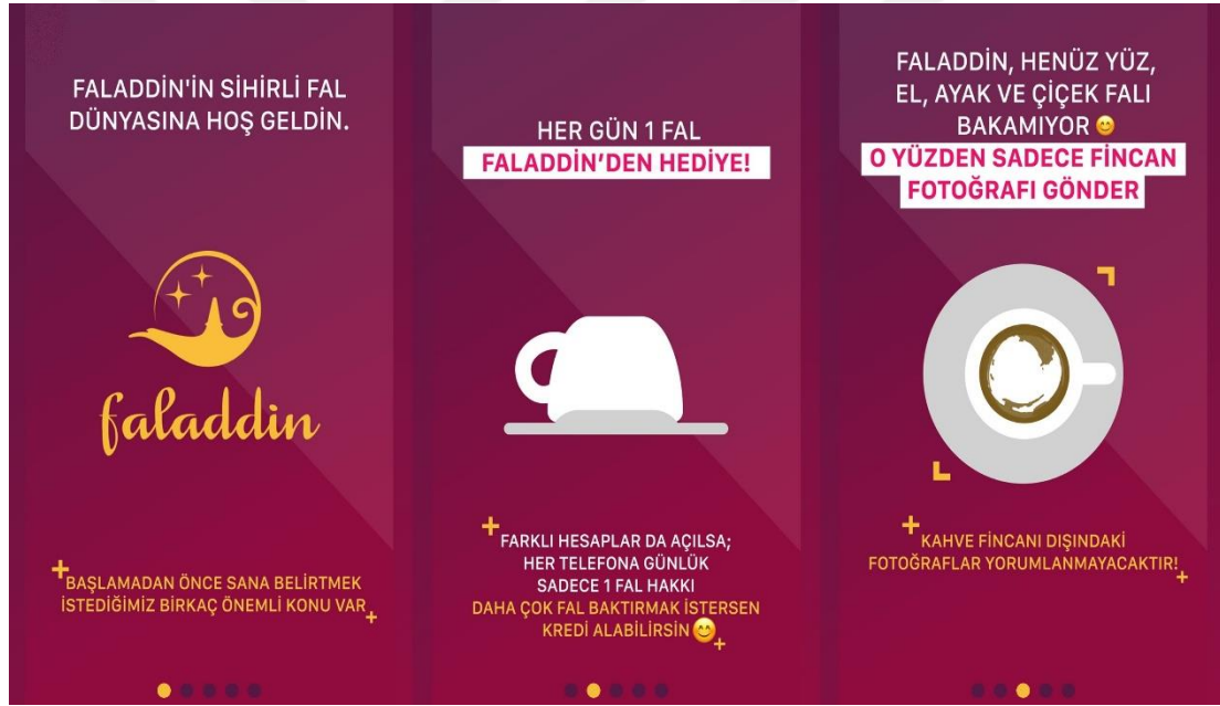
Resim.2.Fal Uygulaması 215

Aynı şekilde insanların hem kendi hayatlarına hem de evrene dair somut bir şeyler görme ihtiyaçları da okült inançlara yönelmelerine sebep olabilmektedir. Bu görme ihtiyacı akli görme ve bilme unsurları devre dışı bırakılarak yalnızca göz ile tamamlanmaya çalışıldığı için de doldurulmaya çalışılan manevi boşluk giderek artmaktadır. Göz, nasıl ki görmek için tek başına yeterli olmamakta ve dışardan gelecek olan bir ışığa ihtiyaç duyuyorsa, aklın da hakikatin asıl bilgisine ulaşmak için birtakım bilgilere ihtiyacı söz konusu olmaktadır. 214 Ancak günümüz insanları görme ve aklın muhtaç olduğu hakikat bilgisine okült inanışları takip ederek ulaşmakta ve giderek kendi dinine yabancılaşmakta, manevi tatmini tamamen bu yollarla aramaktadır.