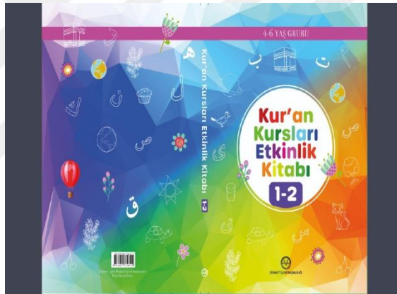
Kaynak: Diyanet İşleri Başkanlığı, Kur'an Kursları Etkinlik Kitabı 1-2 ( 4-6 Yaş Grubu), 2021, Ankara

Kitaplar giriş ve iki bölümden oluşmakta. Birinci bölüm "Dini Bilgiler" ikinci bölümler ise "Kur'an-ı Kerim" öğretimine dair ünitelerden oluşmaktadır. Kitaplarda, Kur'an-ı Kerim öğretimi, temel dinî bilgiler ve ahlaki değerler, üniteler hâlinde ele alınarak drama, eğitsel oyun, hikâye, boyama, şiir, şarkı vb. etkinliklerle desteklenmiştir. Ayrıca her hafta bu etkinlikleri pekiştirecek, sürece veliyi de dâhil edecek performans ödevlerine yer verilmiştir.