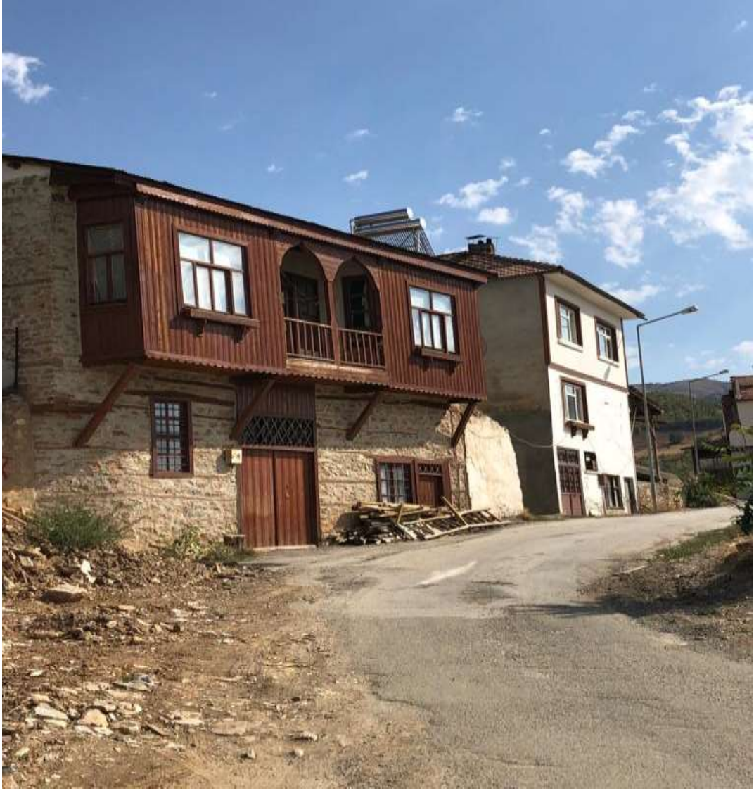
Foto 6. Pütürge Evleri