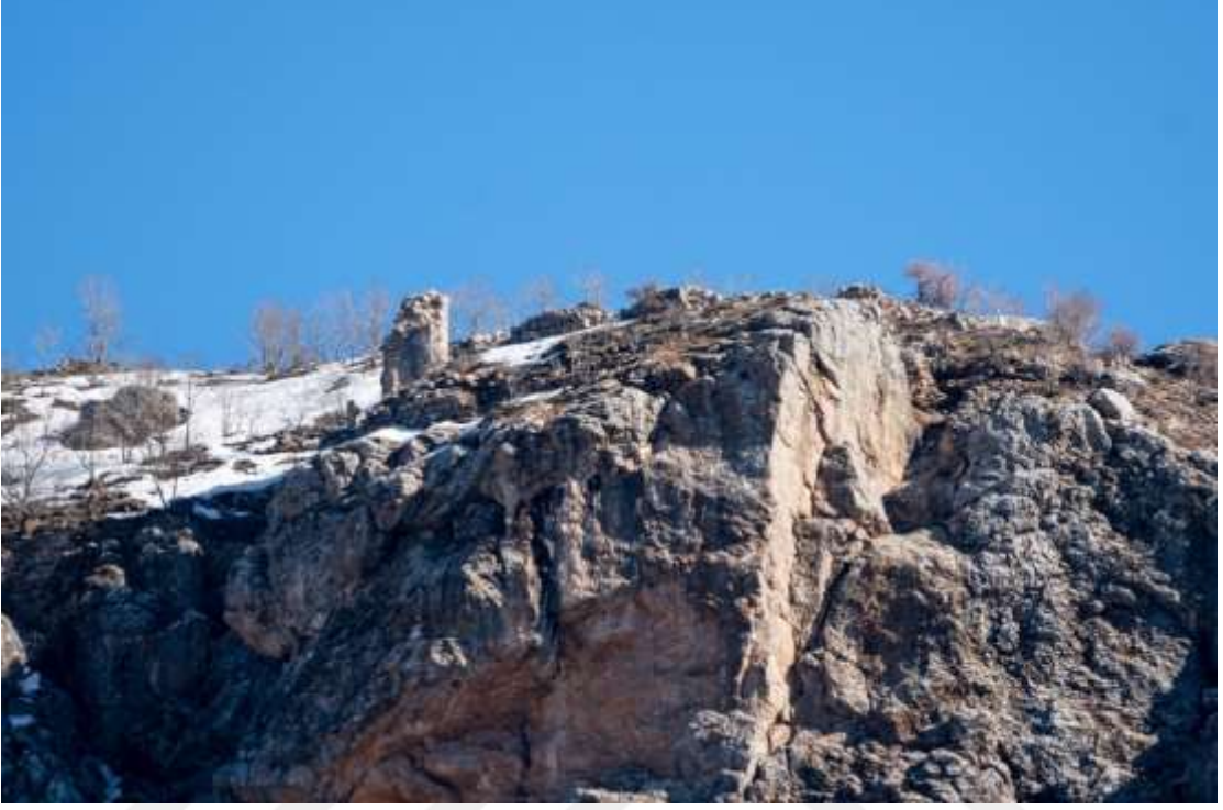
Foto 1. Dilber Kalesi