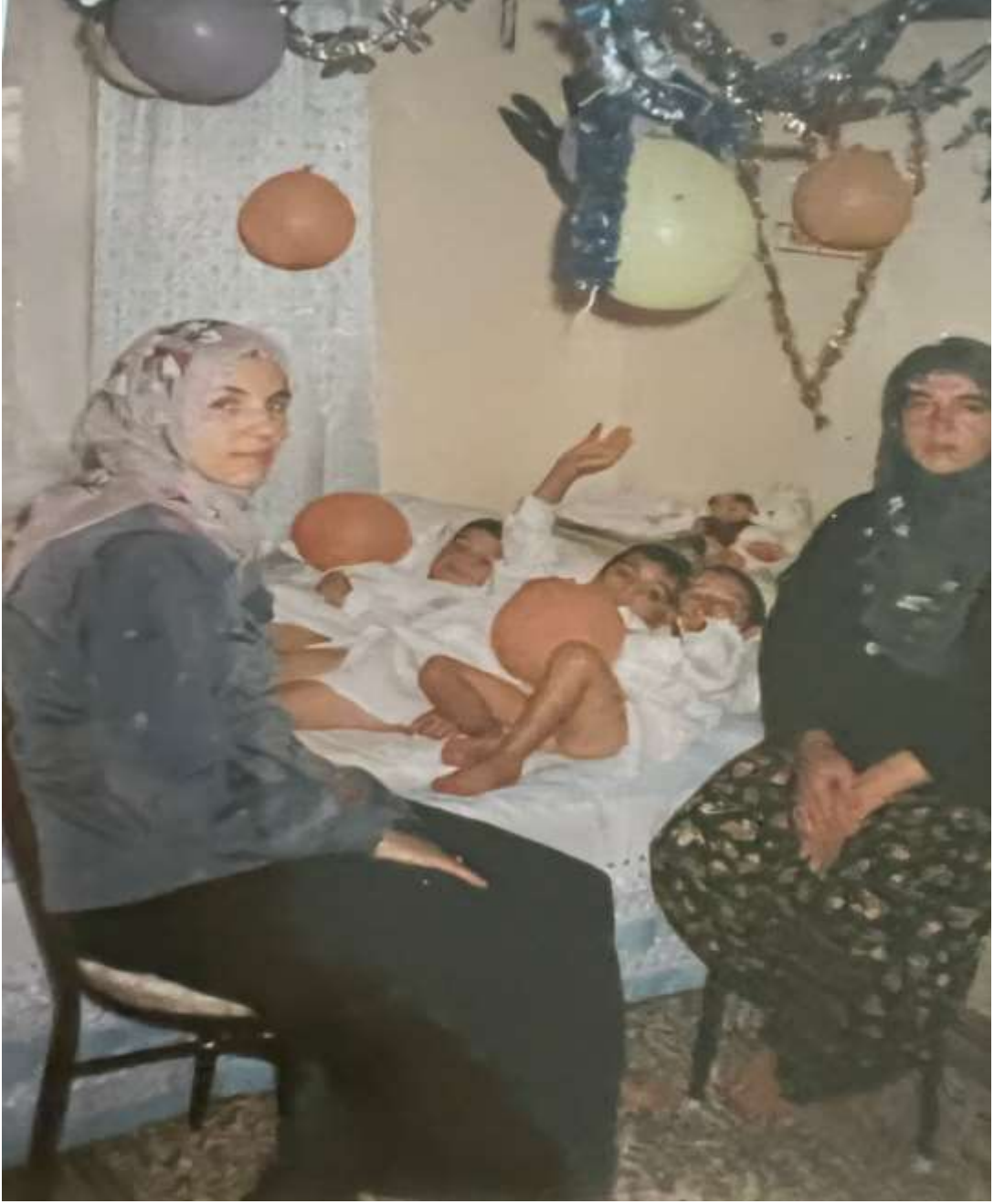
Foto 12. Sünnet Evi