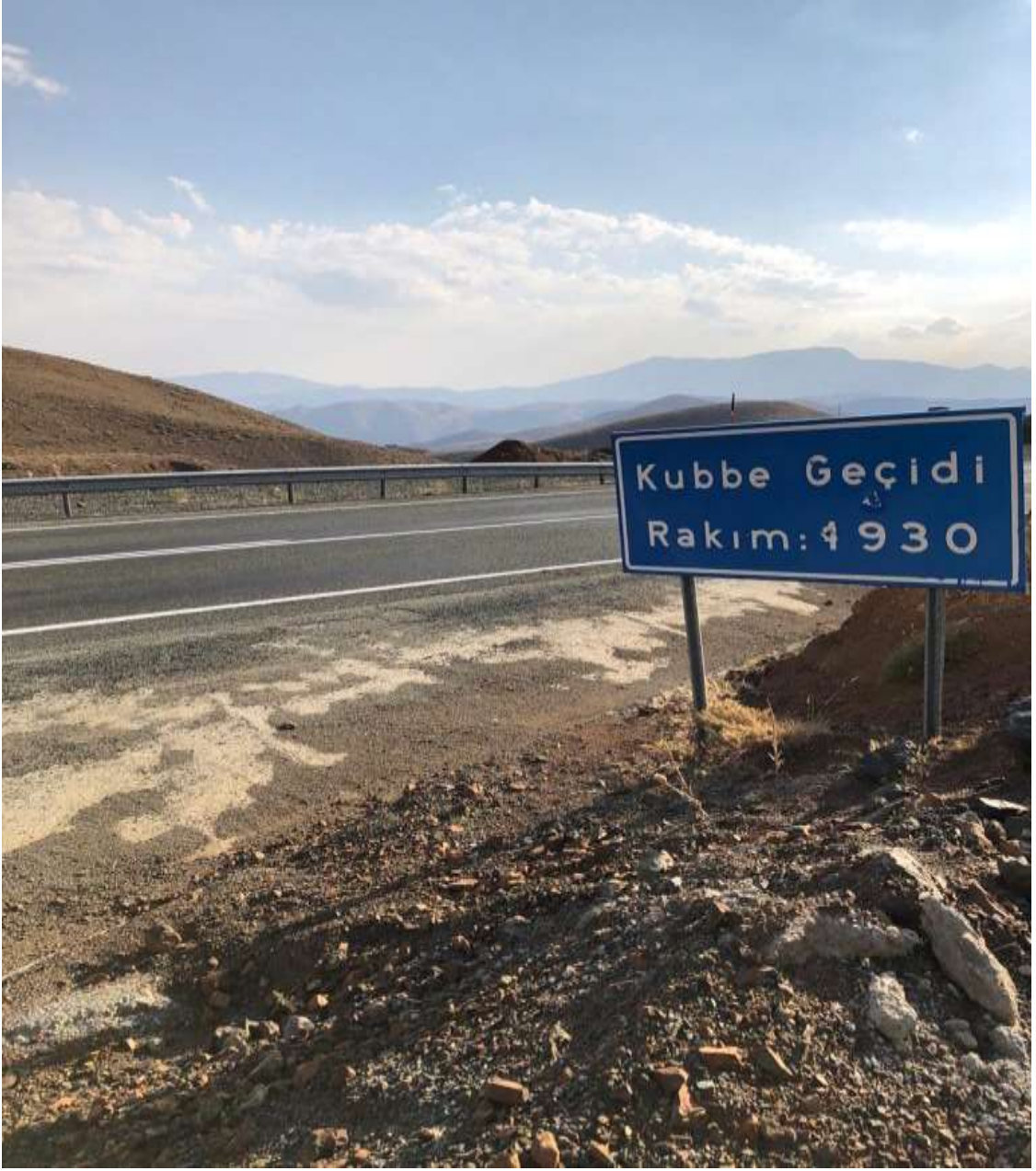
Foto 8. Kubbe Bölgesi