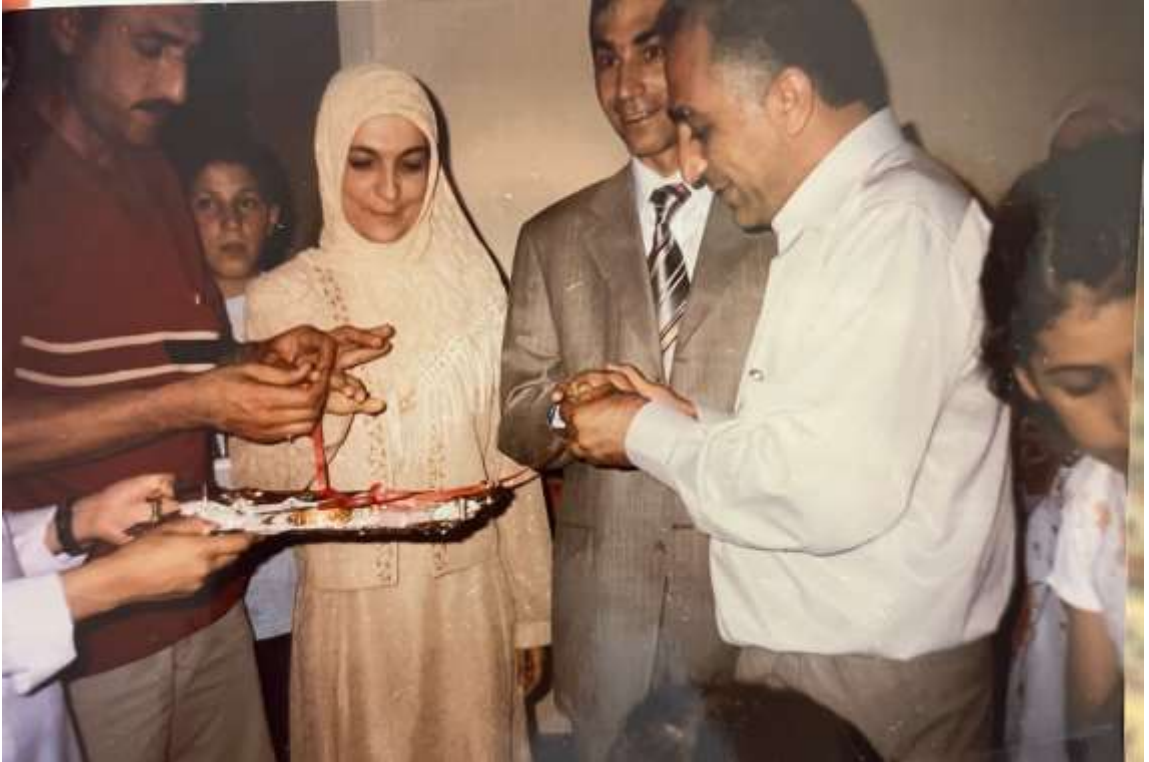
Foto 11. Nişan Yüzükleri Takılırken