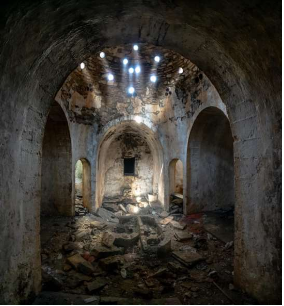
Foto 3. Çeçeli Hamamı