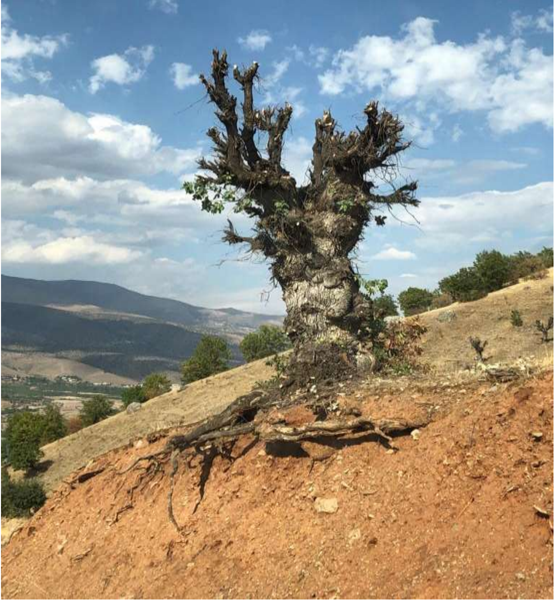
Foto 4. Hayvanlara verilmek üzere budanan ağaç