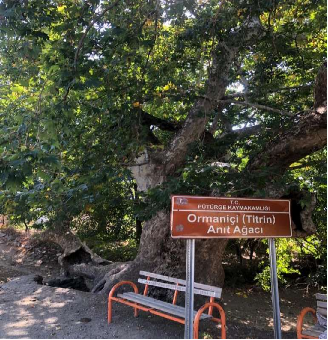
Foto 2. Anıt Ağacı