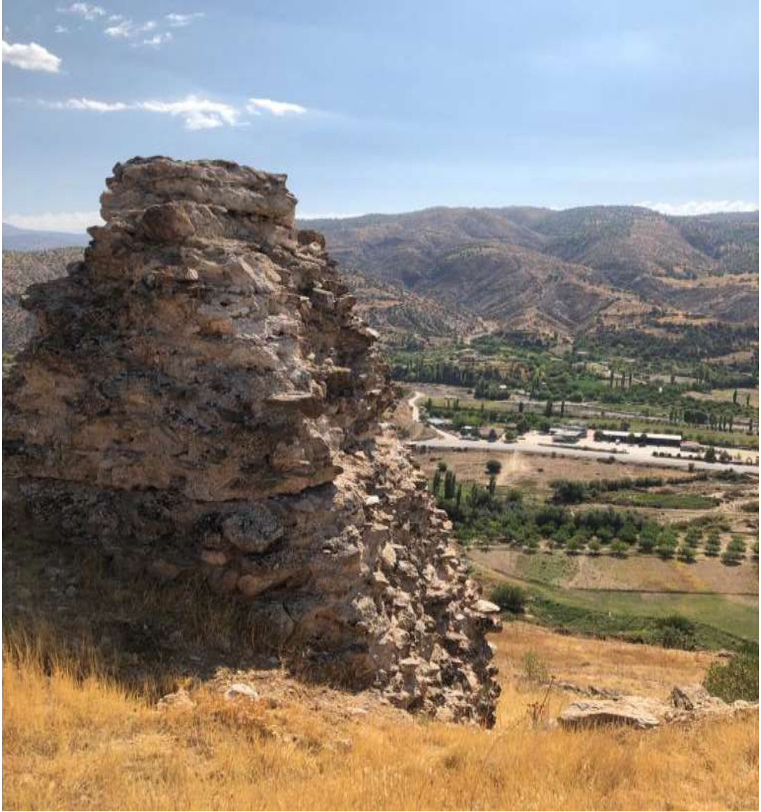
Foto 5. Kerar Kalesi