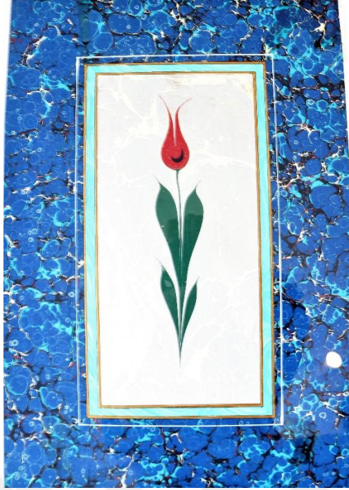
Resim 11. MABESEM’de Ebru Eseri