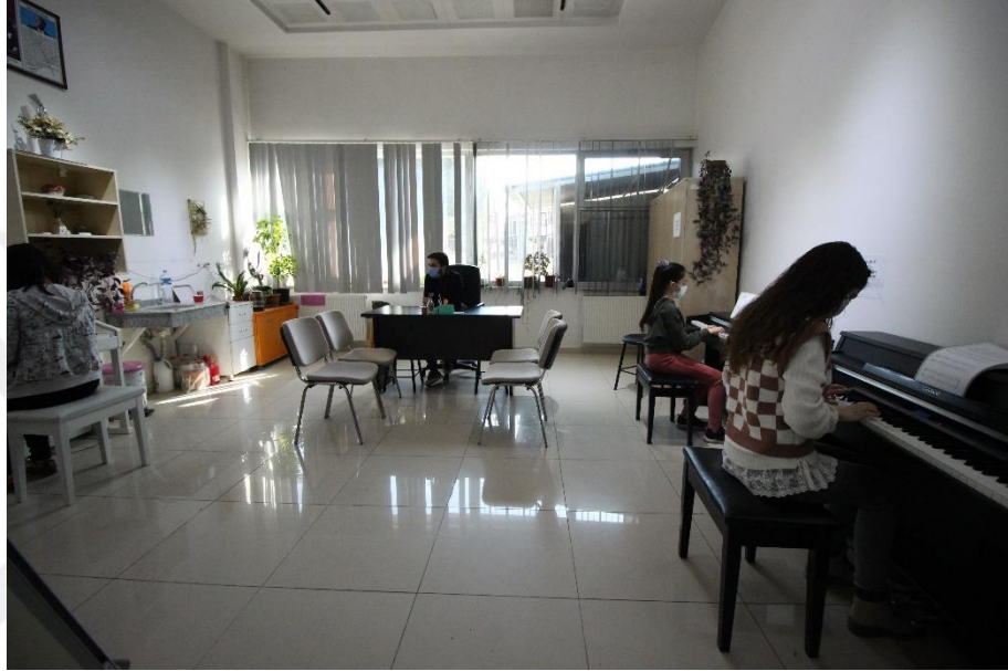
Resim 24. MABESEM'DE Piyano Kursu

Piyano kursuna MABESEM müzik atölyesinde genellikle çocuk gruplarına hitap etmektedir. Bire bir çalışmaların ön plana çıktığı piyano kursu belirli kişi sayısına göre verilmektedir. Piyano kursu ile kursiyerlerin müzik teorisi hakkında bilgi sahibi olmaları, piyano çalma tekniklerini öğrenmesi ve piyano edebiyatından parçaları tekniğe uygun şekilde çalması amaçlanmaktadır (MEB, 2016: 1-2).