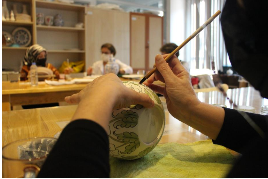
Resim 19. MABESEM’de Seramik Kursu