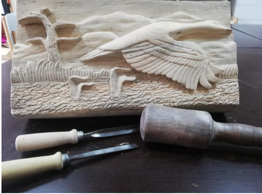
Resim 4. MABESEM’de Ahşap Oyma Kursu