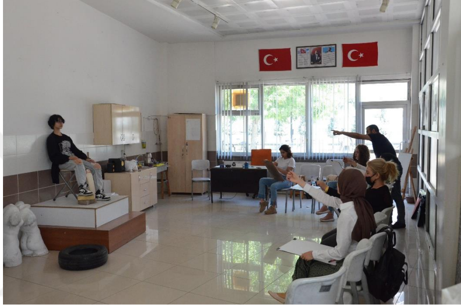
Resim 30. MABESEM’de Karakalem Kursu

hakkında bilgi sahibi olmasını sağlamak ve bunları resim kağıtları üzerinde uygulamaya geçirmesini sağlamak, Tors veya cansız modellerle çalışırken boyut ve anatomi bilgilerine sahip bir şekilde hacimlendirme yapmasını sağlamak, portre çalışması yapmasını sağlamak amaçlanmaktadır. Karakalem kursu ile ayrıca kursiyerlerin Güzel sanatlar liselerine, üniversitelerin Eğitim ve Güzel Sanatlar fakültelerinin yetenek sınavlarını kazanmasını sağlamak amaçlanmaktadır (MEB, 2017: 2).