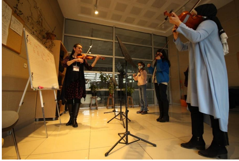
Resim 22. MABESEM'DE Keman Kursu