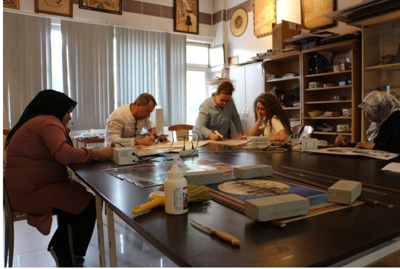
Resim 5. MABESEM’de Ahşap Yakma Kursu