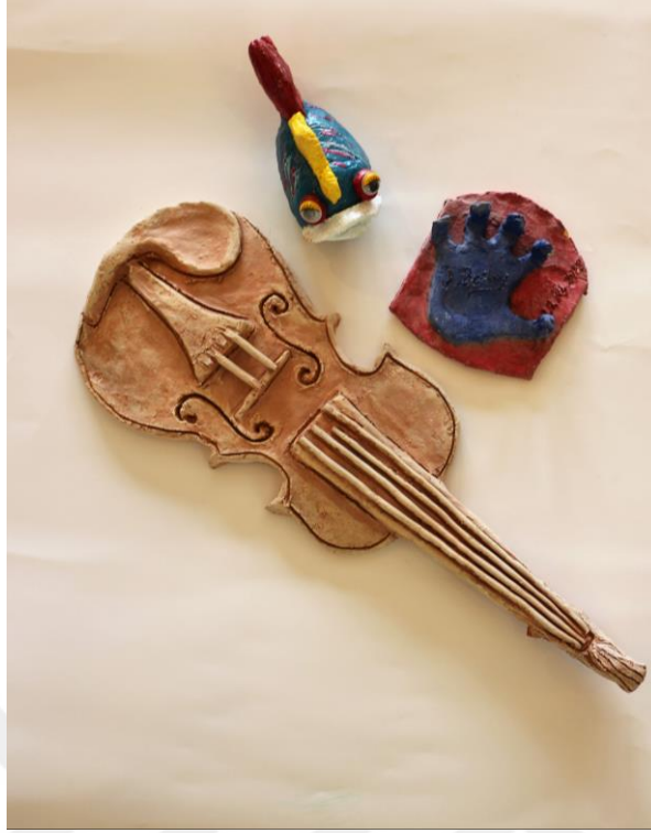
Resim 18. MABESEM’de Kil Şekillendirme Eseri