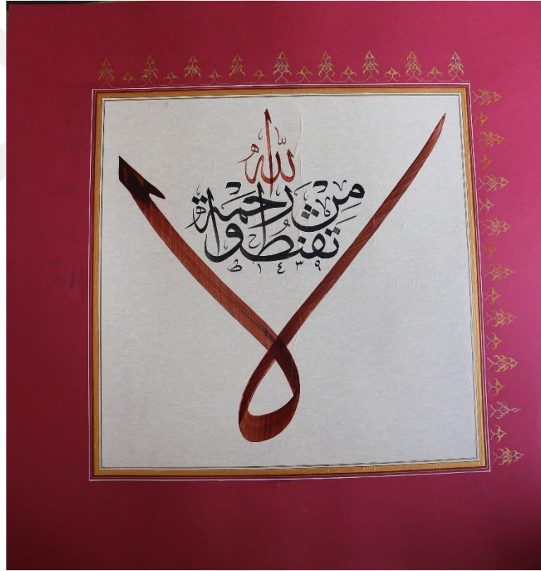
Resim 13. MABESEM’de Yapılmış Hüsni hat Eseri