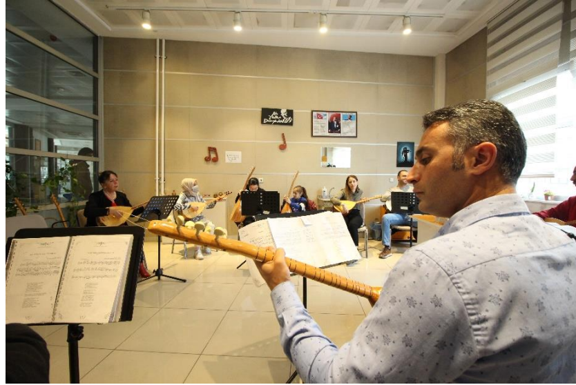
Resim 20. MABESEM’de Bağlama Kursu