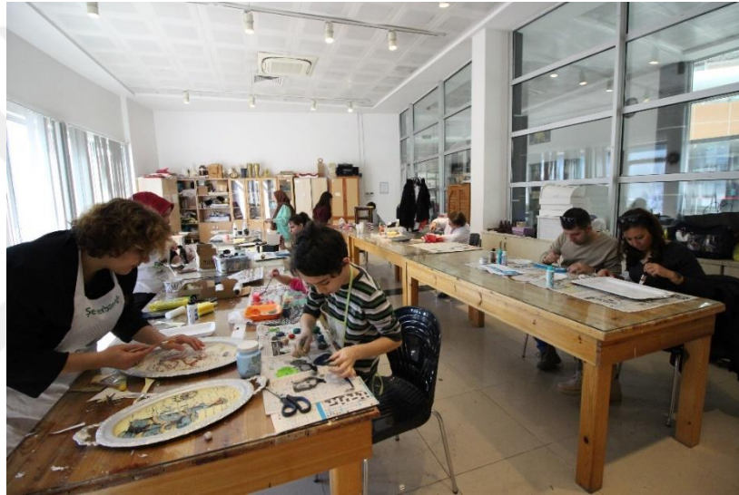
Resim 3. MABESEM’de Ahşap Boyama Kursu

Ahşap boyama kursu, MABESEM’de Sabah grubu, öğleden sonra ve akşam grubu olarak üç ayrı zaman diliminde verilmektedir. Ahşap boyama kursu, yaş grubu olarak 16 yaş ve üzerine hitap etmektedir. Genellikle kadın kursiyerin ağırlıklı olarak katıldıkları ahşap boyama kursu, kursa katılan kişilerin zamanını değerlendirmesini, kursun alanının gerektirmiş olduğu temel yeterliliğe sahip olmaları ve ilerideki yaşamlarında meslek kazanmasına olanak sağlamaktadır (Milli Eğitim Bakanlığı Hayat Boyu Öğrenme Genel Müdürlüğü [MEB], 2008: 5-6).