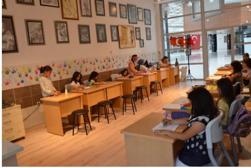
Resim 31. MABESEM’de Temel Sanat Eğitimi Kursu