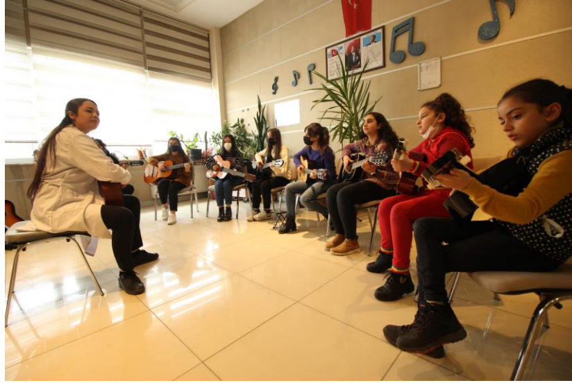
Resim 21. MABESEM'DE Gitar Kursu