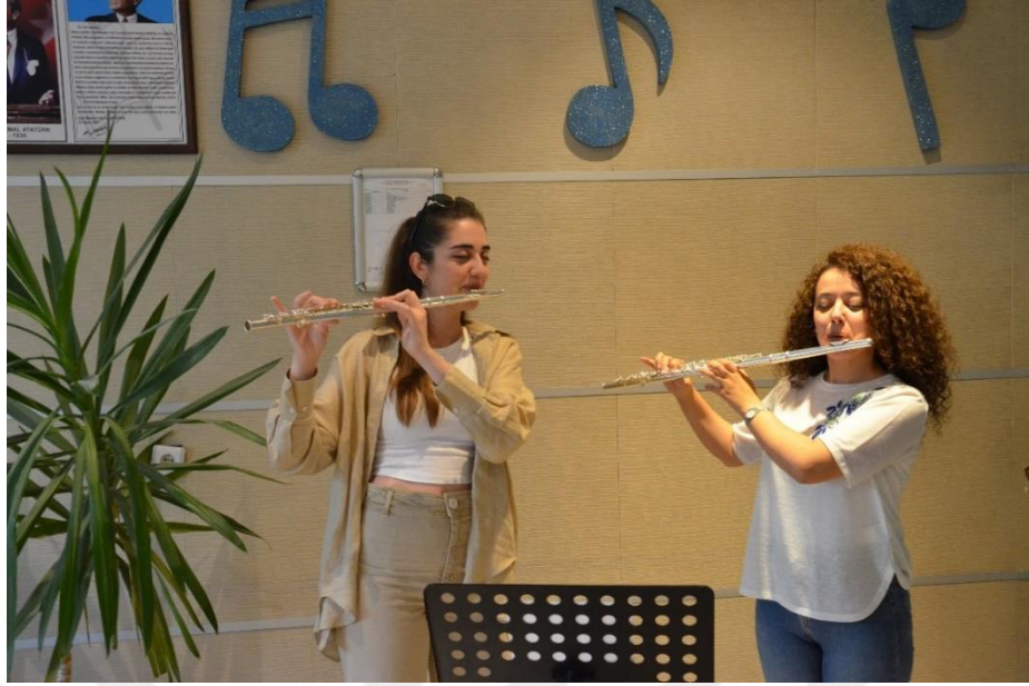
Resim 26. MABESEM’de Yen Flüt Kursu