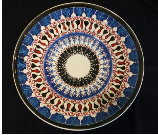
Resim 9. MABESEM'DE Çini Eseri