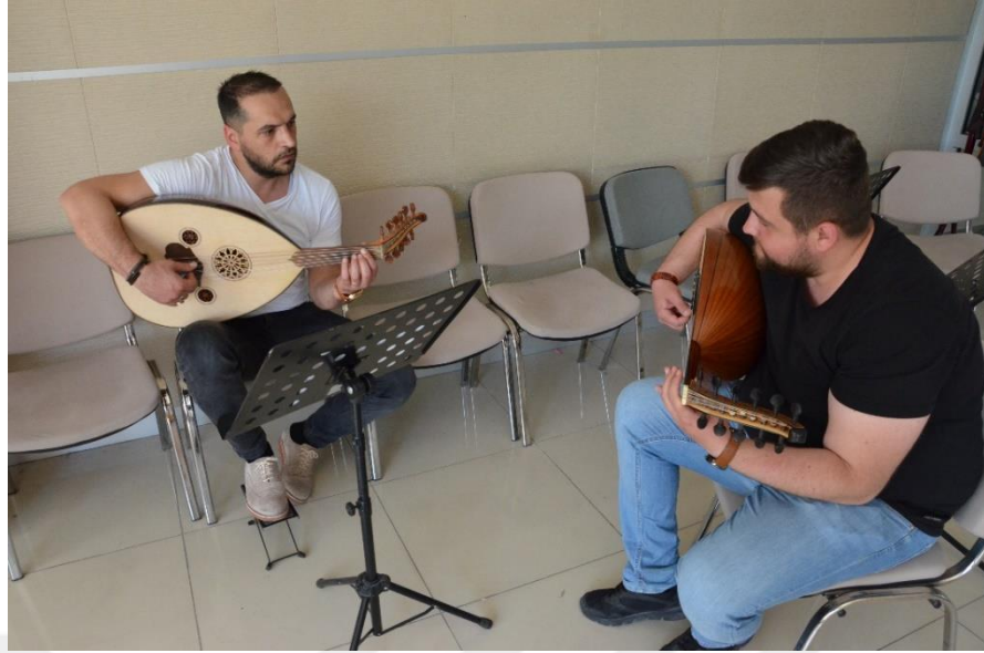
Resim 25. MABESEM'DE Ut Kursu