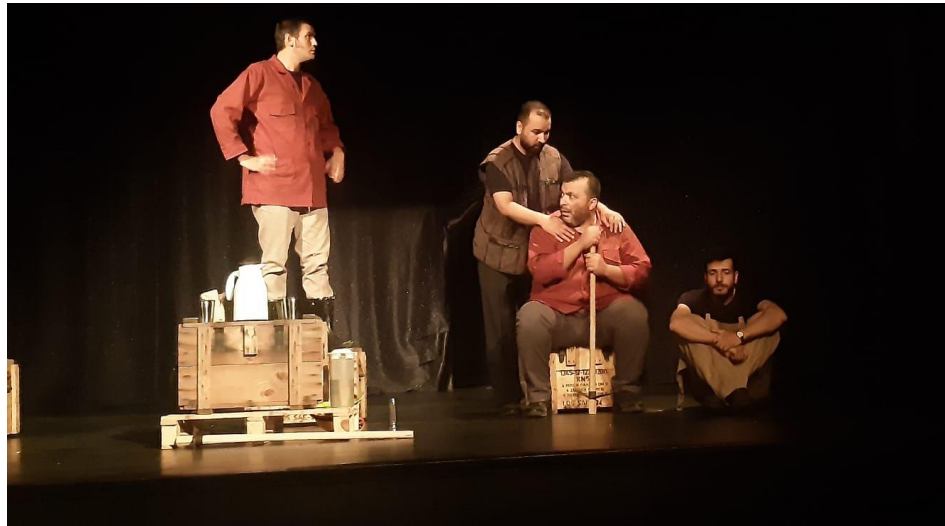
Resim 27. MABESEM’de Tiyatro Kursu

Sanat merkezinde (MABESEM) kurulan tiyatro salonu ile farklı yaş gruplarına eğitim verilmektedir. Farklı saat dilimlerinde hafta içi sabah, öğlen iki program hafta sonu ise sabah dört ayrı programda tiyatro eğitimi verilmektedir. Tiyatro kursu ile kursiyerlere diksiyon, şan, dans ve ritim çalışmaları yaptırarak bu konularda bilgi sahibi olmalarını sağlamak, senaryo ve oyun metni okuyarak metnin çözümlemesini yapma ve uygulamasını sağlamak, makyaj, dekor ve kostüm hakkında bilgi sahibi olmasını ve bunları etkili biçimde kullanmasını sağlamak ve öğrendiği bilgileri sahnede uygulamasını sağlamak amaçlanmaktadır (MEB, 2018: 2).