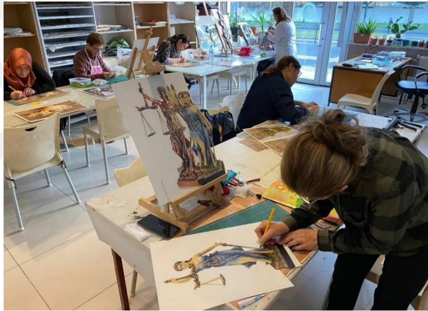
Resim 7. MABESEM’de Kağıt Rölyef Kursu

Kağıt rölyef kursu MABESEM (sanat merkezi) de hafta içi/ tam gün olarak verilmektedir. Kağıt rölyef kursuna genellikle bayan kursiyerler katıldığı bu kurs yine 16 yaş üzerine hitap etmektedir. Kağıt Rölyef kursu ile kursiyerlere temel seviyede iş sağlığı ve güvenliği eğitimi, geometrik tasarım ilkelerine uygun bezeme ve yüzey düzenlemeleri, nokta ve çizgi elemanlarını kullanarak yüzey düzenlemesi yapmayı, hacimlendirilen nesnelere ile yüzey düzenlemesi yapmayı ve kağıt rölyef ürünü ortaya çıkarmaları amaçlanmaktadır. Kağıt rölyef kursuna katılan kursiyerlerin MABESEM'in sunduğu ferah atölye ortamında kursiyerlerin meslek kazanımı ve kursiyerlere maddi geri dönüş sağlanmıştır (MEB, 2018: 2).