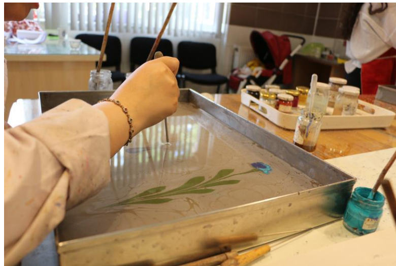
Resim 10. MABESEM'de Ebru Kursu

Ebru kursu MABESEM'de iki farklı saat diliminde öğrencisiyle buluşmaktadır. Sabah grubu ve öğle grubu olmak üzere ebru kursuna gelen öğrenci yaş grubu genellikle yetişkin yaş grubudur. Ebru kursu ile kursiyelere Geleneksel Türk el ve süsleme sanatları hakkında bilgi sahibi olmaları, renkli yüzey düzenlemesi yapmayı, geometrik formlarla tasarım ilkelerine uygun şekilde yüzey düzenlemesi yapmayı, açık-koyu ile hacimlendirdiği nesnelere yüzey düzenlemesini yapması, Ebru boyama uygulaması yapması ve ebru boyama tekniği ile ürün ortaya çıkartmayı öğretmek amaçlanmaktadır (MEB, 2023: 2).