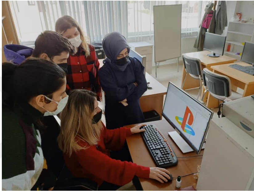
Resim 29. MABESEM’de Grafik Tasarım Kursu

Grafik tasarım kursu MABESEM’de kurulan grafik tasarım atölyesinde hafta içi farklı saat aralığında sabah 9.00- 12.00, öğlen 13.00- 16.00 saatleri arasında yetişkin öğrenci grubuna verilmektedir. Grafik-Tasarım kursu ile kursiyerlere CorelDraw ara yüzünü kullanmayı öğretmek, sayfa ve belgeleri kontrol etmesini ve temel nesne şekillerini oluşturabilmesini sağlamak, grafikleri metin içerisinde veya tek başına etkin şekilde kullanabilmesini sağlamak amaçlanmaktadır (MEB, 2017: 2-3).