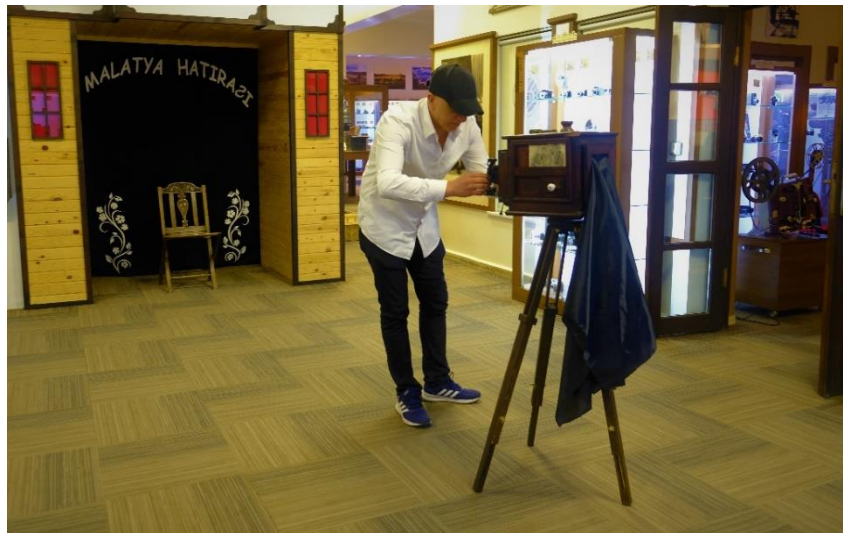
Resim 28. MABESEM’de Fotoğrafçılık Kursu

Fotoğrafçılık kursu MABESEM’de bulunan atölyede farklı zaman ve yaş grubuna uygun bir şekilde öğrencilerle buluşmaktadır. Gelen öğrencilerin teorik bilgileri kurs ortamında, pratik bilgileri ise dış mekânlarda uygulanmaktadır. Gelen kursiyer yaş grubu 16 yaş üzeri olup hafta içi iki programda verilmektedir. Fotoğrafçılık kursu ile kursiyerlere fotoğrafın tarihi ve gelişimi hakkında bilgi sahibi olmalarını sağlamak, temel seviyede fotoğraf bilgisine sahip olmasını sağlamak, fotoğraf makinesi ayar ve özelliklerini öğretmek, ortamın ışık-gölge ayarını ve özelliklerini belirlemesini öğretmek, bilgisayar ortamında fotoğraf üzerinde gerekli düzenlemeleri yapabileceği uygulamaları öğrenmesi ve kullanmasını sağlamak amaçlanmaktadır (MEB, 2022: 1-2).