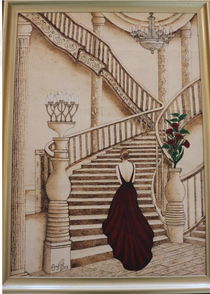
Resim 6. MABESEM’de Ahşap Yakma Eseri