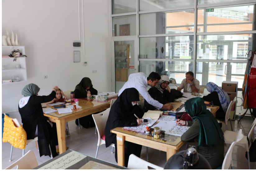
Resim 12. MEBESEM’de Hüsni Hat Kursu