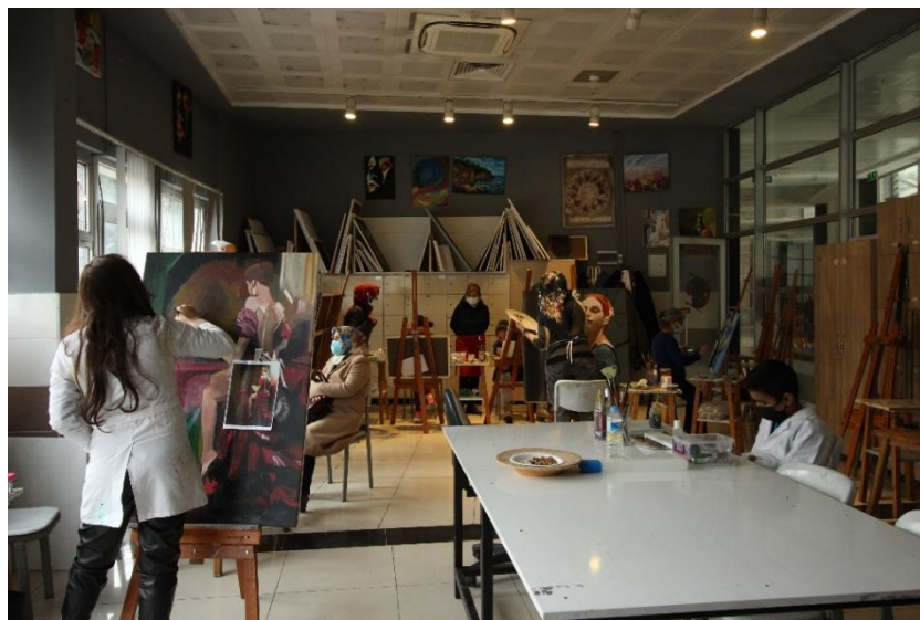
Resim 32. MABESEM’de Yağlı Boya Kursu

Sanat merkezinde yağlı boya resim çalışmasına uygun atölyede farklı saat dilimlerinde hafta içi ve hafta sonu sabah öğle akşam olmak üzere yetişkin 15 yaş üzeri kursiyerlere hizmet vermektedir. Yağlı boya kursu ile kursiyerlere resim sanatı ile ilgili temel kavram ve tanımlamaları öğretmek ve bunları eser üzerinde kullanmalarını sağlamak, yağlı boya tekniklerini tanımak ve bu teknikleri uygulamaya geçirmelerini sağlamak, yağlı boya tekniklerini aşamalar halinde kullanarak eser meydana getirmelerini sağlamak amaçlanmaktadır. MABESEM’de verilen yağlı boya kursu ayrıca kursiyerlere maddi geri dönüşte sağlamaktadır (MEB, 2017: 2).