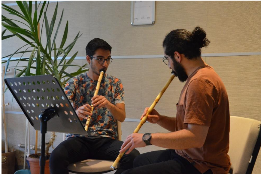
Resim 23. MABESEM'DE Ney Kursu

Ney kursu MABESEM'de farklı saat dilimlerinde genellikle yetişkin öğrenci kitlesine hitap etmektedir. Bire bir eğitim şeklinde geçen kurs sabah, öğle ve hafta sonu öğrencileriyle buluşmaktadır. Ney kursu ile kursiyerlere Ney'in tarihsel gelişimi hakkında bilgi vermek, Ney üfleme tekniğini kavramasını ve uygulamasını sağlaması, Neyden doğru ses çıkarabilmek ve diğer sazlar ile yakalanması gerekli olan ahenk birliğini kazanmasını sağlamak, Ney konusunda Türk müziği repertuarı oluşturmasını sağlamak amaçlanmaktadır (MEB, 2022: 2).