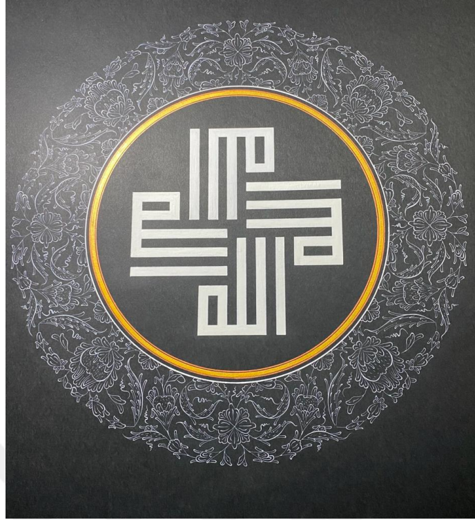
Resim 16. MABESEM’de Yapılmış Tezhip Eseri