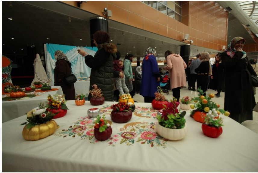
Resim 1. MABESEM'DE Düzenlenen Sergi

Bünyemizde eğitim veren resim ve geleneksel el sanatları kurslarından; eğitimci ve kursiyerler tarafından üretilen eserler, Sanat Merkezimizin sergi alanı başta olmak üzere Büyükşehir Belediye Binası, AVM, fuarlar, okullar vb. alanlarda düzenlenen sergilerle periyodik olarak vatandaşlarımızın beğenisine sunulmaktadır. Sanat Merkezimizde bulunan 1600m 2 'lik sergi ve fuaye salonumuzun açılışı; Nisan 2015'te Malatya Büyükşehir Belediyesi ve TBMM Milli Sarayların ortaklaşa gerçekleştirdiği "Kenz-i Mahfi Sergisi" ile gerçekleştirilmiştir.