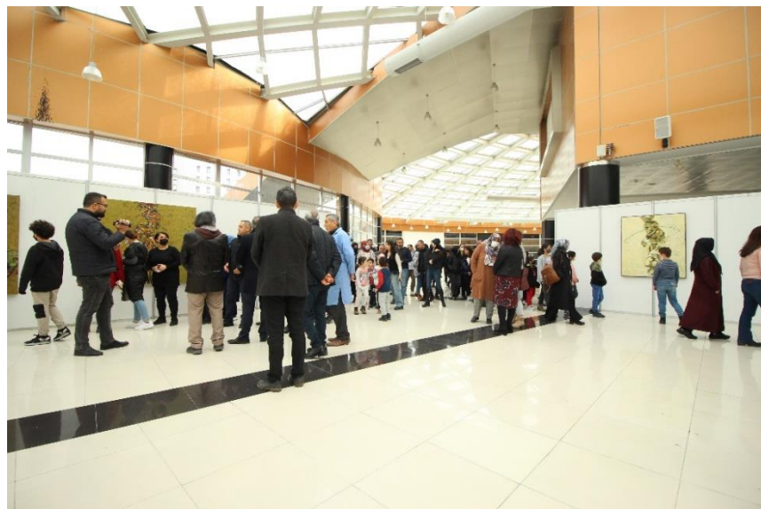
Resim 2. MABESEM'DE Düzenlenen Sergi