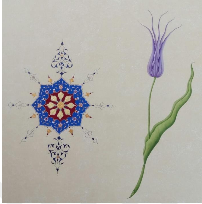
Resim 15. MABESEM’de Yapılmış Minyatür Eseri