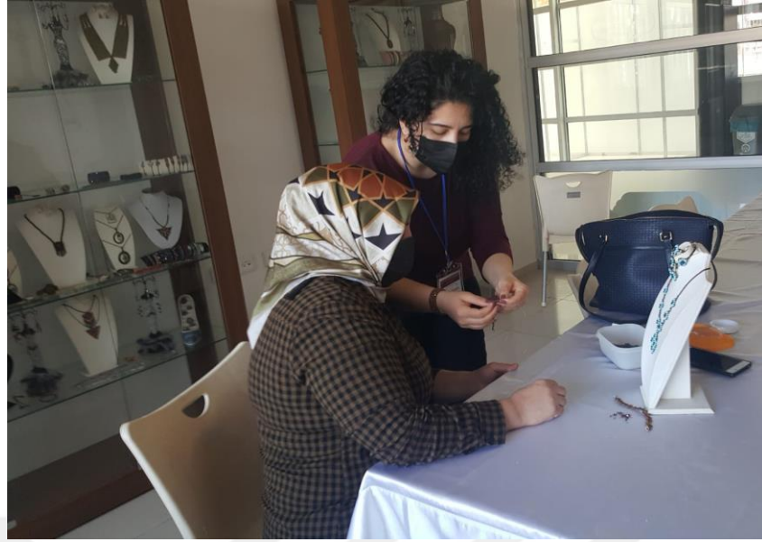
Resim 8. MABESEM’de Takı ve Tasarım Kursu