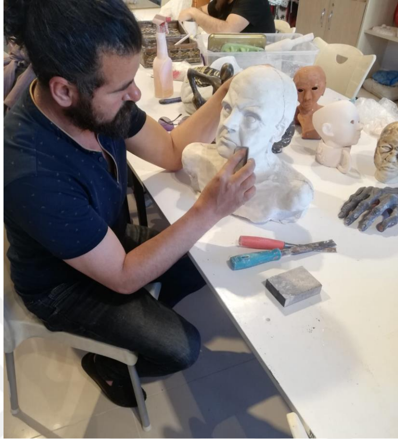
Resim 17. MABESEM’de Heykel Kursu