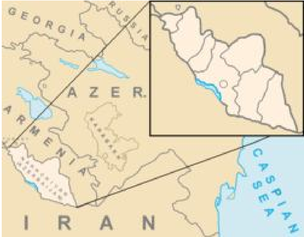
Harita 25: Nahçıvan Cumhuriyeti Haritası