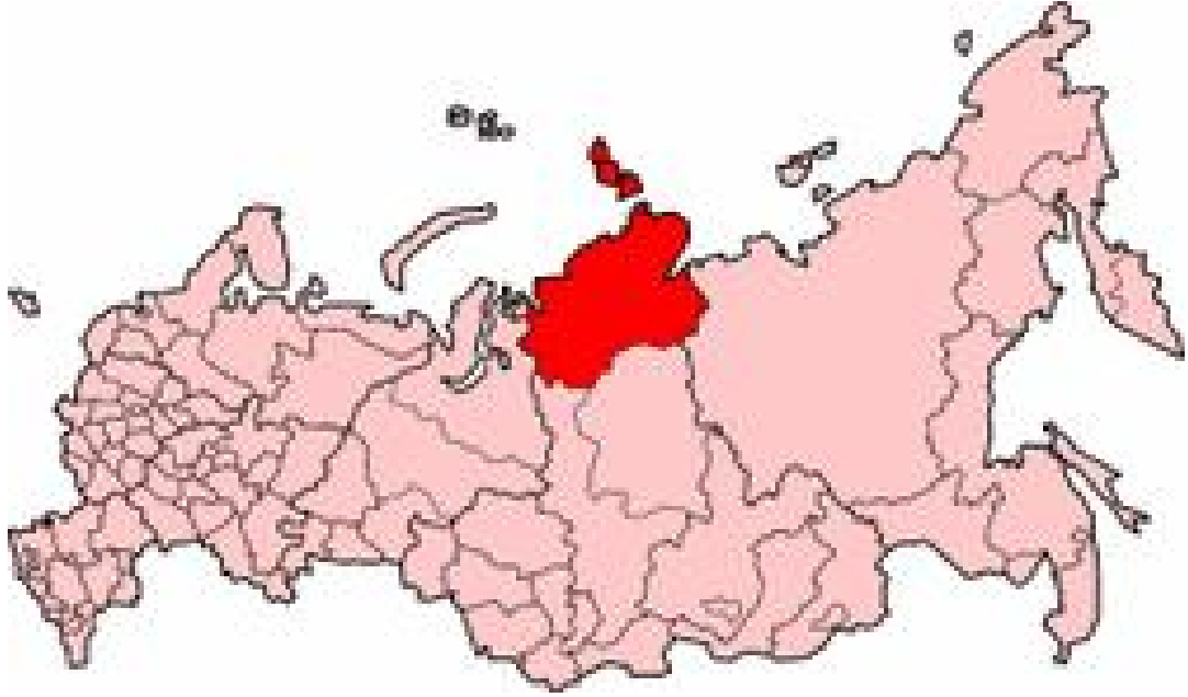
Harita 29: Taymir Haritası