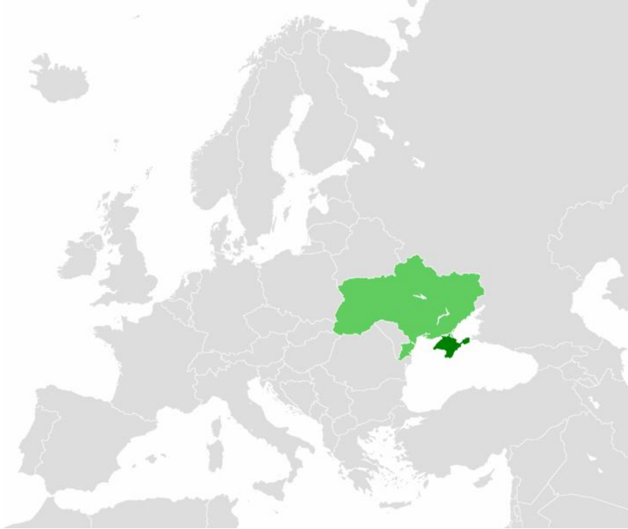
Harita 24: Kırım Özerk Cumhuriyeti Haritası