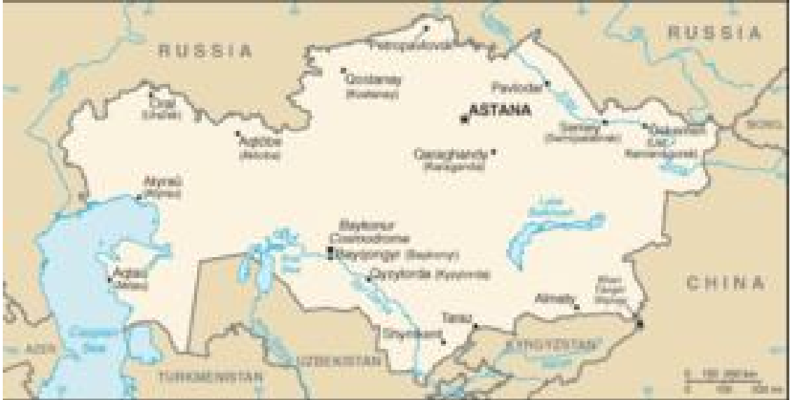
Harita 4: Kazakistan Haritası