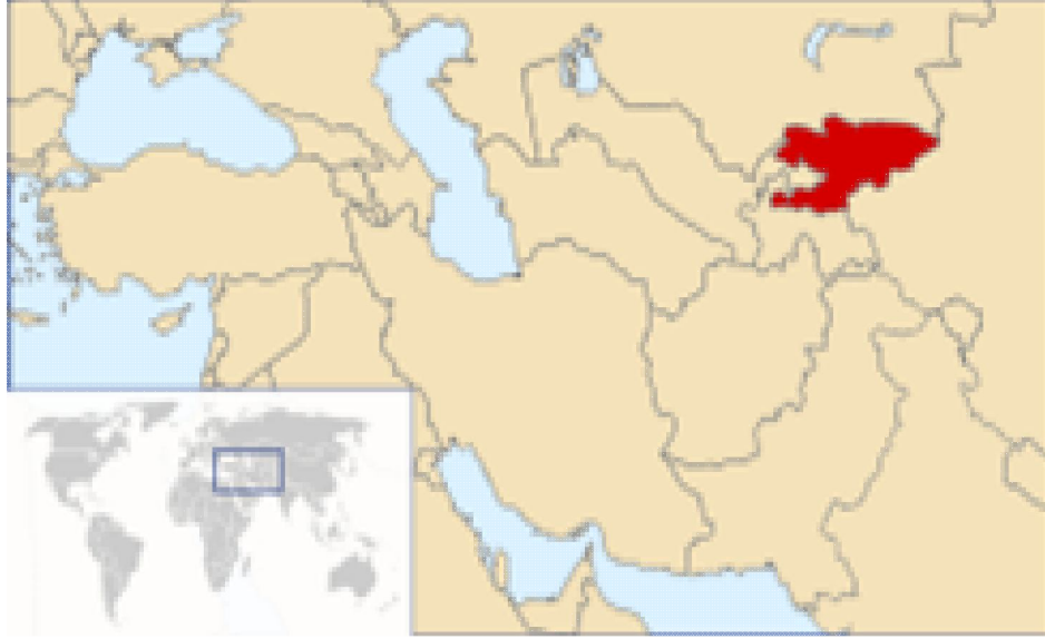
Harita 5: Kırgızistan'ın Coğrafi Konumu