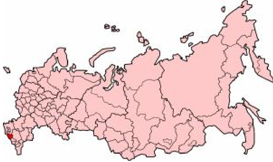
Harita 21: Karaçay-Çerkes Cumhuriyeti Coğrafi Konumu