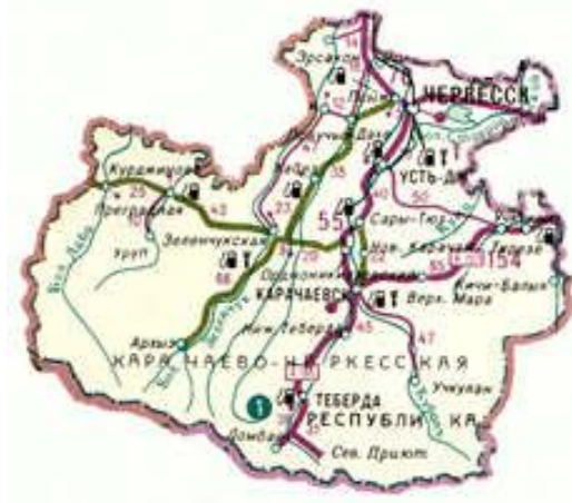
Harita 22: Karaçay-Çerkes Cumhuriyeti Haritası