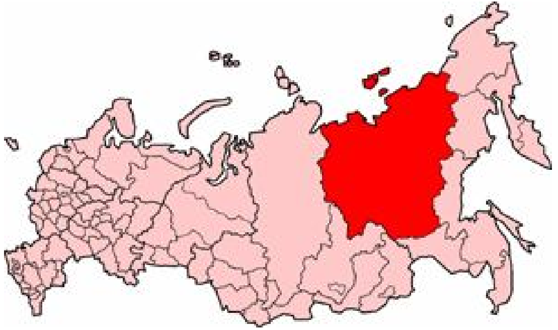
Harita 26: Saha Cumhuriyeti Haritası