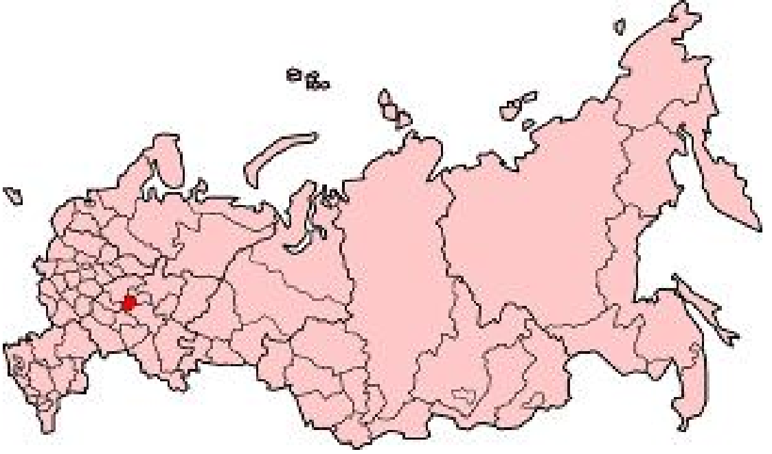
Harita 17: uvařistan Haritası