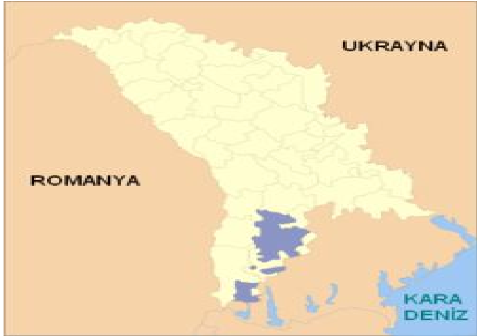
Harita 19: Gagauzya Haritası