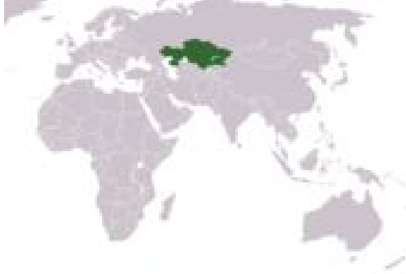
Harita 3: Kazakistan'ın Coğrafi Konumu