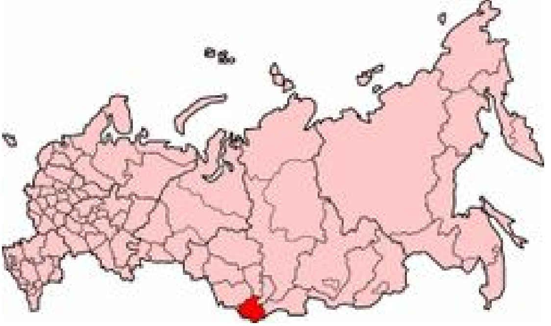
Harita 14: Altay Cumhuriyeti Haritası