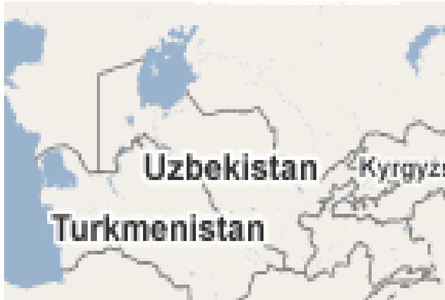
Harita 12: Özbekistan Haritası