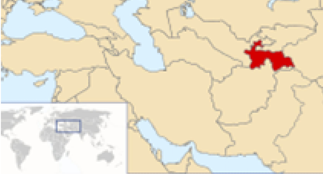
Harita 9: Tacikistan'ın Coğrafi Konumu