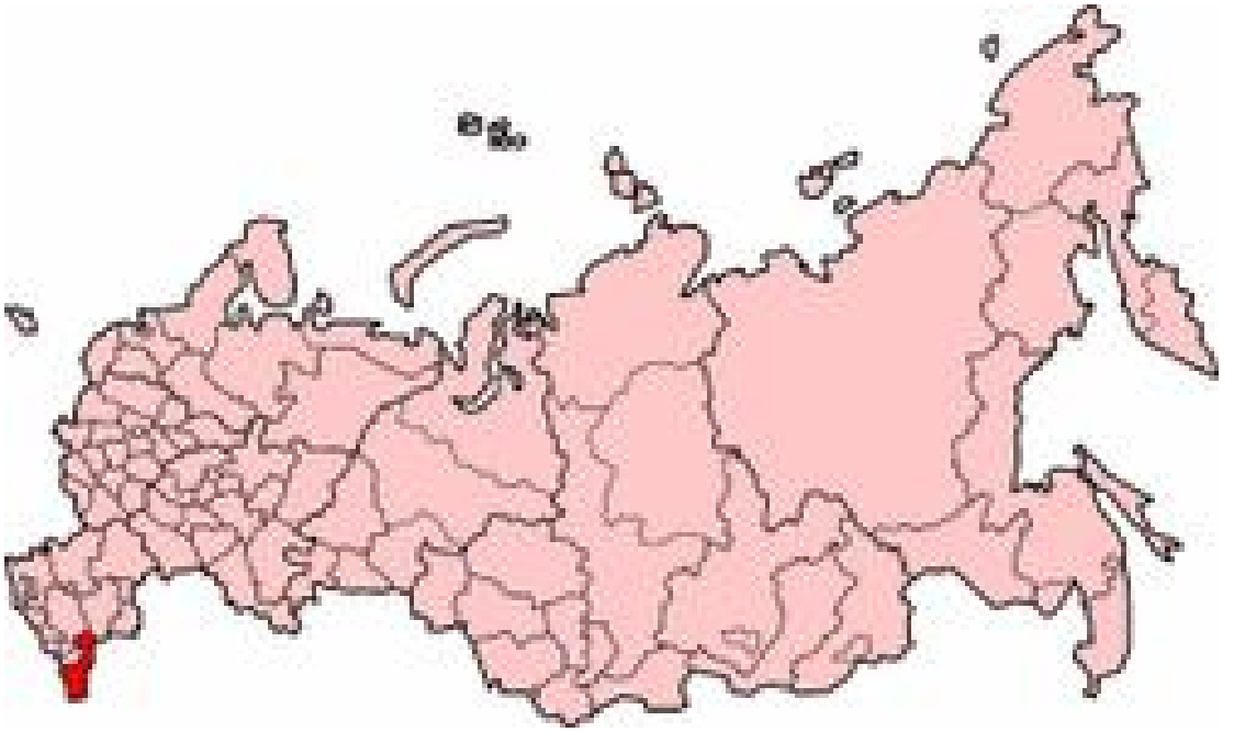
Harita 18: Dağıstan Haritası