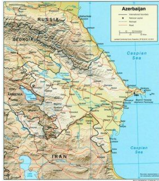
Harita 2: Azerbaycan Fiziki Haritası