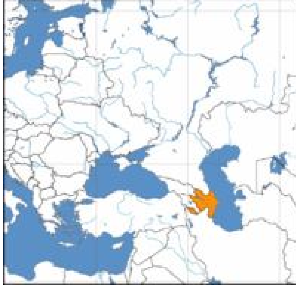
Harita 1: Azerbaycan'ın Coğrafi Konumu