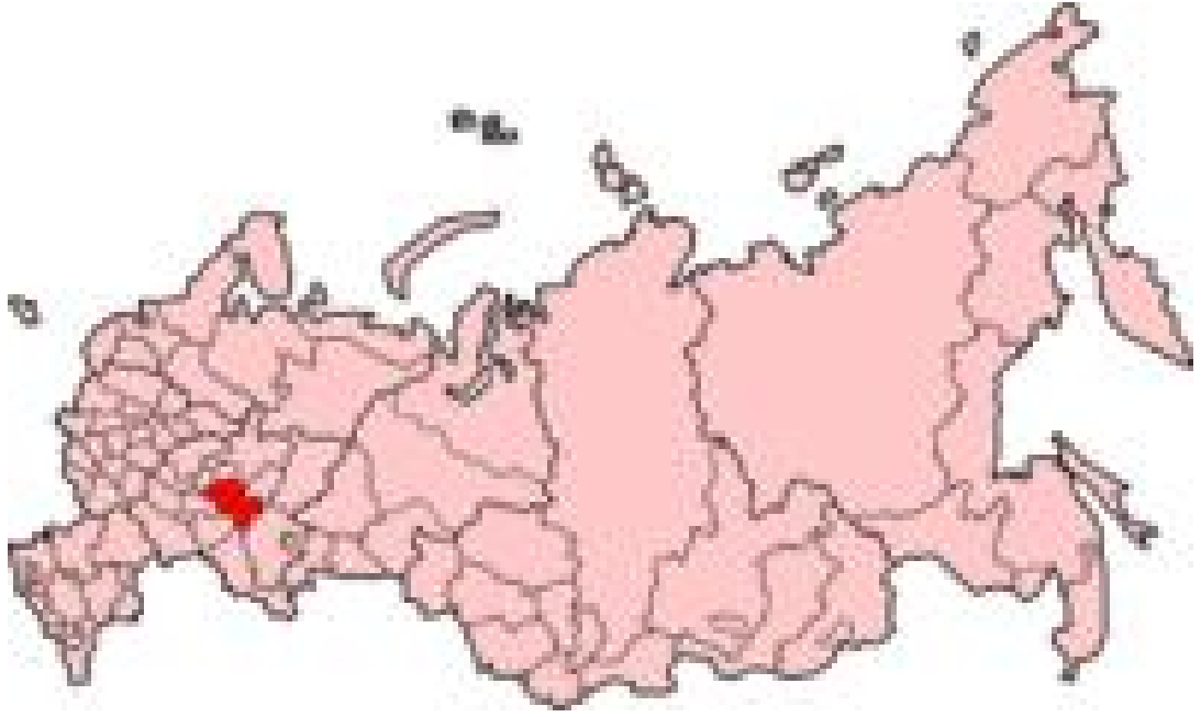
Harita 28: Tataristan Cumhuriyeti Haritası