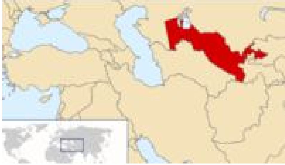
Harita 11: Özbekistan'ın Coğrafi Konumu