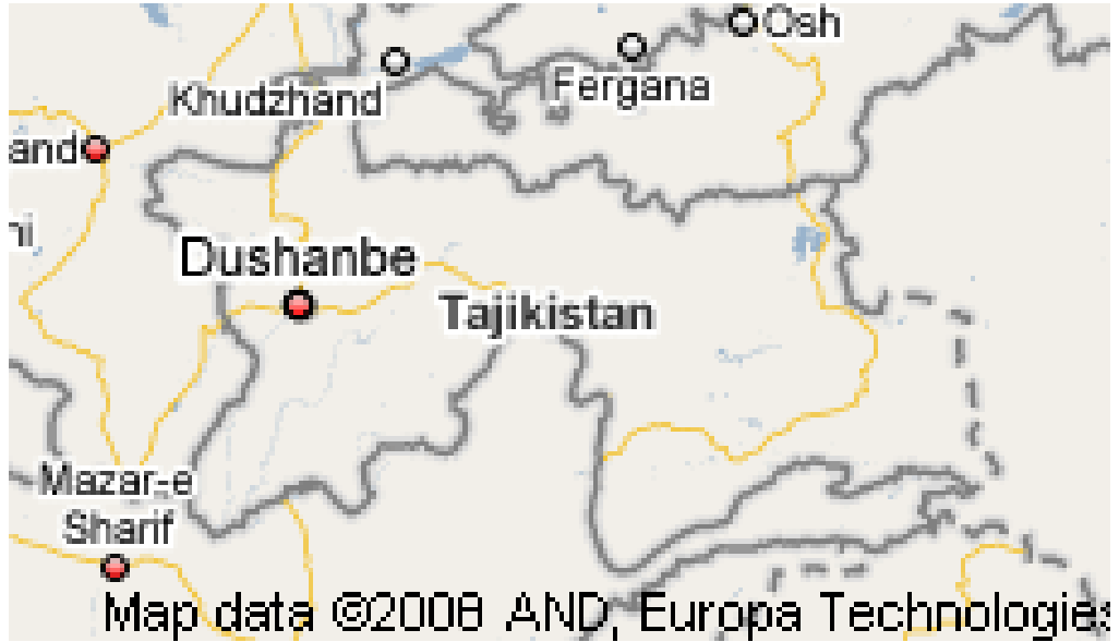
Harita 10: Tacikistan Haritası