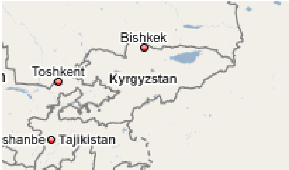
Harita 6: Kırgızistan Haritası