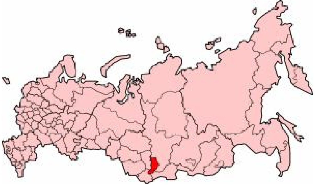
Harita 20: Hakasya Haritası