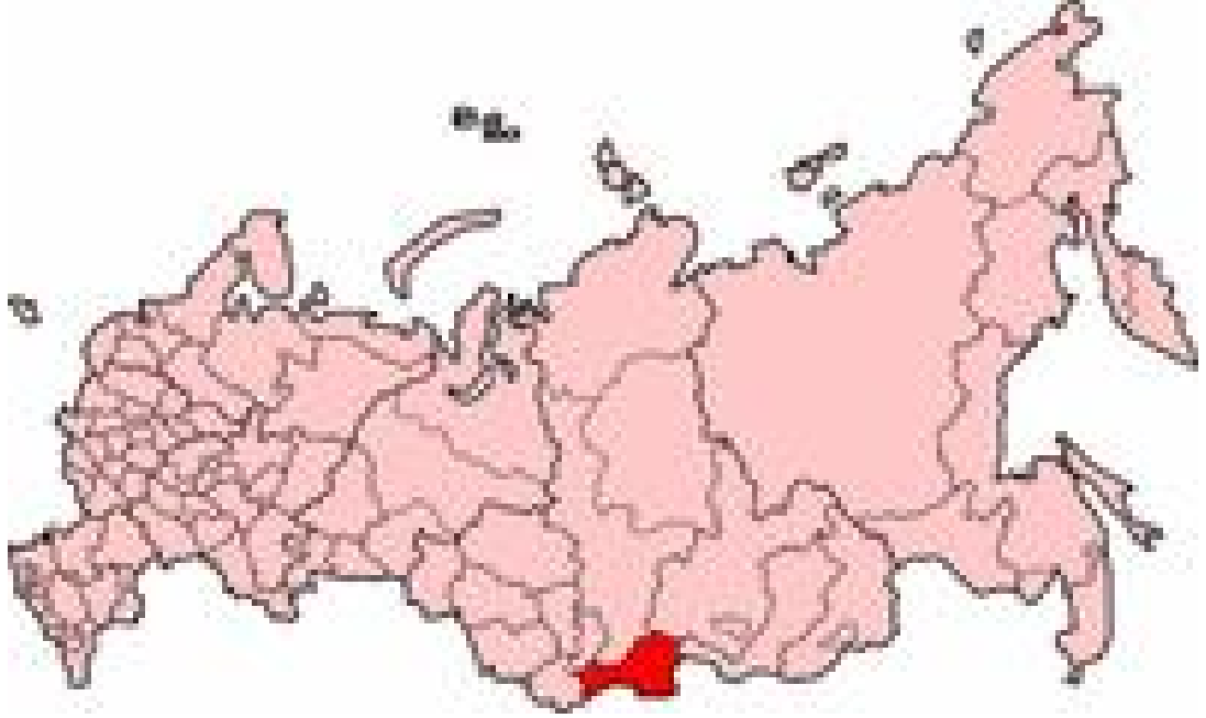
Harita 30: Tuva Cumhuriyeti Haritası