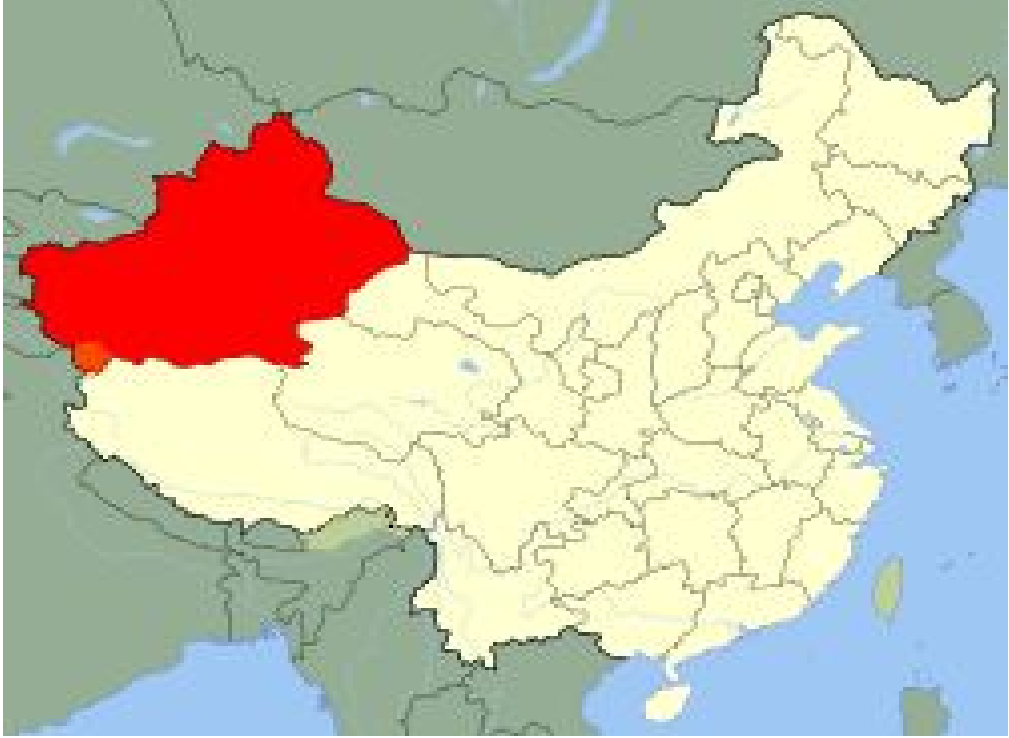
Harita 27: Sincan Uygur Özerk Bölgesi Haritası