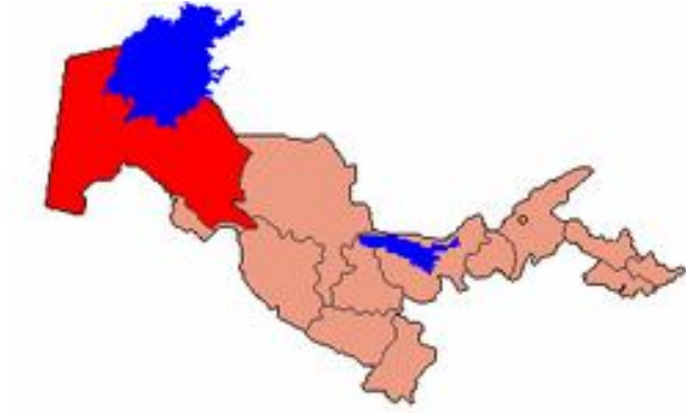
Harita 23: Karakalpak Muhtar Cumhuriyeti Haritası