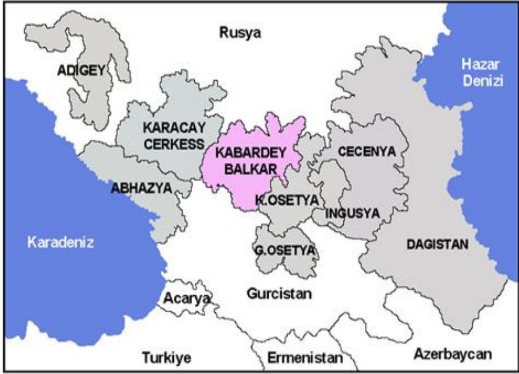
Harita 15: Kabardey-Balkar Cumhuriyeti Haritası