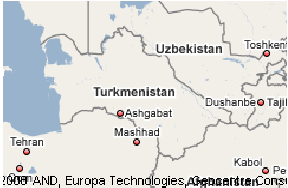
Harita 8: Türkmenistan Haritası