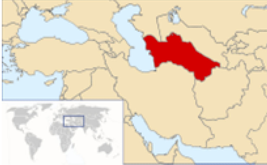
Harita 7: Türkmenistan'ın Coğrafi Konumu