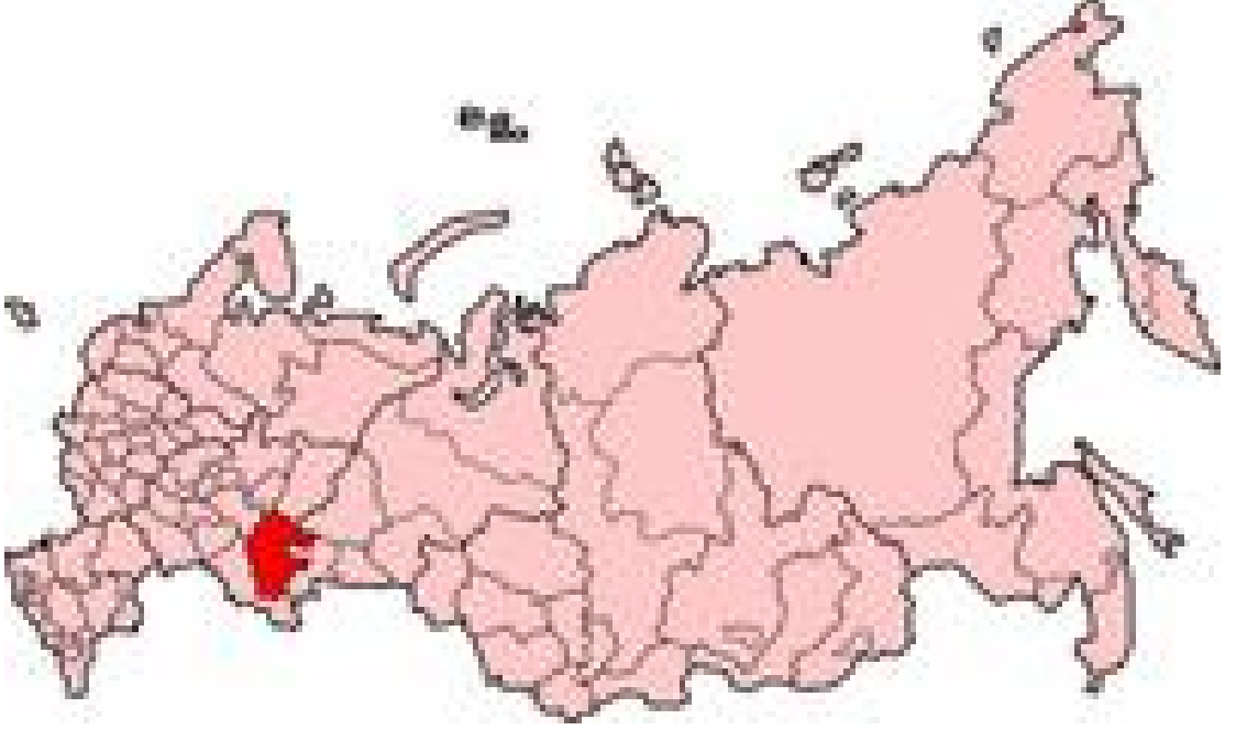
Harita 16: Bařkörtöstan Haritası