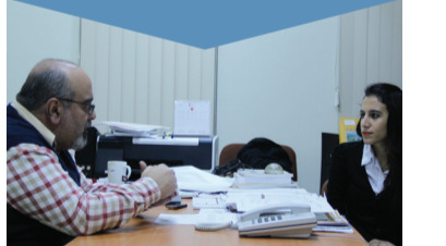
BİZDEN BİRİ S,08