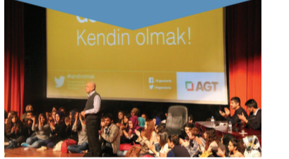
ÖĞRENCİ TOPLULUKLARI S,07

İletişim psikolojisi uzmanı Doğan Cüceloğlu, İnönü Üniversitesi Psikolojik Danışmanlık ve Rehberlik Topluluğu'nun konduğu oldu ve gençlerle "Gelecekte Kendin Olmak" üzerine söyleşi yaptı.