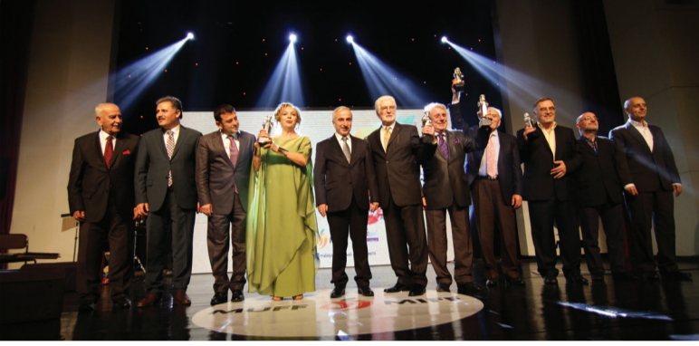
5. MUFF COŞKUSU