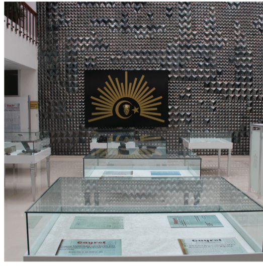
Müzeden genel görünüm