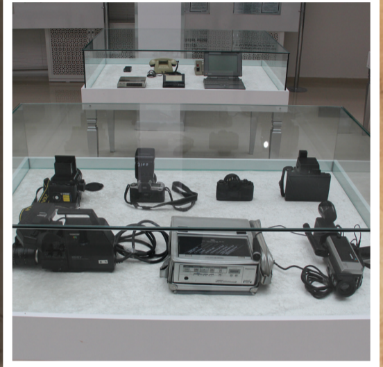
Kamera, Fotoğraf Makineleri (70'li Yıllar)