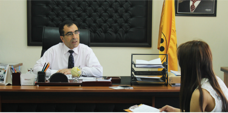
İ.İ.B FAKÜLTESİNİ TANIYORUZ