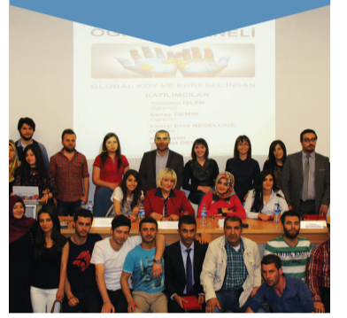
ÖĞRENCİ PANELİ S,3

İletişim Fakültesi Halkla İlişkiler ve Tanıtım Bölümü 3. sınıf öğrencileri "Global Köy ve Küresel İnsan" isimli bir panel düzenledi. Paneye İletişim Fakültesi akademik personeli ile çok sayıda öğrenci katıldı.