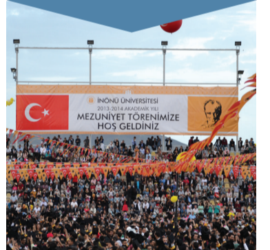
MEZUNİYET ÇOŞKUSU S,6

İnönü Üniversitesi 2013-2014 eğitim-öğretim yılı mezuniyet töreni 6 Haziran Cuma günü İnönü Üniversitesi Stadyumu'nda gerçekleşti. 6 bin öğrencinin mezun olduğu tören öğrencilerin, ailelerin ve öğretim elemanlarının yoğun katılımına sahne oldu.