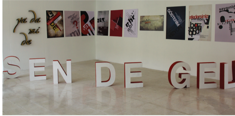
GRAFİK TASARIM SERGİSİ