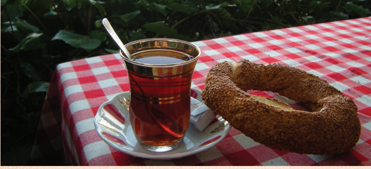
DOSYA HABER "ÇAY"