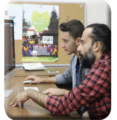
"Tasarım Hayatımızın Merkezinde Var"