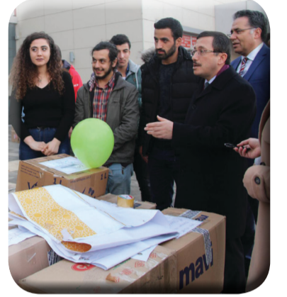
Bu Kış Üşüyen Çocuk Kalmasın!