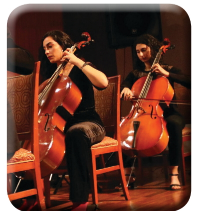
Yaylı Çalgılar Orkestrası 30. Yıl Konseri