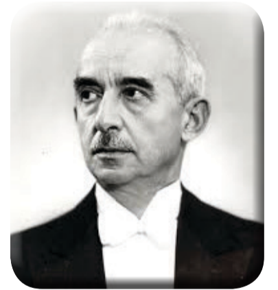
İnönü, Vefatının 45'inci Yıldönümünde Anıldı