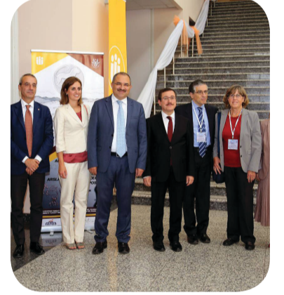
1.Uluslararası Arslantepe Arkeoloji Sempozyumu