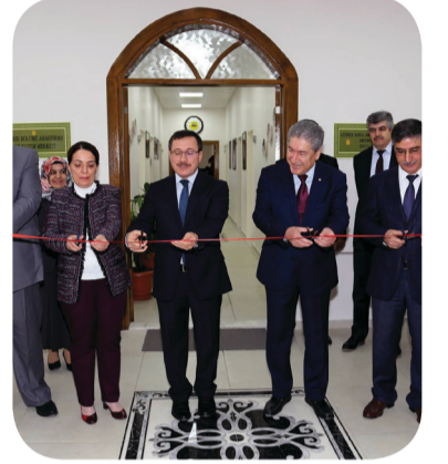
Güney Asya Çalışmaları Uygulama ve Araştırma Merkezi Açıldı