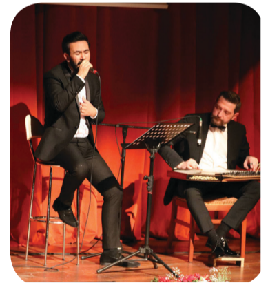
Keman ve Piyano ile Yurt Ezgileri Konseri