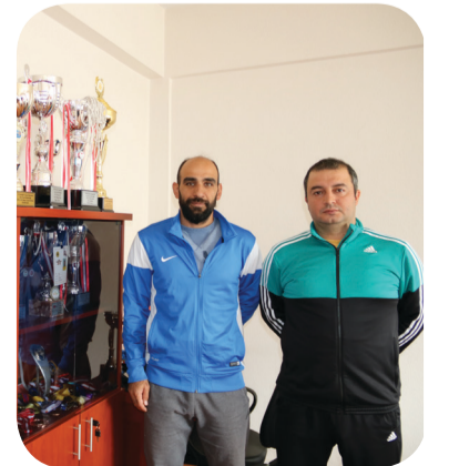
Spor Müsabakalarında İnönü Üniversitesi