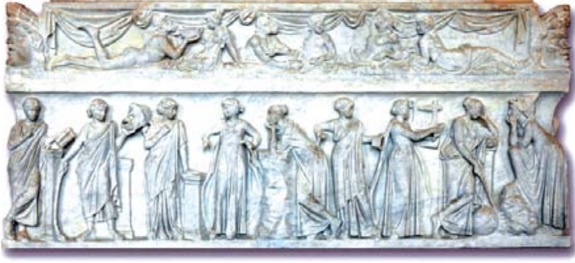
Şekil 2. Müzler: İ.Ö. 2. yy'daki bir mermer lahit, Louvre Müzesi ( http://musesax.com/muses/ 26.11.2016)