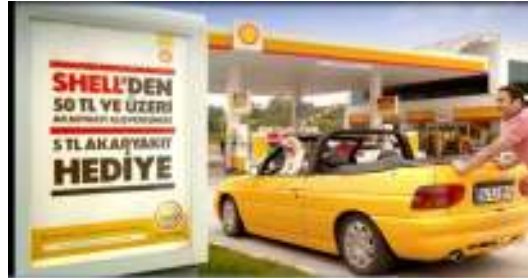
Resim 5: Akbank- Nuri& Şef Reklam Filmi

Tablo 9'a göre reklamlardaki hayvanlar, %41,1 sembol olarak, %31,1'i insani özelliklerin atfedilmesi biçiminde (alegori) ve %14,4'ü de doğada/doğal yaşam ortamında temsil edilmektedir. Ayrıca oranı az da olsa hayvan karakterleri reklamlarda sevilen bir varlık olarak hayvan (%7,8), sıkıntı olarak hayvan (%3,3) ve araç olarak kullanılan hayvan (%2,2) şeklinde görüntülenmektedir.