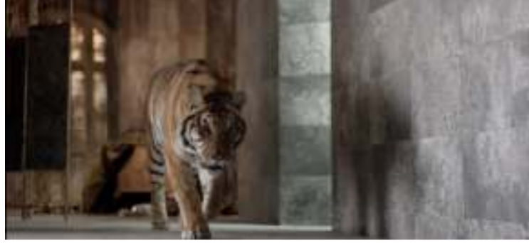
Resim 3: Bien Banyo Seramik Reklam Filmi

Tablo 4, çalışmada incelenen reklamlarda büyük ölçüde vahşi ya da evcilleştirilemeyen hayvan (51,1%) ancak yine yakın oranda evcil hayvan (44,4%) kullanıldığı görülmektedir. Diğer (%4,4) olarak kategoriye alınan hayvanlar ise bakteri, mantar, fungus ya da oyuncak formunda ki hayvanlardır.