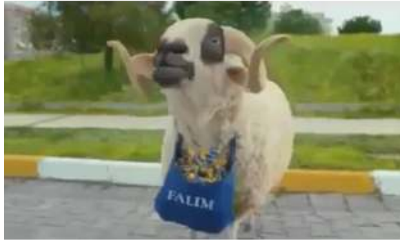
Resim 4: Falım Sakız Reklam Filmi

Reklamlarda kullanılan hayvanların cinsiyetleri Tablo 7'de verilmiştir. Reklamlarda en fazla erkek (62,2%) en az kadın (6,7%) olarak cinsiyetlendirilen hayvan karakter kullanılmıştır. Reklamlarda yer alan hayvanların %31,1'inin ise cinsiyeti açıkça anlaşılmamaktadır.