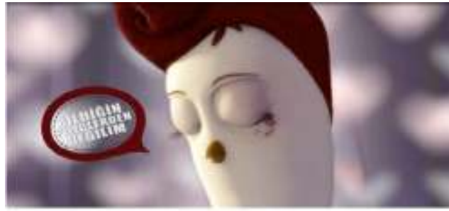
Resim 2: Erpiliç Reklamı

-Hayvanın akıl yoksunu olarak sunumu (disnification): İnsan biçimselleştirme ve neoteni, bir şekilde hayvanların akıl yoksunu şeklinde temsil edilmelerini içerse de bazı temsil biçimlerinde hayvanlar açık bir şekilde akıl yoksunu olarak sunulmaktadır. Baker'a göre (2001) örneğin, bazı reklamlarda hayvanlar kendilerini lezzetli birer "et nesnesi" olarak sunmaktadırlar (akt: Grauerholz, 2007: 340). Türkiye'de yapılan bir reklam filminde (Erpiliç) tavuğun yemek masasında oturup tavuk/yumurta yemesi bunun en güzel örneğidir.