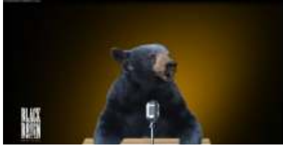
Resim 7: Black Bruin Reklam Filmi