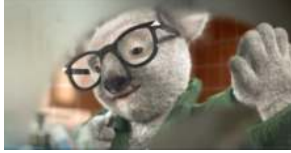
Resim 6: Koalay Reklam Filmi