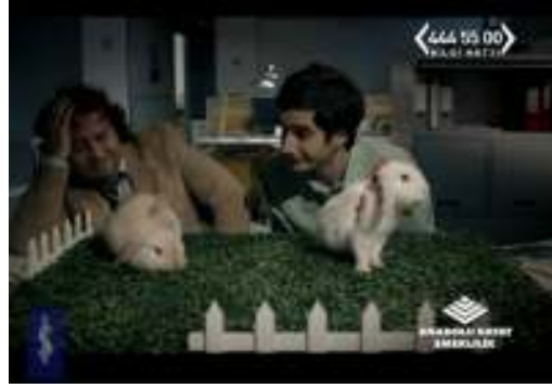
Resim 9: Anadolu Hayat Emeklilik Reklam Filmi

rastlanan anlamlandırma ve ürüne ya da markaya ilişkin çağrışımların fayda (%8,7), zeka ürünü olma (%8,7), arkadaş/dost olma (%7,8), maceraperest (%5,6) ve kazançlı/verimli olma (%5,6) olduğu görülmektedir. Aşağıda incelenen reklamlarda hangi hayvanın hangi anlam çağrışımı için kullanıldığı örneklendirilmiştir: Ayı (14,4%)= dayanıklılık, saflık, Köpek (13,3%)= sadakat, elçi, arkadaş, bekçi, İnek (8,9%)= verimlilik, Tavuk (6,7%)= fayda, Kedi (5,6%) = Büyü, yalnızlık, arzu, kadınsılık, Tavşan (4,4%)= doğallık, verimlilik, Leopar (4,4%) =çeviklik, hız, güç.