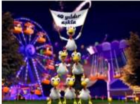
Resim 8: Banvit 40. yıl reklam filmi

İncelenen reklamların %57,8'inde neoteni yapılmadığı görülmüş ancak % 42,2'sinde Neoteni ve unsurlarına rastlanmıştır. Türkiye'de neoteni kullanılan reklamlarda en fazla dikkat çeken husus, hayvanların normalden büyük gözlerle (%20,0) sahip olmalarıdır. Ayrıca reklamlarda yuvarlak yüz ve kafanın (%7,8) yanı sıra yavru hayvanlar (%7,8), küçük beden (%4,4) ve çocuksu konuşmalarla (%2,2) da neoteni yapılmıştır.