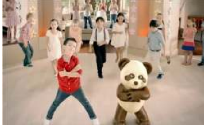
Resim 1: Eti Petito Reklamı- Ayıcık

-Hayvanın akıl yoksunu olarak sunumu (disnification): İnsan biçimselleştirme ve neoteni, bir şekilde hayvanların akıl yoksunu şeklinde temsil edilmelerini içerse de bazı temsil biçimlerinde hayvanlar açık bir şekilde akıl yoksunu olarak sunulmaktadır. Baker'a göre (2001) örneğin, bazı reklamlarda hayvanlar kendilerini lezzetli birer "et nesnesi" olarak sunmaktadırlar (akt: Grauerholz, 2007: 340). Türkiye'de yapılan bir reklam filminde (Erpiliç) tavuğun yemek masasında oturup tavuk/yumurta yemesi bunun en güzel örneğidir.