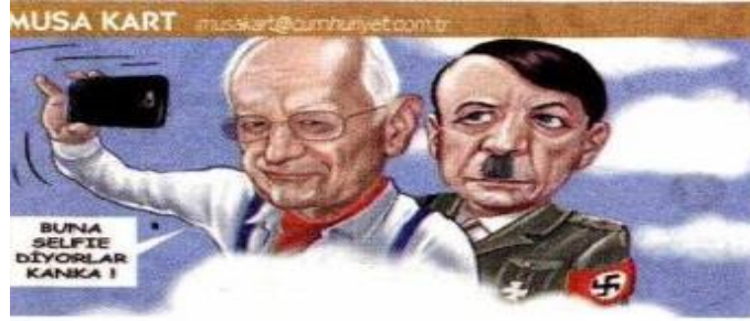
Karikatür 1: Musa Kart, Cumhuriyet, 13 Mayıs 2015, s.01.