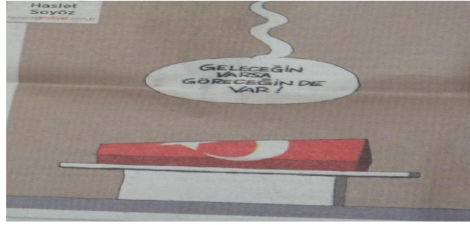
Karikatür 6: Haslet Soyöz, Milliyet, 12 Mayıs 2015, s.14.

Milliyet aynı gün Haslet Soyöz’ün bir karikatürüne de yer vermiştir. Karikatürde Türk bayrağına sarılı Kenan Evren’in tabutu musalla taşında tek başına durmaktadır. Gökten inmiş olan bir baloncukta “Geleceğin varsa göreceğin de var” yazısı yer almaktadır. Bu durum, Soyöz’ün Evren’in karşısında bir tutum sergilediğini gösterirken adaletin öteki dünyada görüleceğini ima etmiştir. Cenaze törenin ertesi günü “Evren’i asker uğurladı” (Milliyet, 13 Mayıs 2015, s.01) başlığını kullanan Milliyet, fotoğrafta da tabutun başında elini açmış dua eden askerler gözükmemektedir. Aynı haberin altında yer alan “Cenazede olay çıktı” başlıklı haberde törende meydana gelen protestolara yer verilmiştir. Gazete iç sayfada ise, “12 Eylül Askeri Darbesinin Lideri Kenan Evren toprağa verildi”(Milliyet, 13 Mayıs 2015, s.20) üst başlığında Evren için ‘lider’ ibaresini kullanmıştır. Haberde “Askerler uğurladı” başlığını seçen gazete, haberin içeriğinde törendeki gelişmelere, protestolara ve törene kimlerin katıldığına geniş bir şekilde yer vermiştir. Aynı sayfada “Cumartesi Anneleri ‘helallik’ vermedi” başlıklı habere yer verilmiştir.