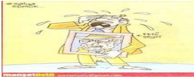
Karikatür 8: Manşetüstü, Yeni Akit, 13 Mayıs 2015, s.01.

Evren’in gömüleceği gün “Anayasası da gömülsün” (Yeni Akit, 12 Mayıs 2015, s.01) başlığını kullanan gazete iç sayfada da aynı başlığa yer verirken “Darbecilerin Anayasası 33 yıldır yürürlükte”(Yeni Akit, 12 Mayıs 2015, s.08) ifadelerinin altı çizilmiştir. Anayasasının değiştirilmesinin gerekliliğinin vurgulandığı haberde yer alan “Evren ile birlikte 1982 Anayasasını da gömelim, darbe anayasası hükümetin elini kolunu bağlıyor, darbe anayasasını değiştirmek görevdir, darbe anayasasını değiştirmek vefa borcu” şeklindeki ara başlıklar dikkat çekmiştir. “Evren bugün toprağa veriliyor” başlıklı başka bir haberde ise, cenaze töreniyle ilgili bilgi verilirken Ak Parti’nin cenaze törenine katılmayacağı özellikle vurgulanmıştır. Evren’in cenaze töreninin ardından “Cuntacılar ibretlik ders” (Yeni Akit, 13 Mayıs 2015, s.01) sürmanşetini atan Yeni Akit, Evren’in sönük bir cenaze merasimiyle gömüldüğünü belirtmiştir. Haberde ‘hakkımızı helal etmiyoruz’ protestosuna da yer veren gazete, “12 Eylül mağdurları Evren’in defnedildiği Devlet Mezarlığı girişine, ‘Diktatör dediğimiz adam bile dünyaya kazık çakamadan gitti. İbret alalım’ pankartı açtı” ifadelerini yansıtırken zalimliğin, dikta yönetimlerin günü geldiğinde hak ettikleri değeri alacakları yönünde bir mesaj verilmiştir. İç sayfada cenaze töreniyle ilgili bilgi veren Yeni Akit, bir başka haberde ise, Kenan Evren’in isminin okullara verilmesine yönelik tepkilerin söz konusu olduğunu kaydetmiştir (Yeni Akit, 13 Mayıs 2015, s.12).