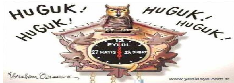
Karikatür 9: İbrahim Özdamak, Yeni Asya, 13 Mayıs 2015, s.01.

Kenan Evren'in gömüldüğü günün ertesi Yeni Asya'da yer bulan yukarıdaki karikatürde bir saatin 28 Şubat, 27 Mayıs ve 12 Eylül'ü gösterdiği görülmektedir. Bu tarihler Türkiye tarihinde yer almış darbe tarihleridir. Akrep ve yelkovanın tam 12 Eylül üzerine gelmiş olması Evren'in ölümüne göndermede bulunulmuş olup 12 Eylül darbesinin sonunun geldiğine işaret etmektedir. Saatin başındaki baykuş ise, kimi çevrelerce 'olumsuz ve uğursuz' bir gösterge olarak görülürken burada kullanılmış olması, 12 Eylül'ün olumsuzluğuna, uğursuzluğuna göndermede bulunulmuştur.