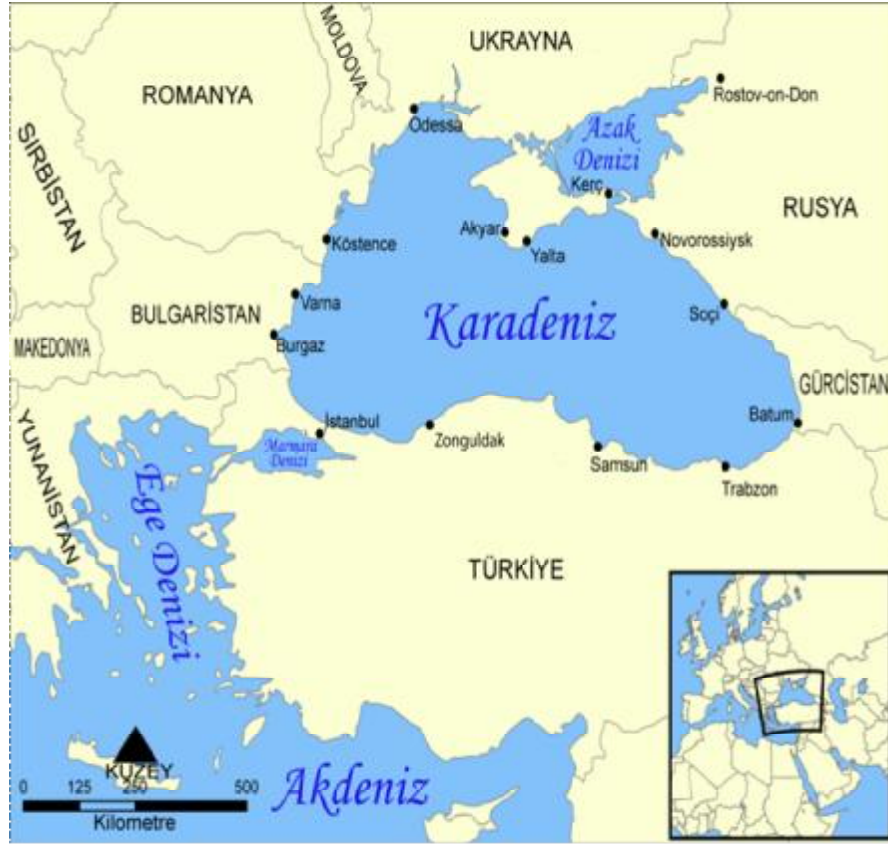
Harita2: Karadeniz Haritası

Avrasya'nın en önemli iç denizi olan Karadeniz, Türkiye'nin kuzeyinde ve Avrupa'nın güneydoğusunda yer almaktadır. Karadeniz'in, Boğazlarla Akdeniz'e, Kerç Boğazı'yla Azak Denizi'ne, Ren-Tuna Kanalı'yla Kuzey Denizi'ne, Main-Tuna Kanalı'yla Baltık Denizi'ne ve Volga-Don Kanalı'yla da Hazar Denizi'ne bağlantısı vardır. Ayrıca, İstanbul Boğazı, Çanakkale Boğazı, Marmara Denizi, Ege Denizi ve Akdeniz dolayısıyla Atlantik Okyanusu'na bağlanmaktadır (Koçer, 2007: 197).