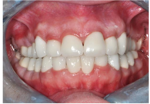
Resim 3. Restorasyonun son hali

Kaybettiği fonksiyonlarını geri kazanan hasta diş hassasiyetlerinden kurtulmanın yanında, estetik olarak da tatmin edici bir görünüme kavuştu. Hastaya fırçalama ve arayüz temizliğini içeren hijyen eğitimi ve 6 aylık kontroller tavsiye edildi.