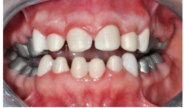
Resim 2. Hastanın anterior dişlerinde zirkonyum destekli, posterior dişlerinde metal destekli yapılan alt yapılar

Hastanın 12 adet anterior dişi zirkonyum destekli, posterior dişleri ise metal destekli seramik kronlarla restore edildi (Resim 2). Daimi kronlar da geçici simantasyon materyaliyle simante edildi. 15 günlük sorunsuz kullanım sonunda tüm kronlar cam iyonomer yapıştırma simanı (Xtra Lute, Medicept Dental, UK) ile daimi olarak simante edildi (Resim 3).