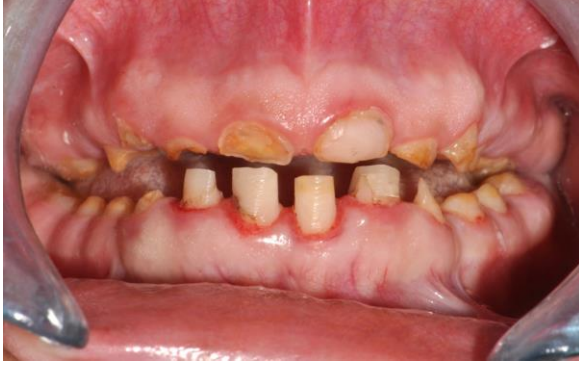
Resim 1a. Hasta ilk geldiğinde ağız içi görüntüsü

belirlendi. Ağız içi muayenede, altanterior5 dişinin kompozitrezinle restore edilmiş, bunların dışındaki tüm dişlerin kronal dokularının büyük oranda kaybedilmiş olduğu, kalan diş yapılarında çürük ve kahverengi lekelerin mevcut olduğu görüldü. Tüm dişler arasında değişik ölçülerde diastemaların bulunduğu izlendi. Ağız açıklığı posterior dişlerin restore edilmesini zorlayacak şekilde kısıtlıydı. Hastanın görünümünden kaynaklı şikâyetlerin yanı sıra yaygın diş hassasiyetleri de mevcuttu (Resim 1a). Ailenin diğer bireylerinde benzer dental problemlerin olmadığı öğrenildi.