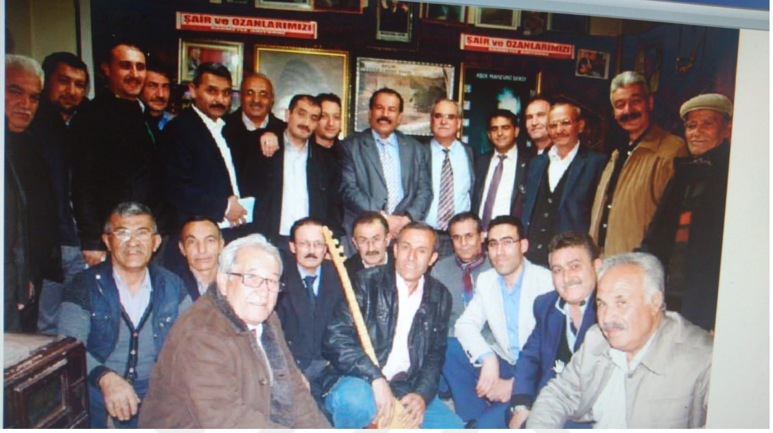
Resim 15: Kahramanmaraş- Afşin Şair ve Âşıkları