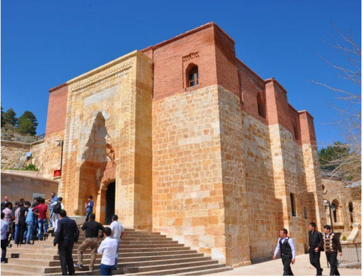
Resim 1: Eshab-ı Kehf