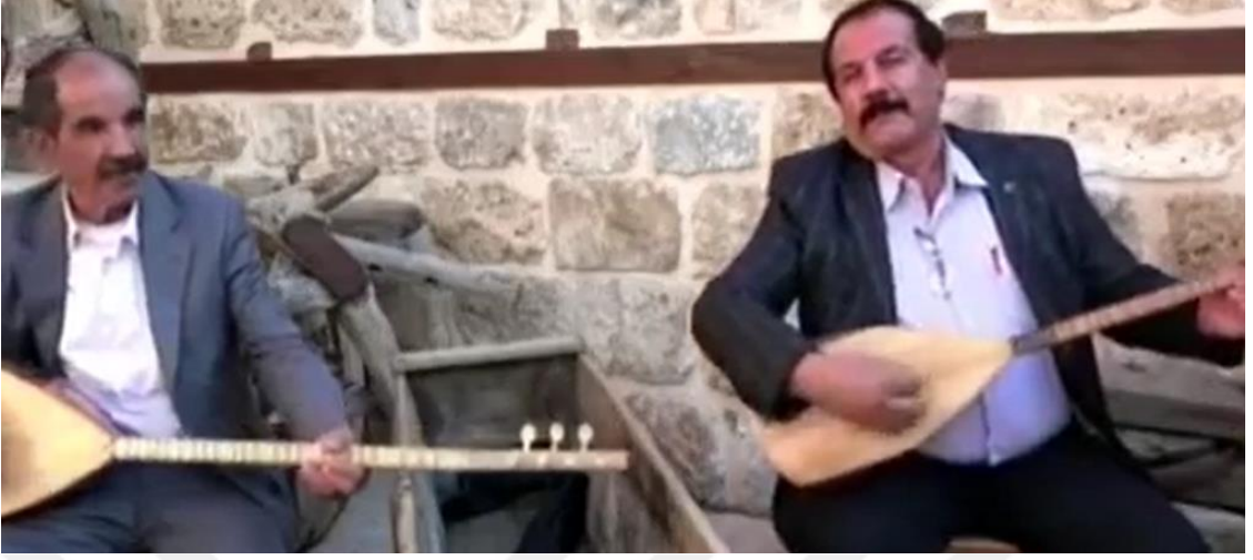
Resim 12: Âşık Erbabî ve Âşık Pınarî Atışmaları