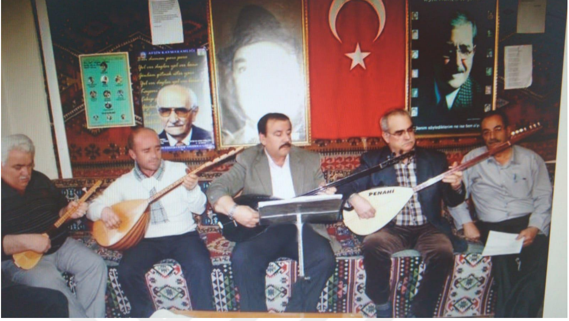
Resim 11: Kahramanmaraş- Afşin, Şairler ve Ozanlar Derneğinden Âşıklarımız