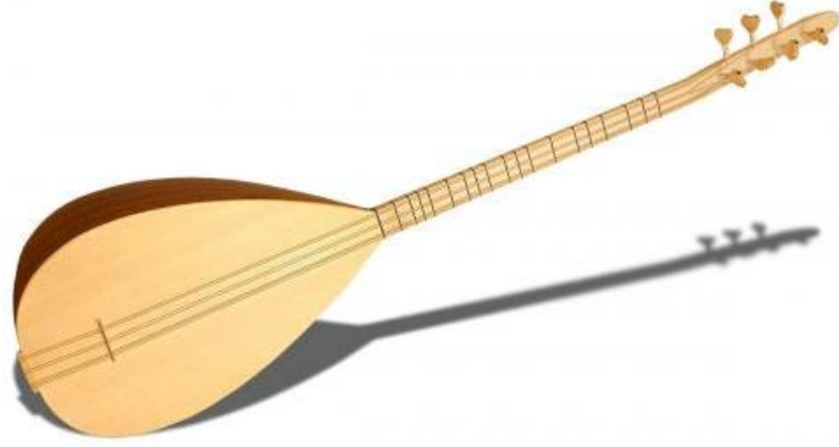
Resim 13: Baęlama algısı