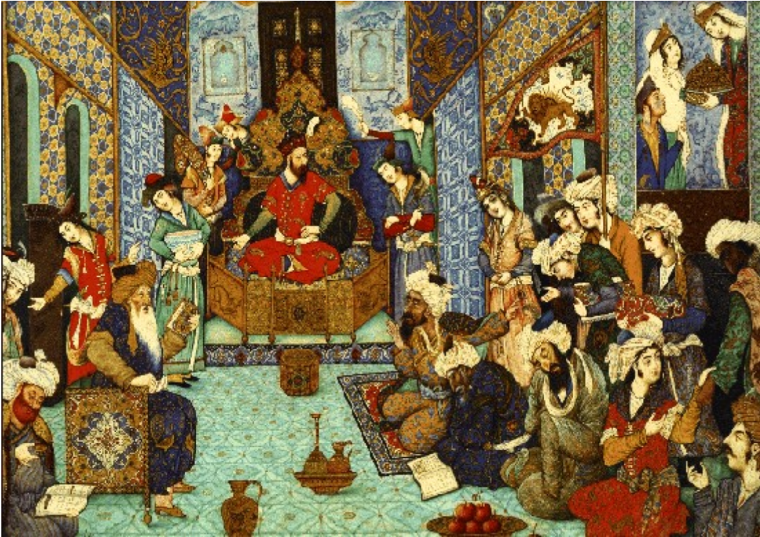
Resim 18. Minyatür Çalışması – II. Selim Dönemi (www.alasayvan.net, 2016).

Minyatür, el yazması kitapları süslemek için sulu boya ile yapılan resimler hakkında kuilonılan bir tâbirdir, İtalyanca minyatura kelimesinden alınmadır. Orta çağ Avrupa’sında el yazması kitapların bölüm başlarındaki ilk harfler minium denilen maden kırmızısı (sülüğen) ile boyanıp süslenirdi. Bilâhare kitoplun süslemek için yapılan resimlere de bu isim verilmiştir (Binark, 1972: 266).