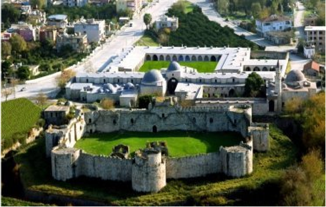
Resim 4. Sokulu Külliyesi – Payas, (www.piyasa Anketi, 2015).

Fonksiyonu ve yapılış amacı bakımından çok medeni ve çok sosyal bir anlayışla meydana getirilen bir mimarlık kompleksi tipi olan Külliyeler, Türklerin, dünya mimarlık sanatına verdiği en başarılı yapılardandır. Külliye, cami esas olmak üzere, çevresinde çeşitli sosyal görevi olan binaların düzenlenmesi suretiyle meydana getirilmiş bir binalar kompleksidir (Akozan,1969:1).