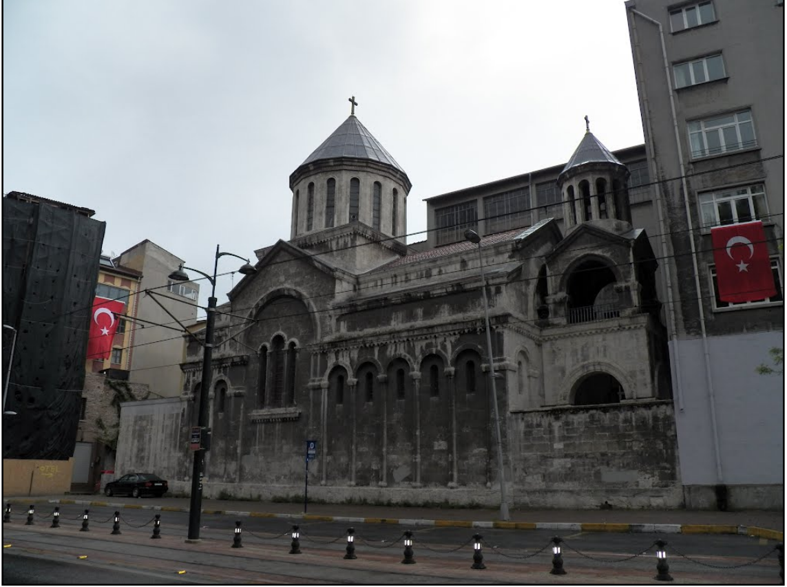
Resim 2. Surp Krikor Lusavoriç Kilisesi – Karaköy, (www.panoramio, 2012).

ibadethanesi olan Surp Krikor Kilisesi kilise mimarisine örnek olarak gösterilebilir (Resim 2).