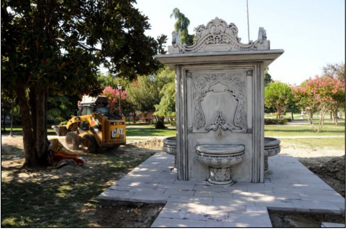
Resim 9. Sultan Parkı Çeşmesi – Manisa, (www.haberciniz.biz, 2013)