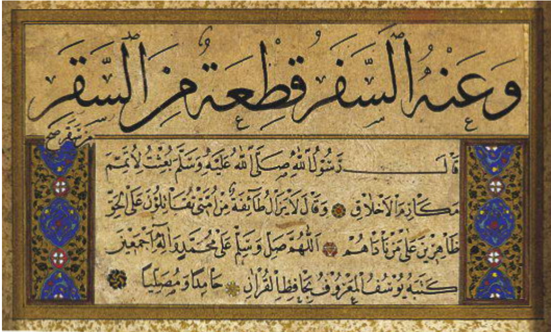
Resim 17. Hat Çalışması – Hafız Osman Efendi, (www.serhatengül, 2016).

7. Cami yazıları; Camilerde bünyesinde hareke işaretleri de bulunan celî sülüs hattı tercih edilmiştir. Mihrabın üzerinde yer alanâyet (el-Bakara 2/144; Âl-i İmrân 3/37 veya 39) çoğunlukla mermere işlenmiştir. XVI. yüzyılda ise çiniye nakşedilenler daha yaygındır. Cami duvarını veya kubbe kasağını çepeçevre saran kuşak yazısıyla kubbeyi ve yarım kubbeleri doldurup süsleyen kubbe yazısı da hep celî sülüsle yazılır. Kubbe yazıları, yazının iğnelenmiş kalıbından nakkaşlar eliyle koyu renge boyanmış sıva üstüne işlenir.