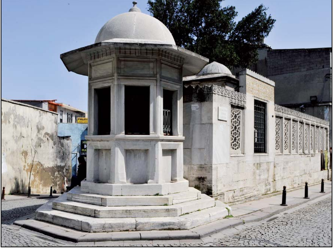
Resim 10. Mimar Sinan Sebili – İstanbul.

arasındaki yollarda bulunan çeşmeler "menzil çeşmeleri" olarak adlandırılır. Bunların, insanların ihtiyacını karşılayan musluklarından başka hayvanların sulanması için ayrı lüleleri ve önlerinde yalıkları vardır. Acık arazideki çeşmelere ise genellikle "çoban çeşmeleri" adı verilir (Eyice, 1993: 277). Çeşme mimarisinin en güzel örneklerinden birisi de Manisa da bulunmaktadır (Resim 9).