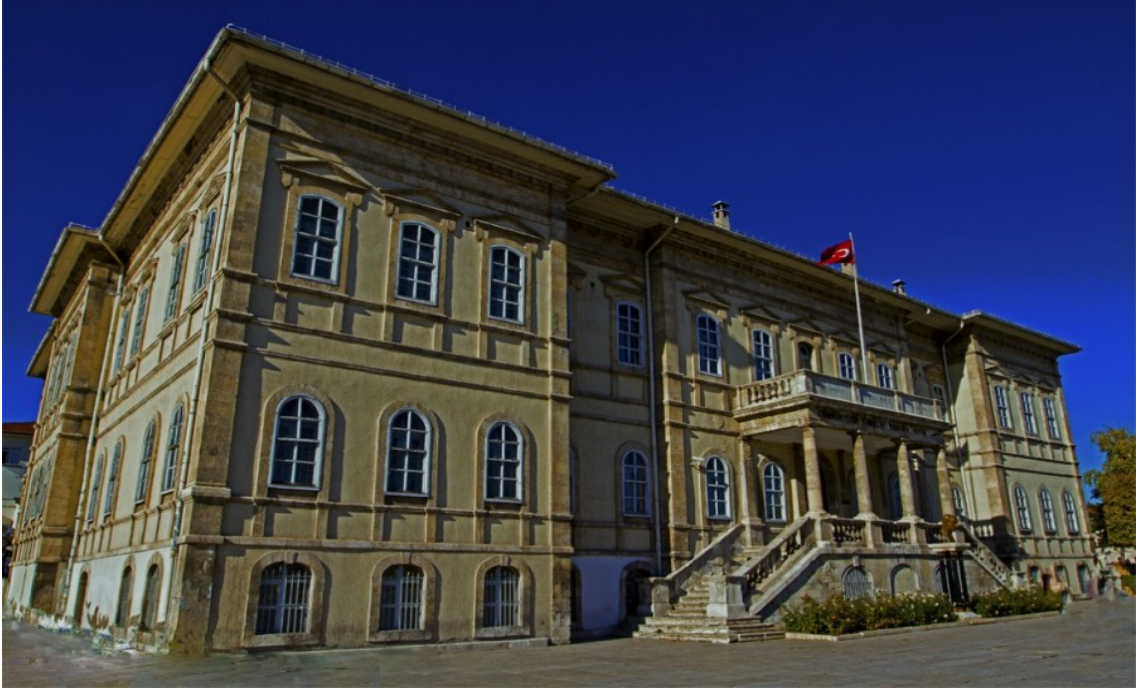
Resim 14. Atatürk Kongre ve Etnografya Müzesi – Sivas, ( www.arkeolojicia.blogspot.com.tr , 2015).