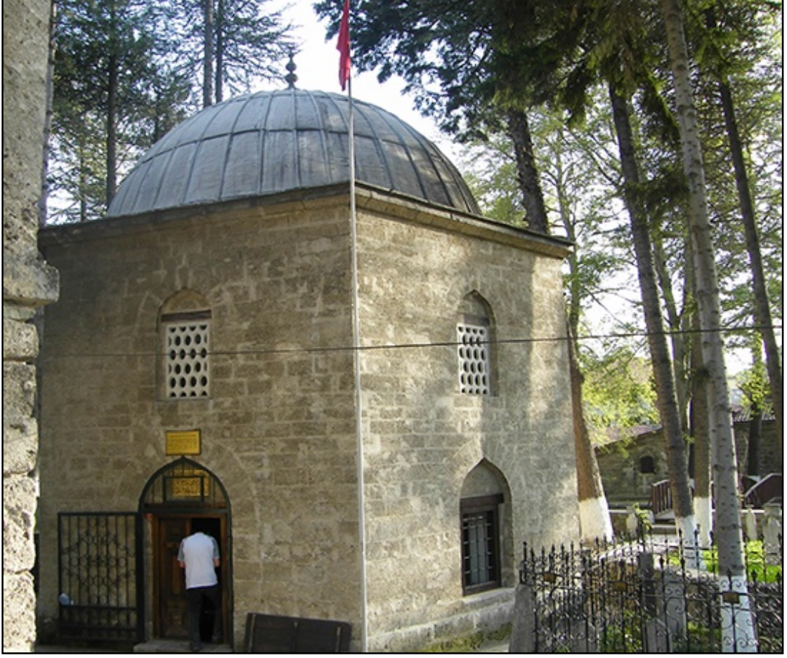
Resim 6. Akşemsettin Türbesi – Bolu, (www.türbe.gen.tr, 2016).

İslâm coğrafyasında tanınmış şahsiyetlerin mezar anıtları türbeden başka “kümbet, makam, meşhed, buk‘a, darîh, kubbe, ravza” gibi adlarla da anılmıştır. Bu adlandırmalar genellikle yapının ait olduğu kişinin makam ve mevkii, mensup olduğu sosyal, dinî ve siyasî zümre, ayrıca yapının mimari özelliğini yansıtmakla birlikte birbirinin yerine de kullanılmıştır. En makbul mezarı “en çabuk kaybolan” diye tanımlayan İslâmiyet’te zengin bir mezar mimarisinin gelişmesi şüphesiz çok şaşırtıcıdır. İlk 250 yıllık süreçte Kubbetü’s-Suleybiyye gibi atipik bir yapının varlığına rağmen mezar mimarisi İslâm’ın öngördüğü şekilde gelişmişti. Abbâsî halifelerinden Müntasır-Billâh için Rum asıllı annesi tarafından Sâmerrâ’da inşa ettirilen, sekizgen planlı bir dehlizle kuşatılmış kubbeli kare bir mekândan oluşan Kubbetü’s-Suleybiyye, sadece Abbâsî mimarlığının değil İslâm mimarlığının da ilk mezar yapısı olarak önem arz etmekle birlikte tipolojik etkisi bulunmayan bir yapı durumundadır (Orman, 2012: 464). 1464 yılında Fatih Sultan Mehmet tarafından hocası Akşemsettin için yapılmış olan türbe Bolu ilinin Göynük ilçesinde bulunmaktadır (Resim 6).