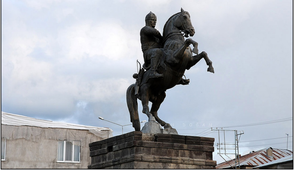
Resim 15. Alparslan Heykeli – Malazgirt, (www.sinandoğan, 2013).

erki tarafından yaptırılan ilk anıtlardır (Kuzu, 2012: 51). Malazgirt ilçesinde bulunan Alparslan heykeli 1071 tarihinin önemini vurgulamak adına önemli bir sanatsal mekân örneğidir (Resim 15).