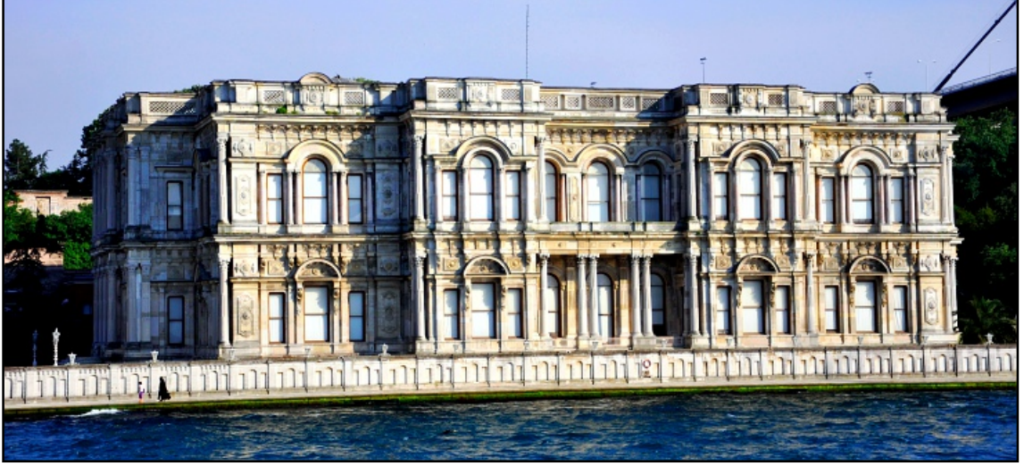
Resim 8. Beylerbeyi Sarayı – İstanbul, (www.howtoistanbul.com, 2016)

veya bu binaların mimari özelliklerini betimlemektedir. Osmanlı'da "saray" sözcüğü tek başına kullanıldığında sadece sultan konutu (miri saray) anlamını taşır ve padişahların konutu olduğu kadar, hükümet edilen yer manasına da gelir. Osmanlı sarayı aslında bir konut-hükümet yapısına sahiptir. Kelimede zenginlerin görkemli konutları ve buna tekabül eden bir yapı tipolojisi anlamı da vardır. Sultanların büyük, sürekli oturdukları sarayları-nın dışında bütün büyük konutlar bu tipoloji içinde değerlendirilebilir (Ferrari, 2009: 205).