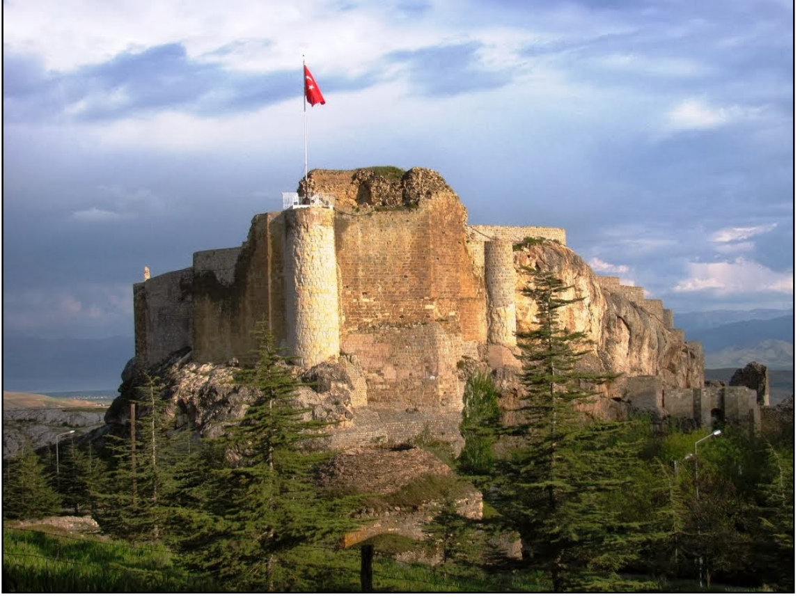
Resim 12. Harput Kalesi – Elazığ, (www.galaksirehberim.com, 2013).

Su kemerleri, iki yüksek arazi arasında alçak seviyedeki vadi, akarsu gibi engellerden suyu aşırarak amacıyla eş yükseltideki iki nokta arasını bağlayan, pâyeler ve kemerler üzerinde yükseltilmiş köprü olup üzerindeki kanallardan akıtılan suyun serbest biçimde akışını sağlamak için çok hassas bir yükseklik ve eğim hesaplaması gerektiren mimarlık ve mühendislik eserlerindedir. Arazinin durumuna göre bazen kilden yapılma künklerle toprağın altından, bazen de kayalık arazilerden kayaların üzerine oyulan kanallar vasıtasıyla taşınan su arazi taşı, kesme taş ve tuğla inşaat malzemesinden ve Horasan harcı kullanılarak inşa edilen kemerli suyollarıyla istenilen yere ulaştırılıyordu. İstanbul’da Geç Roma-Erken Hıristiyanlık dönemlerinde yaptırılan en önemli sukemerleri olan Bozdoğan Kemerleri’nin aslı İmparator Hadrianus devrine ait (117-138) bir suyolunun önemli bir parçası olduğu ve Büyük Konstantinos zamanında onarılarak Trakya’dan getirilen bir su şebekesine bağlandığı kabul edilir. Anadolu’da Roma dönemine ait çok sayıda su kemerleri örneği bulunur (Karakaya, 2009: 444). Su kemerleri, sadece saraya su temin etmek için değil, fakat aynı zamanda tarlalara ve otlaklara su sağlamak için de kullanılmıştır (Özgür, 2007: 9). Bu alandaki ünlü eserlerden biri de Safranbolu’da bulunan İncekaya Su Kemeridir (Resim 13).