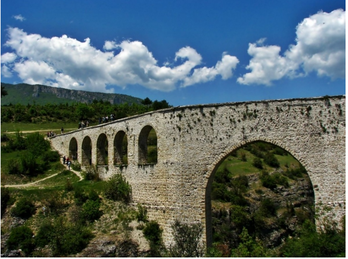
Resim 13. İncekaya Su Kemerı – Safranbulu, (www.fotograftürk.com, 2016).