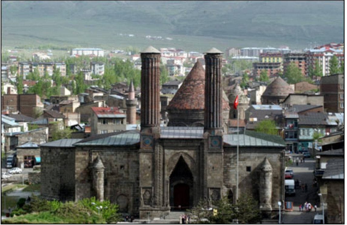
Resim 5. Çifte Minareli Medrese – Erzurum, (www.3Dkonut, 2016)

Bağdat'taki Nizamiye Medresesi ilk kurulan medreselerdendir. Bu medrese yönetim şekli ve eğitim alanında olduğu kadar mimari olarak da diğer medreselere örnek olmuştur. Medreseler Nizamiye medresesinde olduğu gibi taştan yapılmış binalardır ve genellikle iki katlıdır. Kubbeli veya eyvanlı olarak yapılanları bulunmaktadır. Giriş kapıları genellikle iki minare arasında yapılmaktadır. Birinci katta genel olarak eğitim vermek için kullanılan bir oda, bu odanın karşısında medresenin kurucusunun mezarı ve geniş bir salon bulunmaktadır. İkinci katta ise kütüphane ve öğrencilerin kullanımı için odalar bulunmaktadır (Erden, 2015: 23).