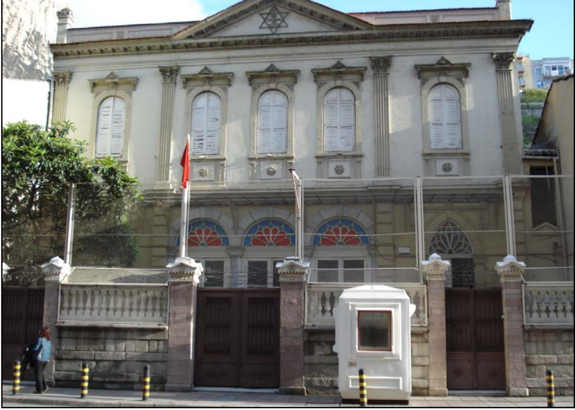
Resim 3. Bet İsrail Sinagogu – İzmir, (www.panoramio, 2011).

etmek yasaktır. Sinagog yerleşim yerinin en yüksek noktasına inşa edilmeli, ondan yüksek başka bina olmamalıdır (Adam, 2009: 222).