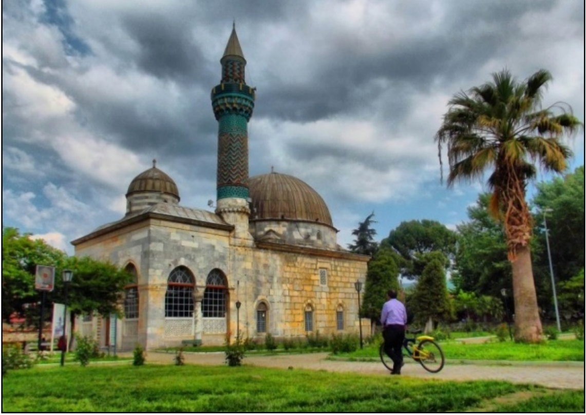
Resim 1. Yeşil Cami – Bursa.

ve bunları uygulatan ve bunları uygulayan inanan topluluğu ifade eden kilise, ‘‘davet, toplama, çağrı’’ gibi anlamlara gelmektedir. Modern Batı dillerinde kilise karşılığında eglise (Fr), church (İng) kelimeleri kullanılmaktadır. Arapça anlamı ise kenisedir (Aydın,2002: 11).