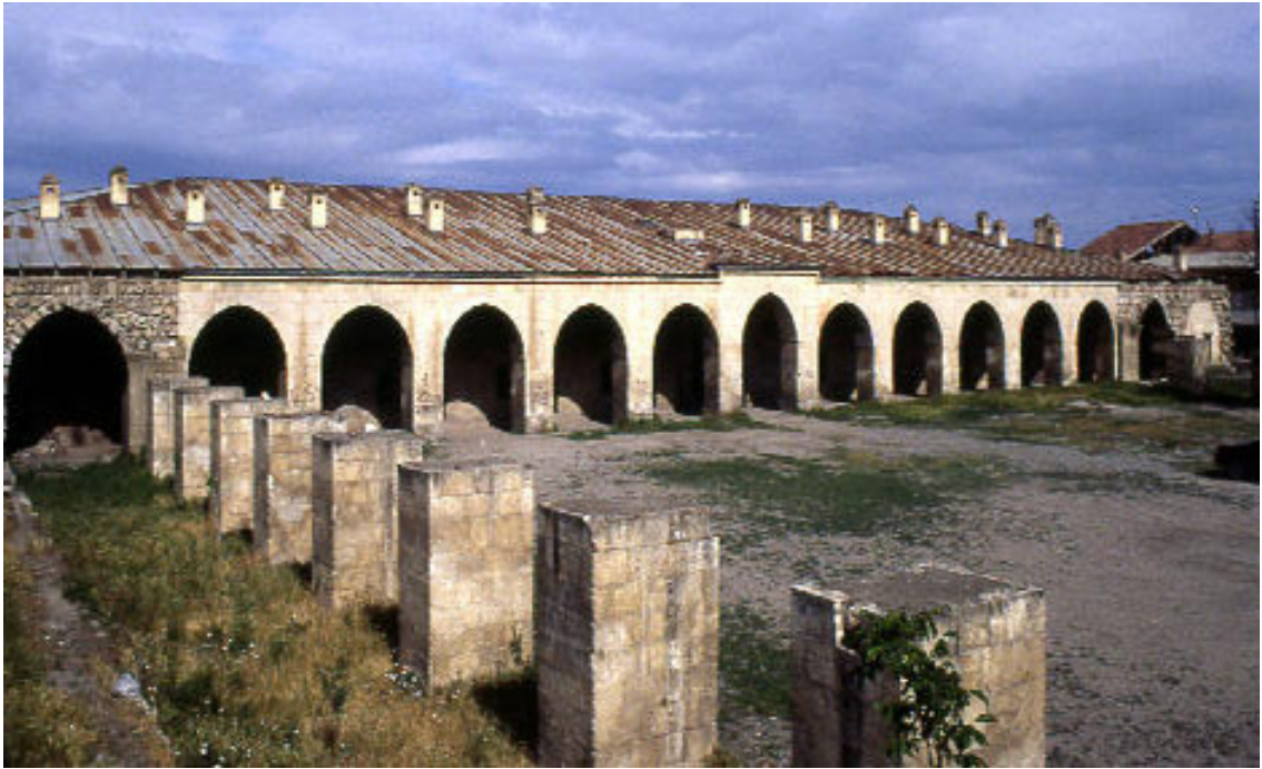
Resim 7. Kervansaray – Malatya, (www.malatyam.com, 2016).

Türk Mimarisinde önemli bir yeri olduğu bilinen kervansaraylar, başlangıcından itibaren belirli özellikleriyle, plan şemalarında açık bir gelişme izlenebilen yapılar olmaktadır. Osmanlı döneminde, 15. yüzyılda, külliye yapılarının vazgeçilmez birer yapısı olarak inşa edilmişler, ancak 16. yüzyılda bir plan tipolojisi olarak özelliklerini ortaya koymuş oldukları, yapılan araştırmalar sonucu açıklık kazanmıştır. Osmanlı döneminde, özellikle menzillerde, geçitlerde 15. yüzyıldan itibaren, 16. yüzyıl boyunca inşa edilen artık günümüzde birer yerleşme merkezi haline gelmiş olan, menzil külliyelerinin sosyal yapıları arasında vazgeçilmez parçaları bu kervansaraylardır. En basit anlamda kervansaray, kervanlara hizmet eden bir yol üstü kuruluşudur (Çantay, 1988: 369).