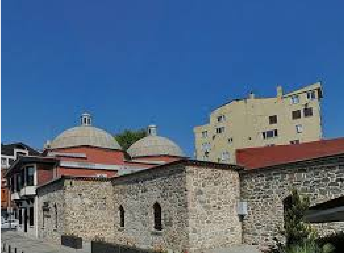
Resim 11. Hüsrev Kethüda Hamamı – İstanbul.

Sözlükte "kökünden koparmak, kazımak" anlamındaki kal' kökünden türeyen kalaa "tırmanılması zor, çıkılamayan bir dağdan kopan büyük kaya parçası veya dağ gibi büyük bulut" manasına gelmekte, dağ başlarına inşa edilen muhkem yapı anlamındaki kal'a (kale) kelimesinin de bundan geldiği kaydedilmektedir. Kale aslında askerî mimari çerçevesinde ele alınır. Ancak Türkçede bugün tahkim edilmiş her türlü yapıya kale denilmekte ve bu durum birtakım karışıklıklara yol açmaktadır. Kaleyı benzeri olan hisar, sur ve onlara nazaran çok yeni bir terim olan tabyadan ayırt etmek gerekir. Bunlardan hisar, bir mesken olması düşünülerek tahkim edilmiş tek bir kitle halindeki yapı olup Batı dillerinden dilimize geçen şato kelimesiyle ifade edilir. Bir şehir veya bir kasabayı, hatta bazen bütün bir eyaleti korumak üzere bu yerin etrafını çeviren kuleli tahkimat duvarlarına sur denir (Yücel, 2011: 242). Milattan önce 20. Yüzyıl yapıtlarından olan Harput Kalesi bugünkü Elazığ ilinde bulunmaktadır (Resim 12).