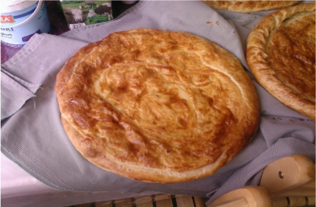
Şekil 16. Kalakay 48