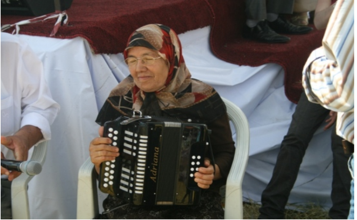
Şekil 10. Bir Nogay ayyesi (yaşlı kadın) Sabantoy'da 46 akordiyon çalarken...