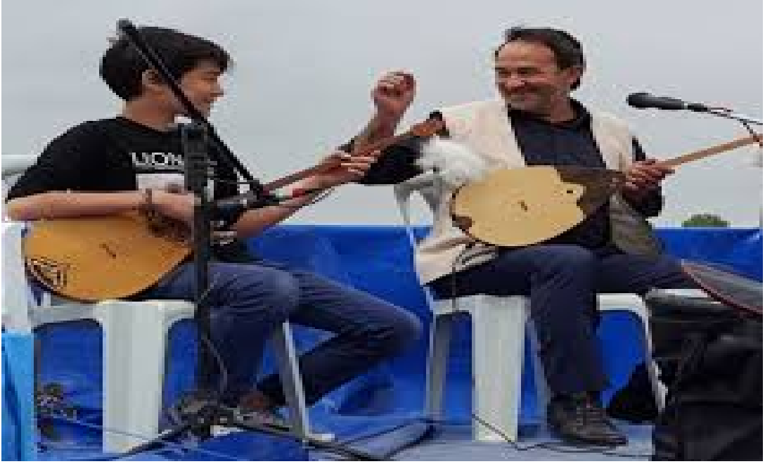
Şekil 11. Nogaylar dombra çalarken...