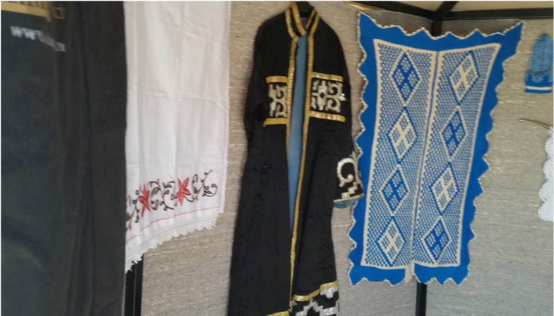
Şekil 8. Eskiden Nogay erkeklerinin giydiđi bir köynek. 45