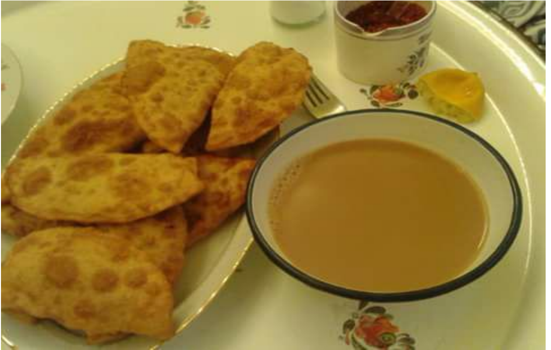
Şekil 14. Şır börek ve ayak şay(çay).