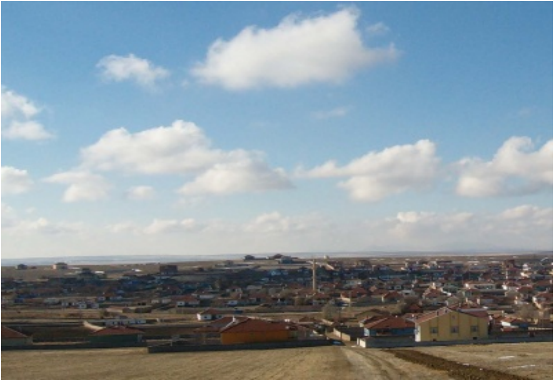
Şekil 6. Konya / Kulu / Kırkkuyu Köyü