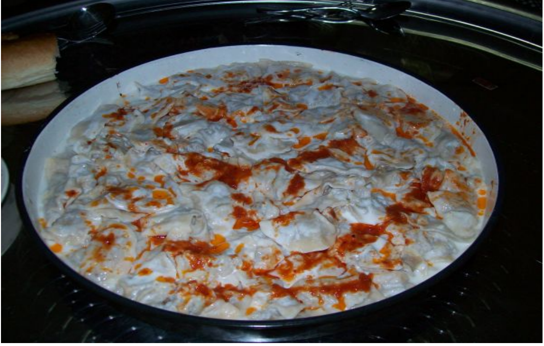
Şekil 15. Kazan börek.