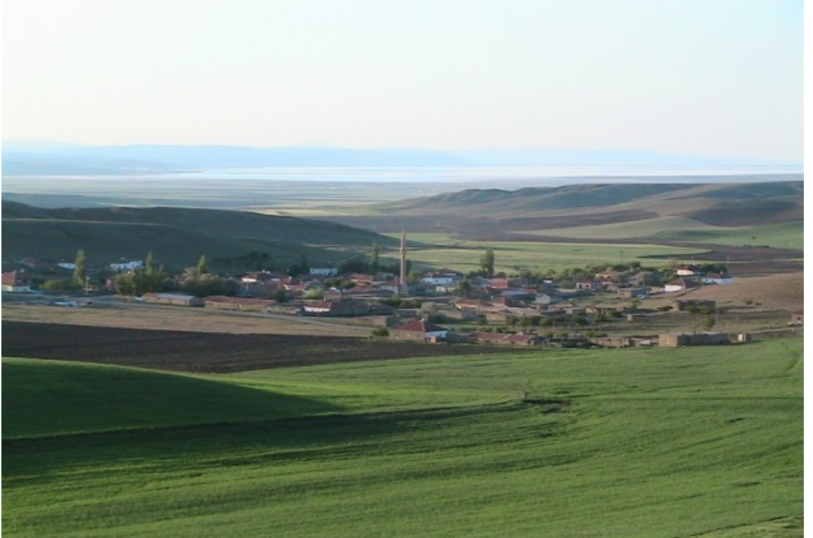
Şekil 4. Ankara / Şereflikoçhisar / Doğankaya Köyü