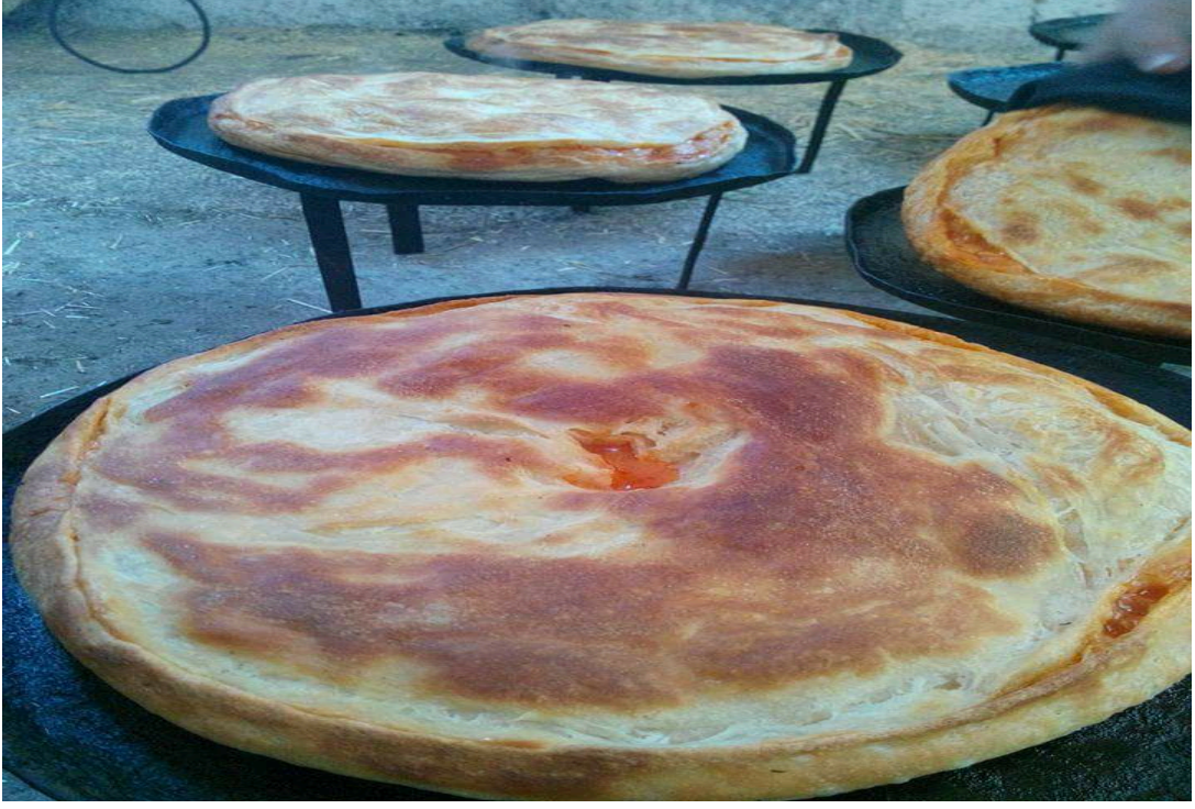
Şekil 17. Tabak(tava) börek.