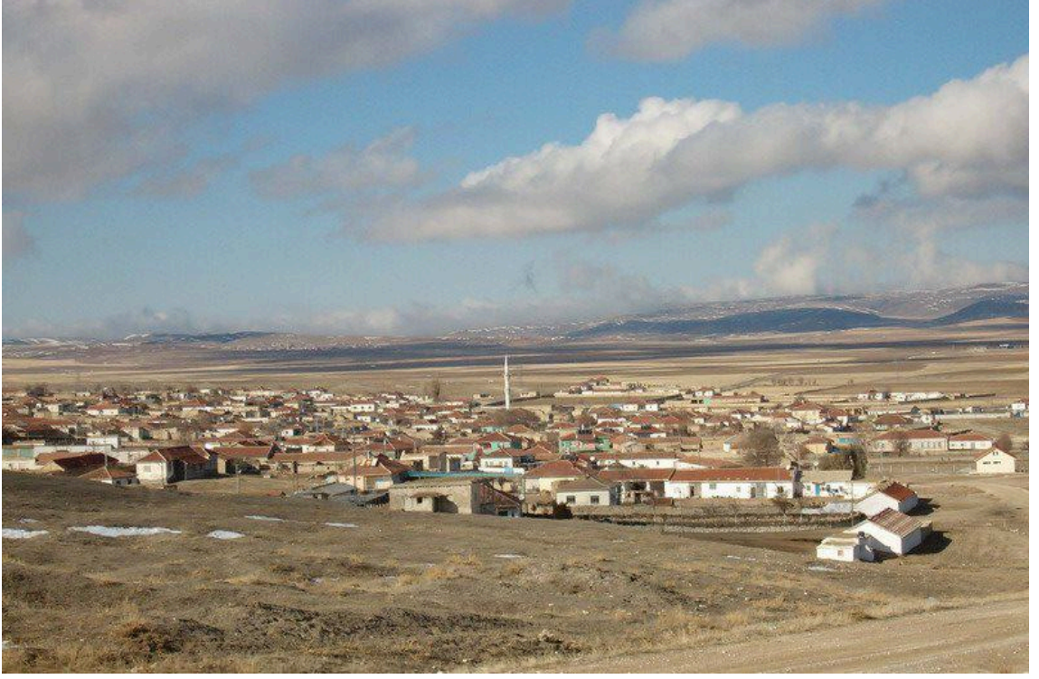
Şekil 3. Ankara / Şereflikoçhisar / Akin Köyü