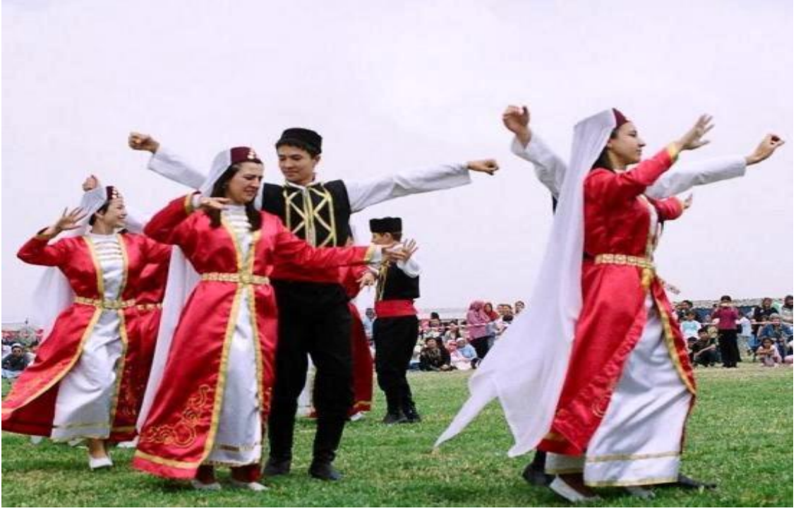
Şekil 13. Nogaylar sabantoyda Kafkas dansı yaparken...