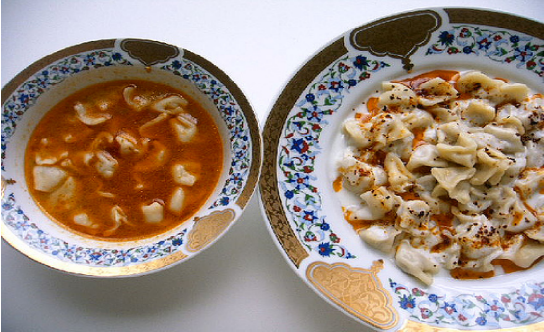
Şekil 18. Kasiq (kaşık) börek. 49