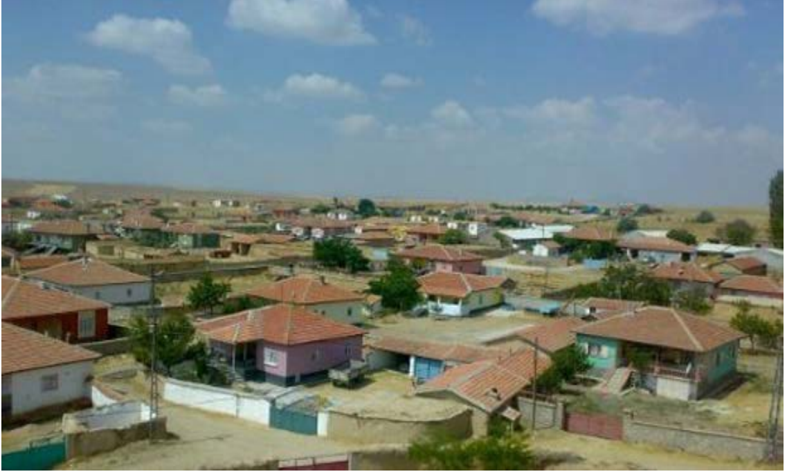
Şekil 5. Ankara / Şereflikoçhisar / Şeker Köyü