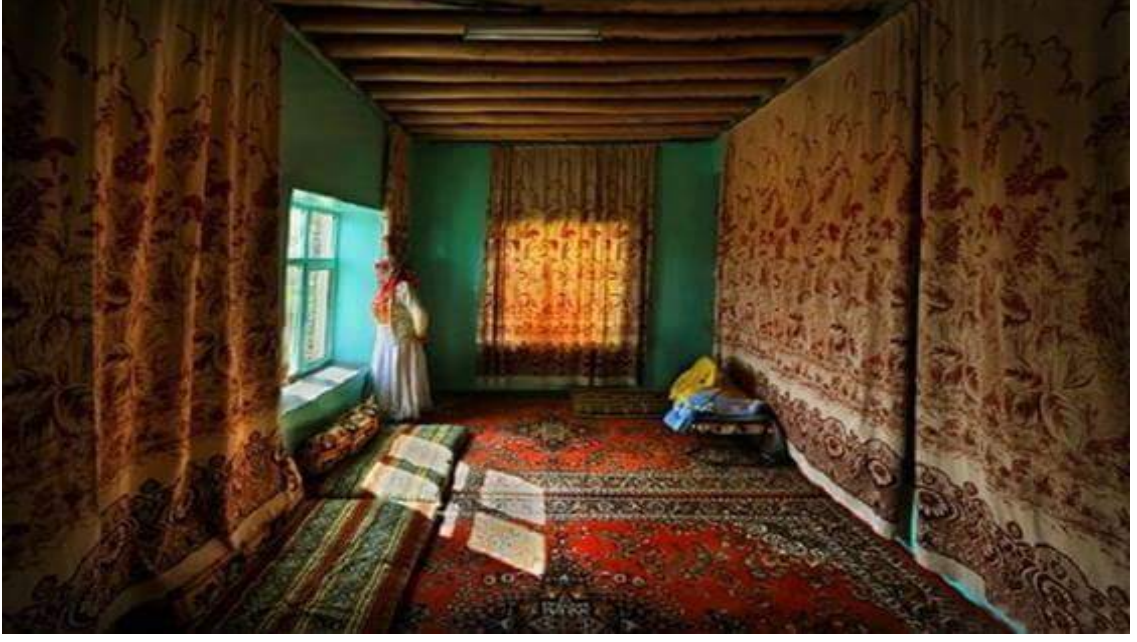
Şekil 9. Nogay Türklerinin evlerinden bir odanın görünümü.