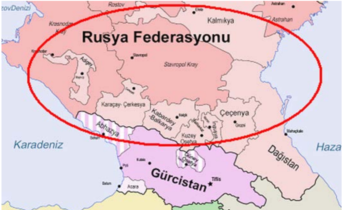
Şekil 2. Kafkasya'da dağınık şekilde bulunan Nogayların yaşadıkları yerleri gösteren harita.