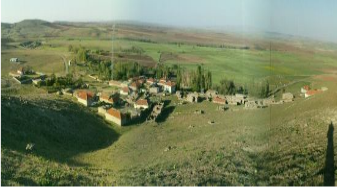
Şekil 7. Konya / Kulu / Seyitahmetli Köyü