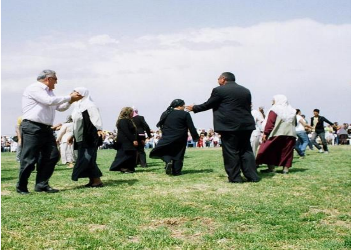
Şekil 12. Nogaylar kanekiy 47 oynarken...