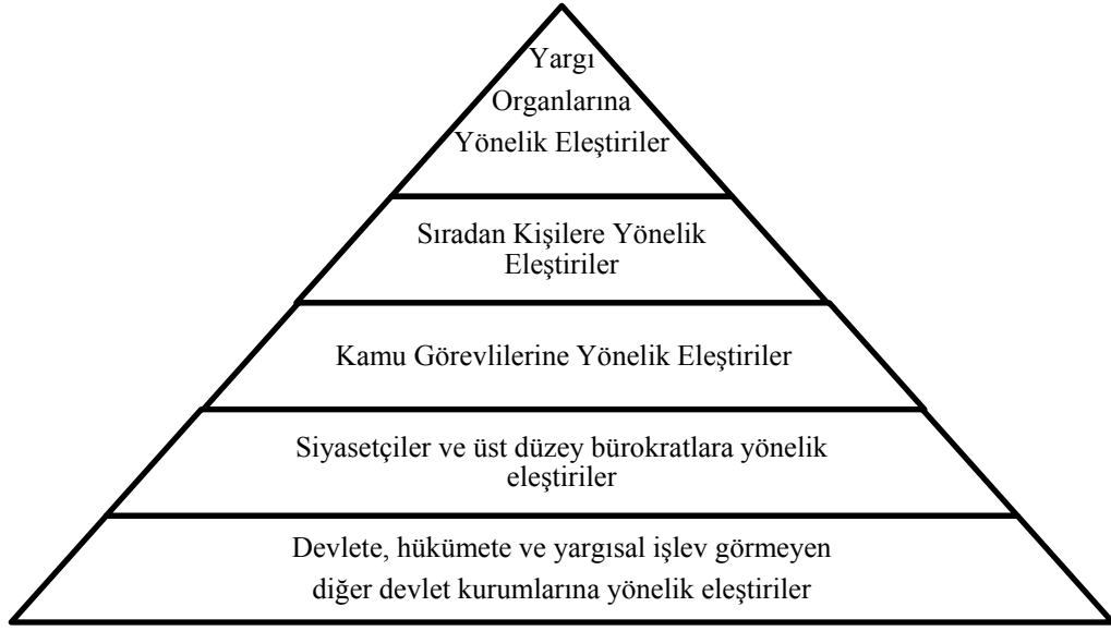
Şekil 1.4 Sanatsal İfade Özgürlüğünün Sağladığı Koruma Alanını Gösterir Piramit

Piramide göre yargı organlarına yönelik eleştiriler sanatsal ifade özgürlüğü vasıtasıyla en az seviyede korunurken, devlete, hükümete ve yargısal işlev görmeyen diğer devlet kurumlarına yönelik eleştiriler en üst seviyede sanatsal ifade özgürlüğünün korumasından yararlanmaktadır 203 .