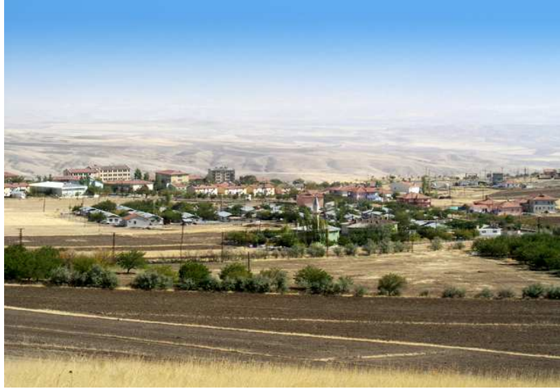
Resim-1 Arguvan'dan Bir Görünüş

Osmanlı Devleti zamanında Tahir Bucağı adı ile Arapgir'e bağılı olan Arguvan, sonradan ilçe olarak Diyarbakır'a bağılınmış 1873 yılında Tahir adı ile Keban'a bağılı bir nahiye haline getirilmiştir. Cumhuriyetin ilanı ile merkez ilçesi olarak Malatya'ya bağılınmış, 1954 yılında Tahir nahiyesi merkez olmak üzere Arguvan adıyla Malatya iline bağılı bir ilçe haline getirilmiştir. Arguvan ilçesinde Türkiye'nin en kapsamlı türkü festivali 2003 yılından itibaren yapılmaktadır. http://www.arguvan.gov.tr