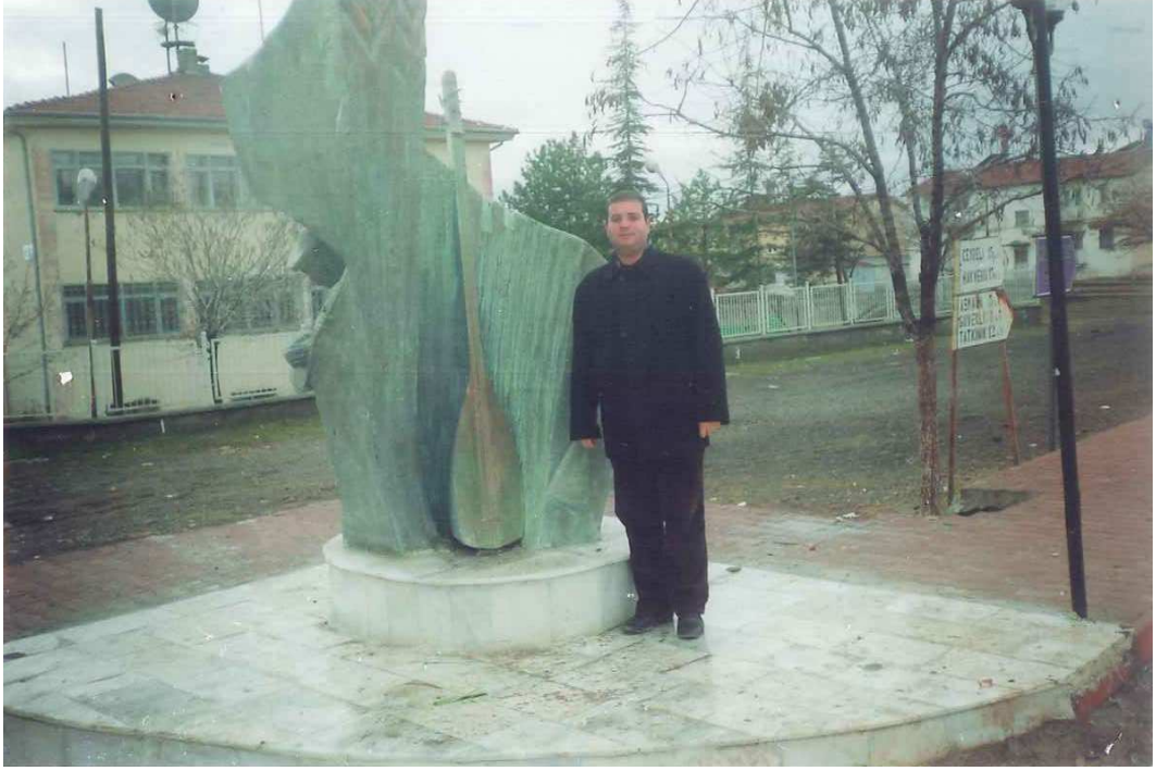
Resim-2 Arguvan Merkez’de Bulunan Âşıklar Anıtı

Arguvan’ın tarih boyunca birçok kültürü içinde barındırdığı, en önemli özelliğinin Alevi- Bektaşî inancının çok yoğun olarak yaşandığı bunun sonucunda Arguvan Müzik Kültürü’nü Alevi – Bektaşî Müzik kültürü oluşturmaktadır sonucuna varılmıştır.