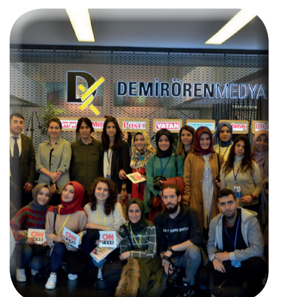
İletişim Fakültesinden İstanbul'a Teknik Gezi