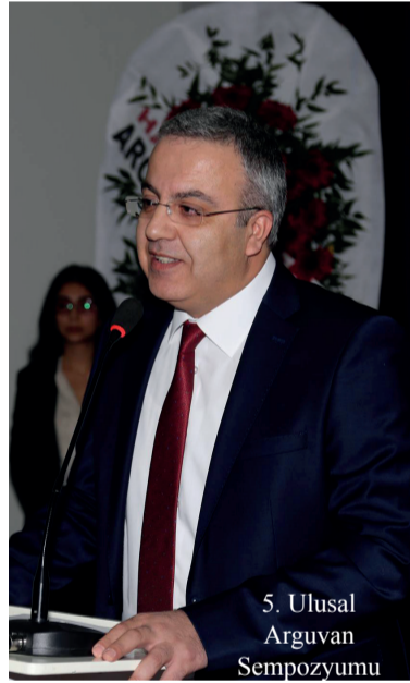
5. Ulusal Arguvan Sempozyumu

İnönü Üniversitesi ve Ankara Arguvanlular Kültür ve Dayanışma Derneği tarafından ortaklaşa düzenlenen 5. Ulusal Arguvan Sempozyumu, Kültür ve Turizm Bakanlığının katkılarıyla Güzel Sanatlar ve Tasarım Fakültesi Konser Salonu'nda gerçekleştirildi. Prof. Dr. Fuat Sezgin'in hatırasına İnönü Üniversitesi İlahiyat Fakültesi tarafından bu yıl üçüncüsü düzenlenen Uluslararası İslâm ve Yorum Sempozyumu İnönü Üniversitesi Turgut Özal Tıp Kongre ve Kültür Merkezinde gerçekleştirildi. İnönü Üniversitesi ve İlmî Etütler Derneği'nin işbirliğiyle düzenlenen "8. Türkiye Lisansüstü Çalışmalar Kongresi" İnönü Üniversitesinin ev sahipliğinde Malatya'da yapıldı. Farklı üniversitelerden gelen