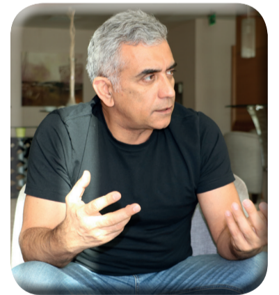
Azerbaycanlı Yönetmenin Gözünde Türk Sineması