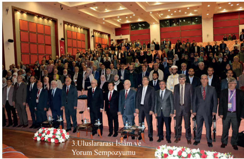
3. Uluslararası İslâm ve Yorum Sempozyumu