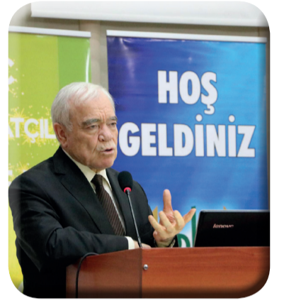
Kur'an-ı Kerim Ziyafeti ve Güzel Okuma Yarışması