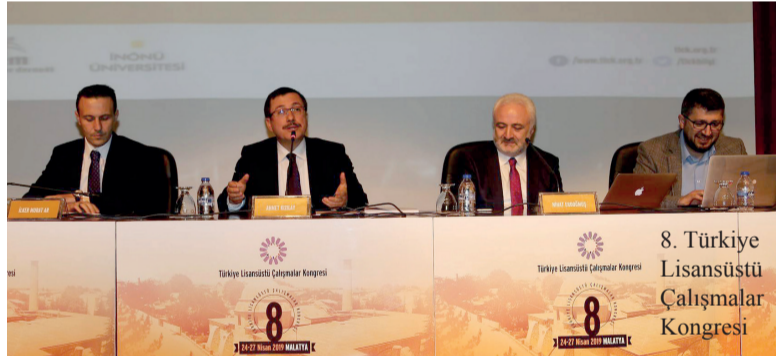
8. Türkiye Lisansüstü Çalışmalar Kongresi