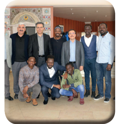
Rektör Kızılay Afrikalı Öğrencilerle Kahvaltıda Buluştu