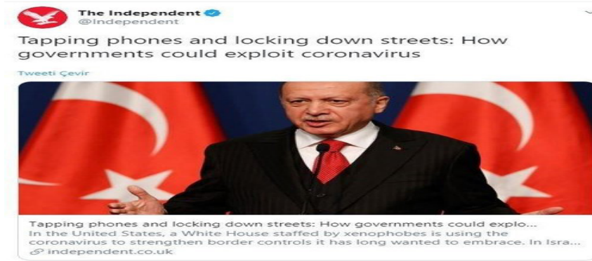
Şekil 8: The Independent Haberi

ibadethaneye yani camiye ait olması batı dünyasında Müslüman coğrafyaya ve değerlere yönelik oluşturulmak istenen bir algı şeklinde okunabilir.