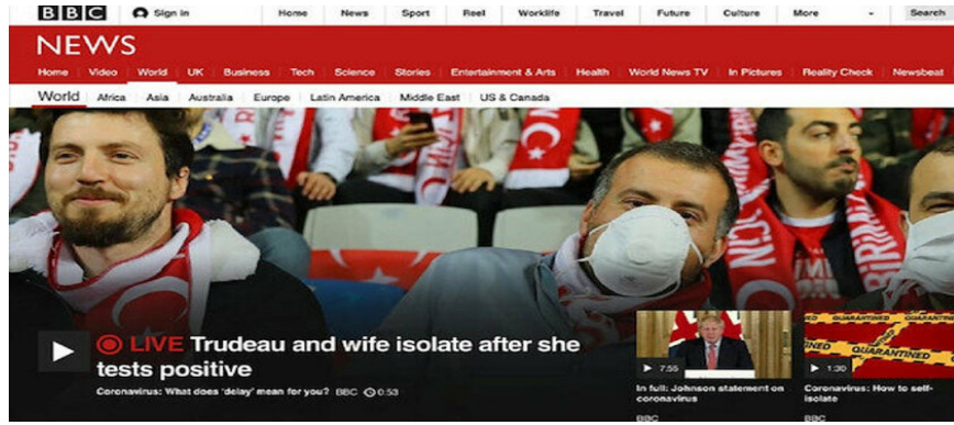
Şekil 1: BBC News Haberi