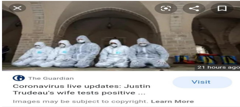
Şekil 9: The Guardian Haberi

Yukarıda çözümlenmesi yapılmış olan haberde Covid19 virüsüne yönelik olarak hükümetlerin aldıkları tedbirlere yer verilmiştir. Türkiye'ye yönelik bölümde sadece lüks alışveriş merkezlerini açık tutarken alkol kullanılan mekânların kapatıldığı ifade edilmiştir. Lakin Türkiye Cumhuriyeti Cumhurbaşkanı Recep Tayyip Erdoğan'ın 30 Ocak 2020 tarihinde virüse karşı alınan ve alınacak olan önlemleri açıklamış olduğu ve virüsün Türkiye'de ilk olarak 11 Mart 2020 tarihinde görülmüş olduğu gerçeği göz ardı edilerek Türkiye hükümetinin başarısı gölgelenmek istendiği gibi Türkiye'de virüsün önemsenmediği algısı inşa edilmeye çalışılmıştır. Aynı zamanda Recep Tayyip Erdoğan hükümetini muhafazakâr İslamcı kökenli bir hükümet şeklinde tanımlayıp alkollü mekânların kapatıldığı dönemde camilerde toplu halde ibadet edilmesinin de bir süre askıya alındığı gerçeği göz ardı edilerek kendi halkı içerisinde bir taraf olduğu ve ötekileştirme yaptığı algısı inşa edilmeye çalışılmıştır.