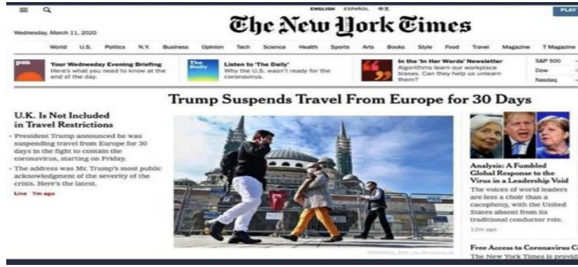
Şekil 3: The New York Times Haberi