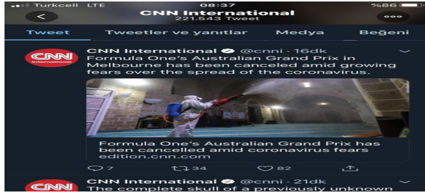
Şekil 5: CNN International Haberi