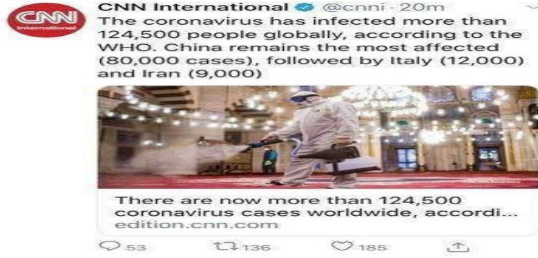
Şekil 4: CNN International Haberi