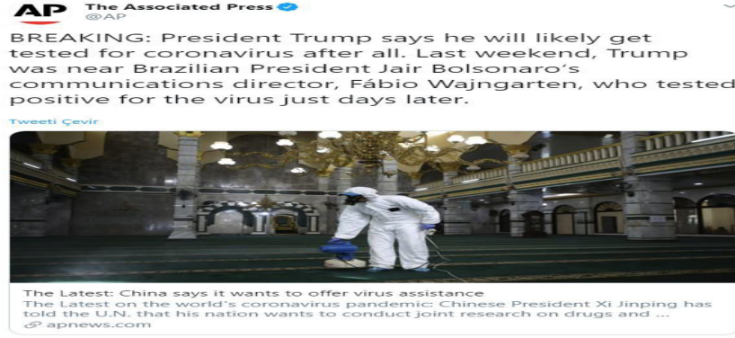
Şekil 7: The Associated Press Haberi