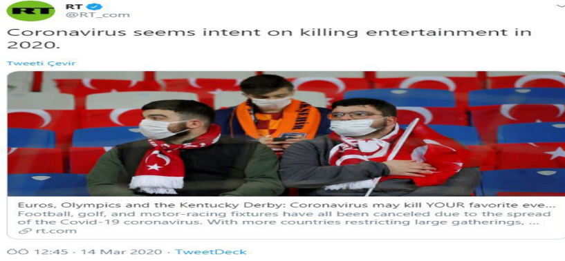
Şekil 6: Russia Today Haberi