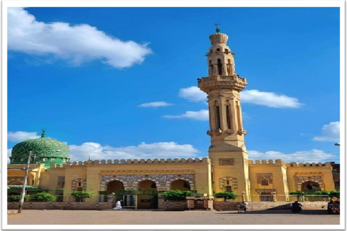
Ek 4: Ka 'kâ' b. Amr Camisinden Bir Görünüm 483