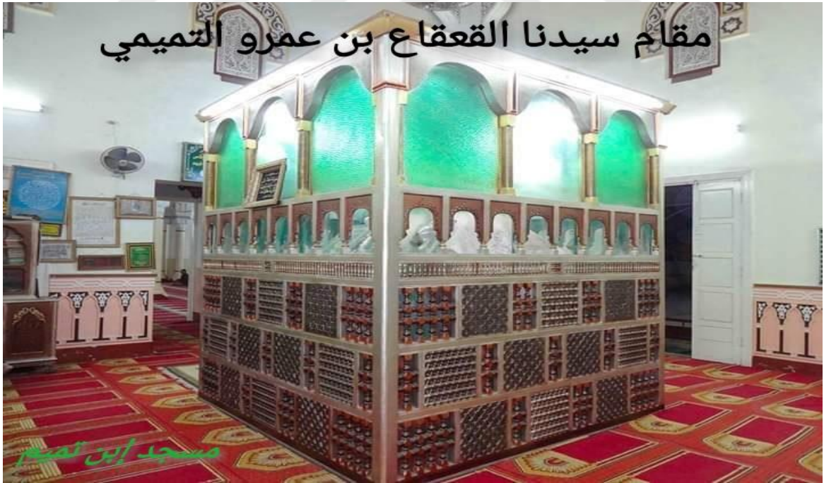
Ek 5: Ka 'kâ' b. Amr'ın Kabrinden Bir Görünüm 484