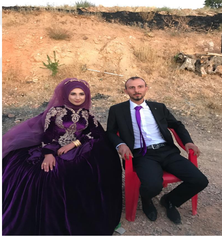
Fotoğraf: Köy düğününde modern çizgilere sahip giyimleri ile gelin ve damat.

“Köyde oldu düğünüm, kara çarşaf giyindim. Dışardan gelenler gelinlik giyiniyorlardı ama köyün içindekiler giyinmezlerdi. Babam hiç istemediği için lafi bile geçmedi.”K17