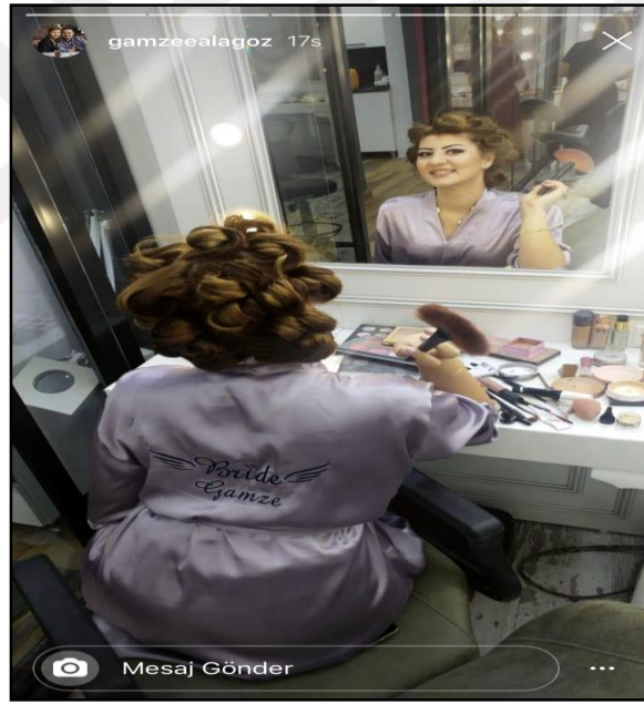
Fotoğraf: Sosyal medya üzerinden düğüne hazırlanma aşamasının paylaşımı.

Geçmişte ve bugün evliliklerde fotoğrafın ayrı bir yeri bulunmaktadır. Geçmiş zamanlarda fotoğraflar bir hatıra niteliğinde iken bugün gösterilmek ve ifşa etmek içindir. Bireyler düğünleri gerçekleştirirken veya daha sonrasında fotoğraflarını kitlelere sunmaktadırlar. Kimi zaman mahrem alanları da açıkça görüntülemektedirler.