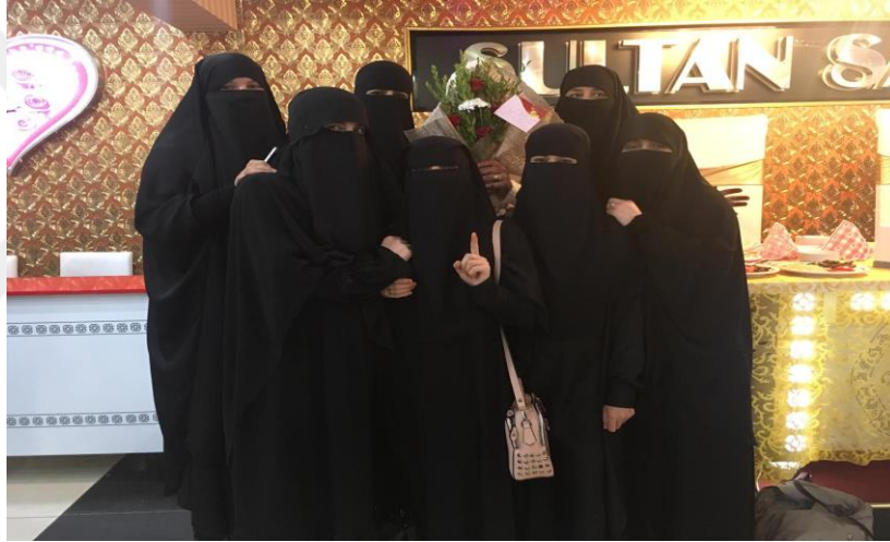
Fotoğraf: Dini cemaate üye kız arkadaşların çektikleri düğün fotoğrafı.

süreçte etkin rol oynamaktadır (Ertit, 2019: 304). Bu doğrultuda muhafazakar hakim siyaset bu durumun ortadan kaldırmak adına cemaatleşmenin kapılarını aralamakta, dini-ahlaki yaşam formunun toplumda devamlılığını sağlamak adına cemaatlerin yayınlamalarına sebep olmuştur. Bu doğrultuda cemaat üyeliğine mensup bireylerin aralarında cemaatin yapısını sağlamlaştırmak adına evlilikler gerçekleştirilmektedir. Modern denilen dönemde bireylerin tercihleri ile eş seçmelerine yoğun olarak rastlanırken, geçmişte ailenin evlilikte baskın yönünü bugün cemaatler üstlenmektedir. Ayrıca mezhepler çatışmasının yerini cemaatler çatışması almaktadır. Düğün törenleri içerisinde de cemaatlerin varlığı hissedilmektedir. Dini bir cemaate katılım gerçekleştiren evlenecek olan çiftin törene katılan arkadaşları ile çektikleri fotoğraf manidardır.