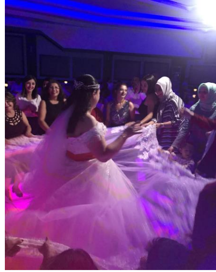
Fotoğraf: Her iki görselde kadınların düğün alanında aktif katılımları sergilenmektedir.

Bireyler gündelik hayatta kapitalist unsurları medya aracılığı ile deneyimlerken salt bir etki söz konusu olamaz. Çünkü bireyler düğün ritüelini gerçekleştirirken sadece piyasanın etkisinde değil, yaşadıkları toplumun ve kültürün etkisine de maruz kalmaktadır. Gelenek ve kültür bir toplumdaki güçlü kaynaklar olmalarına rağmen değişimin hızına engel olamamaktadır. Çünkü kültür, açıkça herhangi bir üretim sektöründeki üretim normlarına uyan bir sanayi haline gelmektedir. Kültürel üretim, bir bütün olarak kapitalist ekonominin ayrılmaz bir parçası olmaktadır (Adorno, 2008:19). Bireylerin düğünlerinde görülen hem kapitalist unsurlar hem de kültürel esintiler birbirleriyle harmanlarak endüstriyel sürece dahil olmaktadır.