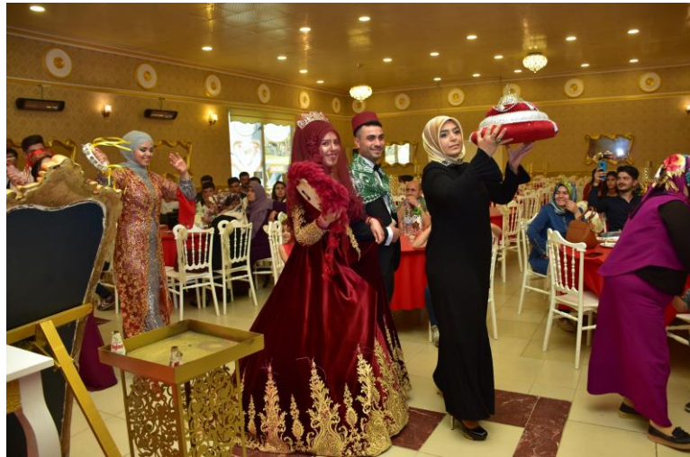
Fotoğraf: Kına gecesinde hem geleneksel hem de modern unsurların bir arada bulunduğu görülmektedir.