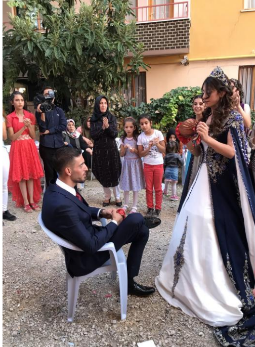
Fotoğraf: Saha içerisinde çekilen bu fotoğraf sokak düğününe ait olup kına gecesinde testi kırılma ritüelini göstermektedir.

İnsanın bilgisinin homojen olmamasının yanında geçmişten getirdiği bilgi stoklarını farklı şekillerde kullanılmasına da rastlanılmaktadır. Günümüzde, kaybolan gelenekleri yeniden oluşturma ve hatta yenilerini inşa etme yönünde belirli bir eğilim görülmektedir. Gündelik hayatın özüne işleyen uzmanlık sistemlerinin yanı sıra, geniş çaplı bir refleksivitenin de etkisiyle, gelenek mantıksal dayanağını yitirmektedir. Bu durum moderniteyi romantik reddediş olarak geriye dönüşten ziyade, iç gönderimli sistemlerin egemenliğindeki bir dünyanın ötesine geçmeye yönelik başlangıç halinde bir hareketin işareti olarak görülmektedir (Giddens, 2014a: 258). Kına gecelerinde gelinin damat etrafında oynaması ve devamında karşısına geçerek testi kırması bunun bir örneği sayılabilmektedir. Bu örnekte geçmişte gelinin damat evine vardığında yaptığı bir uygulama iken bugün düğün salonlarında veya sokak düğünlerinde görülmektedir. İçerisinde şeker bulundurulması bereket sembolü iken günümüzde damadın karşısında kırılarak bir güç sembolisasyonunu da temsil etmektedir.