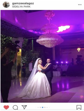
Fotoğraf: Düğün mekanında sahnede dans esnasında çekilen fotoğrafın sosyal medya aracılığıyla sergilenmesi.

“Giyindiğim gelinliğe kadar çok hayalim vardı. Mahalle düğünü yaptık ama kapı önü geniş olması rağmen düzen kuramadık, bir organizasyon yapamadık. Sandalyelerin daha düzenli olmasını, masaların süslenmesini isterdim. Kına gecesinin salonda olmasını isterdim. Işıklandırma yetersiz ve kötüydü, fotoğraflar kötü çıktı.” K16