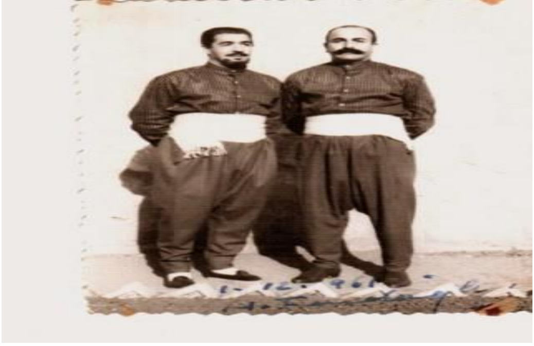
Ek.3. Adana Cezaevinin Bahçesinde çekilen bir fotoğraf (10.12.1968)