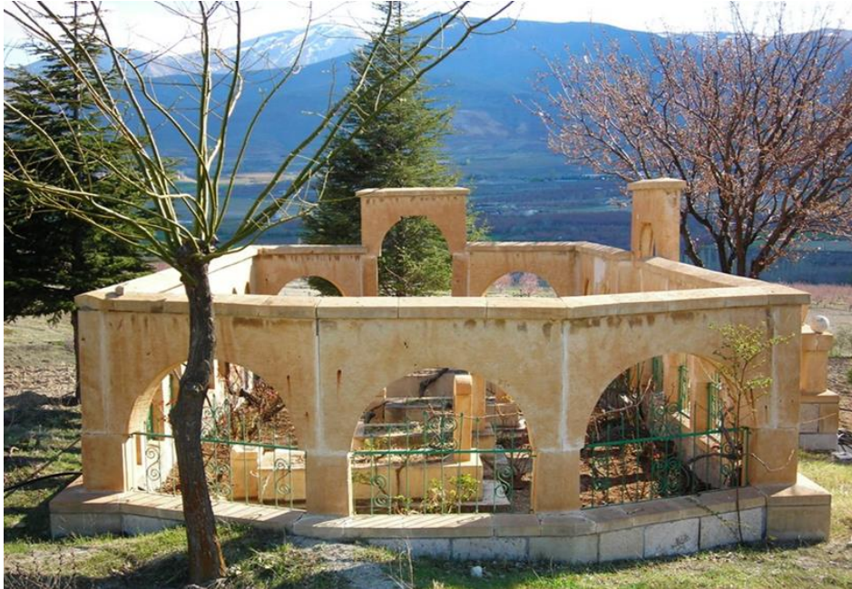
Ek.10. Hamit Fendoğlu'nun, gelini ve iki torunun Malatya'da Battalgazi'ye bağlı Bulgurlu köyündeki aile kabristanı