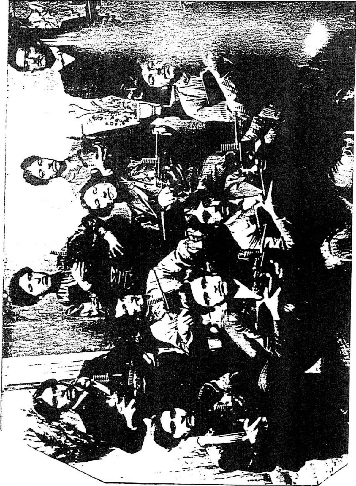
Ermeni Taşnakstutiyun fedatleri.