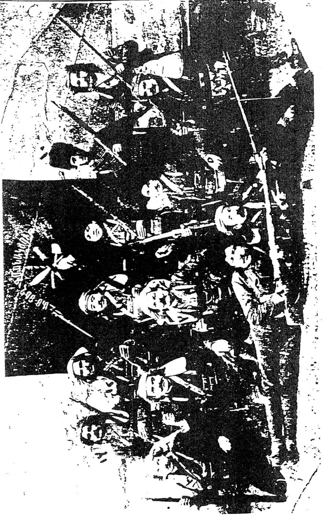
Van Taşnakistiyun çetelerinden bir grup.