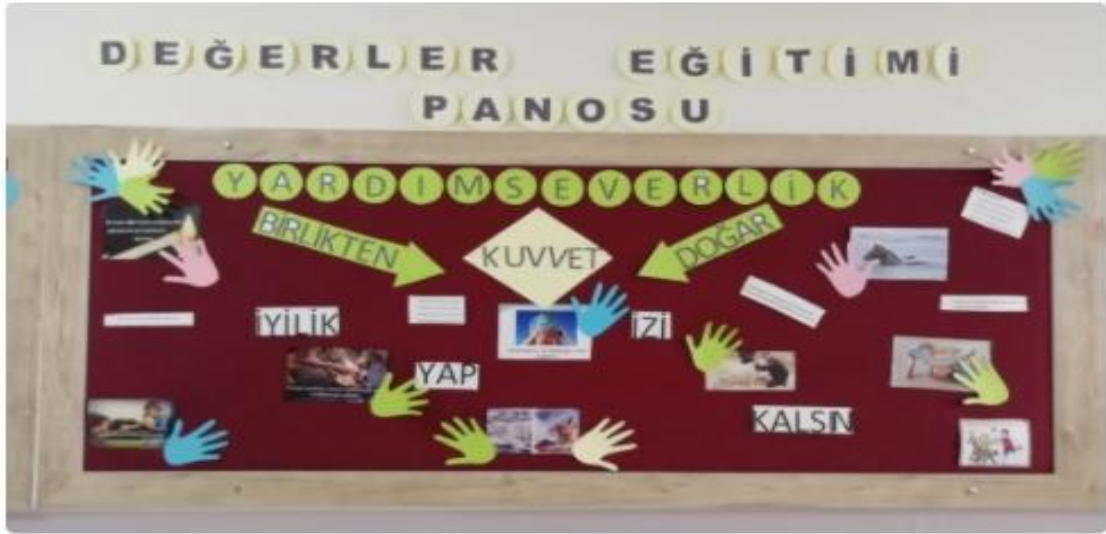
Resim 8: Yardımseverlik değerini konu almış bir pano 69