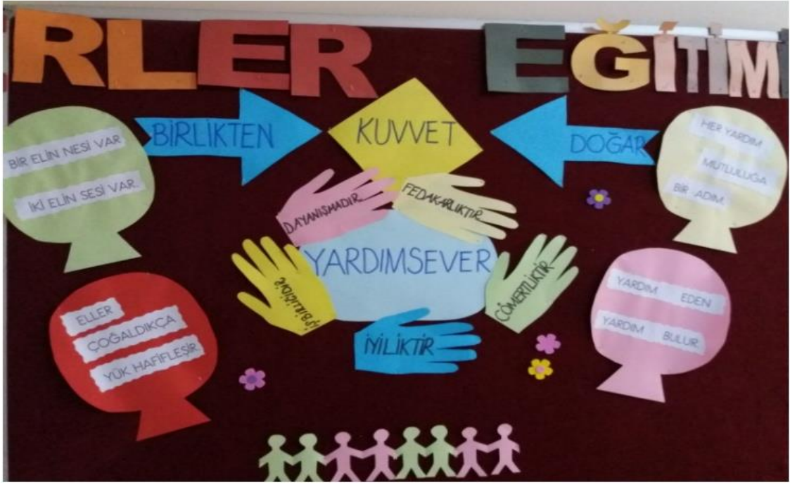
Resim 7: Yardımseverlik değeri üzerine hazırlanmış bir pano örneği 68