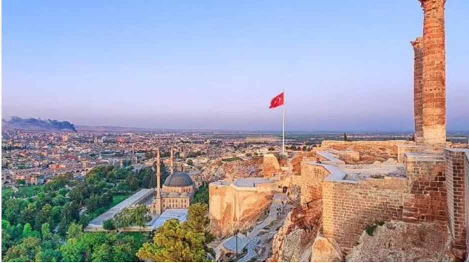
Resim 1. Şanlıurfa 2

Kutsal şehir ve Peygamberler şehri şeklinde bilinir. Hz. İbrahim ile Nemrûd arasında geçen hikâyeye konu olmuştur. Ortadoğu coğrafyasının şekillenmesinde Urfa'nın özel bir yeri vardır. Aynı şekilde Hindistan, Ortadoğu ve Akdeniz ticaret