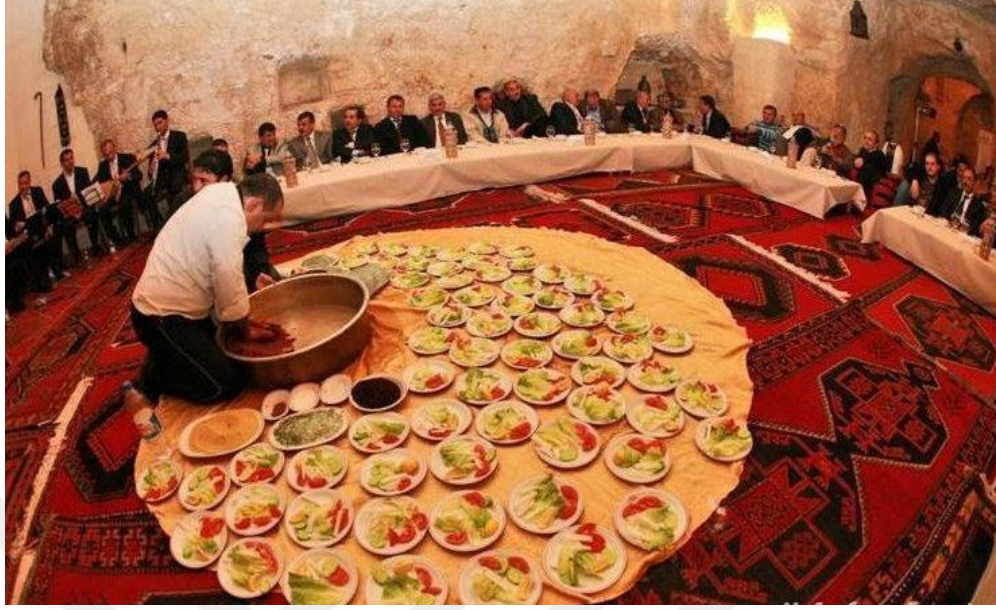
Resim 14. Şanlıurfa Sıra Geceleri 25

Şanlıurfa müziği bugüne kadar halk müziği, klasik Türk müziği ve dinî müzik sahasında önemli hizmetlerde bulunmuştur. Temelini güçlü gelenek üzerine inşa eden Şanlıurfa müziğinde şarkı, türkü, ilahi, uzun hava, hoyrat ve gazellerle beraber tespit edildiği kadarıyla kayıtlı 500 küsür eser bulunmaktadır. Burada şunu belirtmek gerekir ki halk müziği, klasik Türk müziği ve dinî müzik aynı kategoride ele alınmalıdır. Çünkü Şanlıurfa'da icra edilen mûsikî makam mûsikîsi olup bu müzik türleri beraber icra edilmektedir. Bağlamanın yanında ud, kanun, tanbur, cümbüş ve keman gibi Türk müziğinde kullanılan sazlar müzik meclislerinde beraber icra edilmektedir. Geçmişte ekseriyetle, şimdilerde ise kısmen meşklere klasik Türk müziği ile başlanır buralarda kâr, beste, semâî ve şarkılar başta olmak üzere daha sonra türkülere geçilir. Buna göre bu meclislerde ekseriyetle Türk müziğine ait uşşâk, hicâz, muhayyer, segâh, hüzzâm, gerdaniye, sabâ, mahûr, çargâh, karcığâr ve hicazkâr makamları kullanılmaktadır. 26