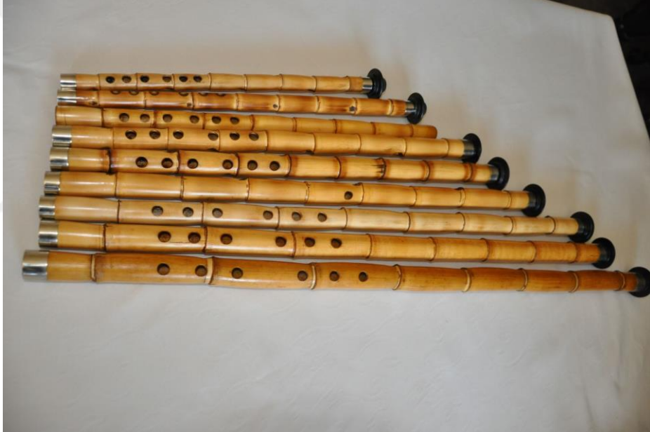
Resim 20. Ney Ailesi 45

Bu neylerden bazılarının gerek uzunluğundan ötürü icrasındaki güçlüğü gerekse ses aralığının günümüzdeki musiki zevkine hitap etmeyişi tercih sebebi olmamış ve isimleri sadece yazılı kaynaklarda geçmiştir. 1894 yılından günümüze kadar gelen yazılı kaynaklarda birbirinden farklı görüşlerde ney akort tabloları oluşturulmuş ve sınıflandırma çalışmaları yapılmıştır. En belirgin sınıflandırmaya göre, birbirleri arasında bir tam ses aralık olan neyler esas neylerdir. Nısfiyeler, nısf Arapça kökenli bir kelime olup Türkçe karşılığı bir bütünün yarısı anlamına gelmektedir. Nısfiyeler görünüm