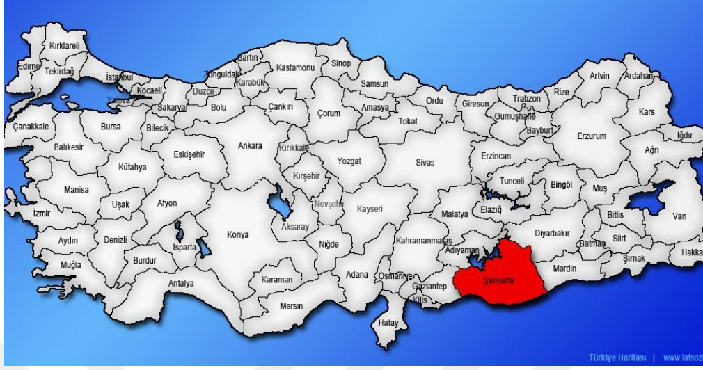
Resim 4. Türki İl Haritasında Şanlıurfa 7

Şehir merkezinin denizden yüksekliği 518, ilin en yüksek noktası olan Karacadağ'ın yüksekliği ise 1.938 metredir. İlin %60,4'ü plato, %22'si dağlık, %16,3'ü ova ve %1,3'ü yayladır. Gaziantep, Adıyaman, Diyarbakır, Mardin ve Suriye ile komşu olan ilin Adıyaman ve Gaziantep sınırlarını aynı zamanda Şanlıurfa'nın en önemli akarsuyu olan Fırat nehri çizmektedir. 8