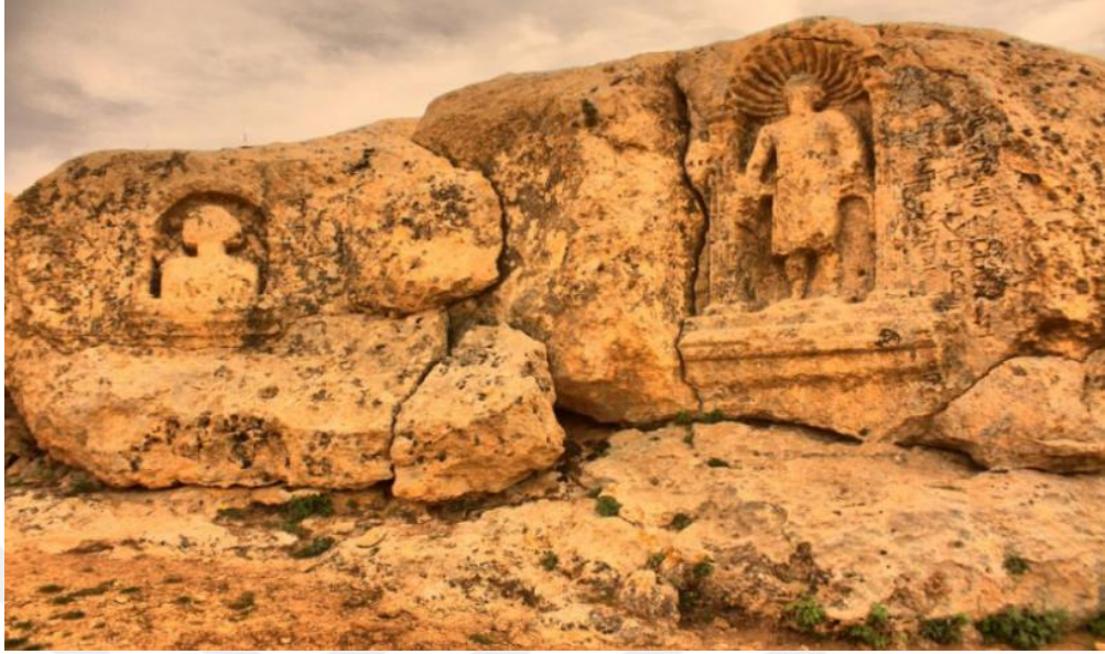
Resim 12. Soğmatar Antik Kenti 22