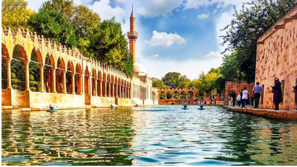
Resim 3. Balıklı Göl 5

anlamını taşıyan Orhai'den geldiği rivayet edilir. Osmanlı döneminde Ruha, daha sonra mahalli bir telaffuz olan 'Urfa' şeklinde söylenmiş, 1987 yılından itibaren de Şanlıurfa adı verilmiştir. 4