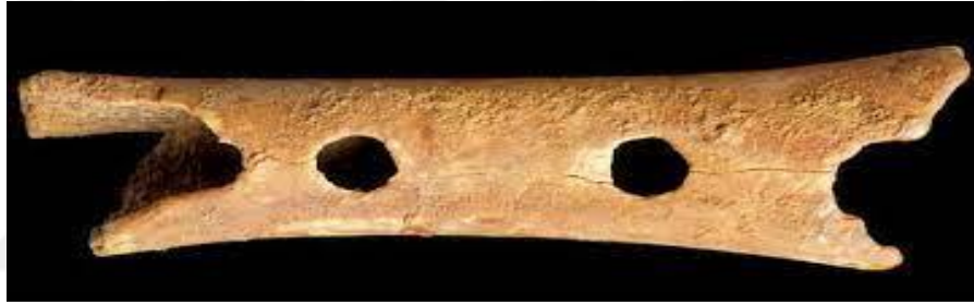
Resim 17. Sümer Nefesli Çalgısı.

Anadolu da bilinen ve yaygın olarak icra edilen yöresel nefesli çalgılar; zurna, kaval, ney, mey ve tulum olarak sayılabilir. Bu çalgıların hepsi Türk halk müziğinde kullanılan çalgılardır. Klasik Türk Müziğinin tek üflemeli çalgısı olan Ney, bu türün en önemli çalgılarından biridir. Sesindeki içli ve mistik özellikler onu aynı zamanda Türk tasavvuf mûsikîsinin baş sazı haline getirmiştir (Yücel’den akt. Sağlambilen, 2014. s. 19).