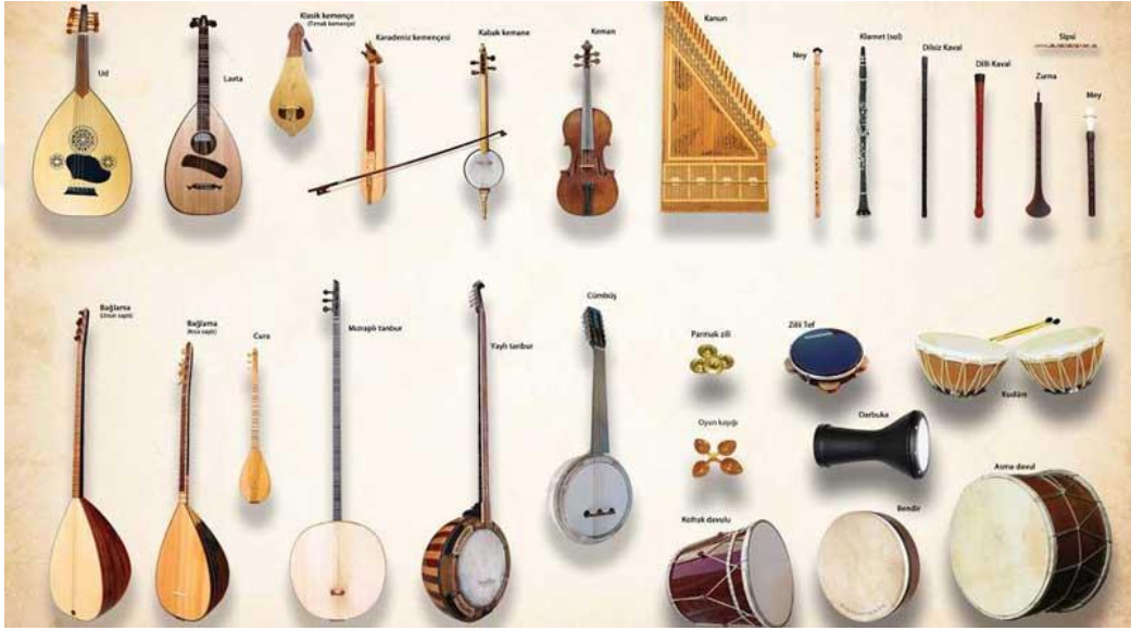
Resim 16. Türk Müziği Çalgıları 30

Türk müziği incelendiğinde gelişimini yüzyıllar içerisinde sürdürdüğü görülmektedir. Türklerin tarih sahnesinde görülmesinden itibaren varlığından haberdar olduğumuz Türk müziği yüzlerce yıl çok zengin bir yapıya bürünmüş ve bünyesinde de birçok çalgıyı barındırmıştır. Bu doğrultuda Türk müziği çalgılarının oldukça çeşitliliğe sahip olduğunu söylemek mümkündür.