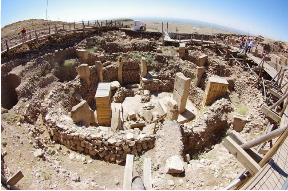
Resim 2. Göbeklitepe 3

Asur, Pers, Makedonya, Roma, Bizans gibi uygarlıkların egemenlikleri altında yaşayan Urfa, Ebla, Akkad, Sümer, Babil, Hitit, Hurri-Mitanni, Arami, Asurlar, Medler ve Persler'in hâkimiyetinden sonra, Makedonyalılar, Romalılar, Selefkoslar, Agbarlar ve Ösrhoene'ler dönemini yaşamış 1094 yılında Selçuklu topraklarına katılmış, 1098'de Haçlı kontluğu idaresine girmiştir. Eyyubi, Memluk, Türkmen aşiretleri, Timur Devleti, Akkoyunlular, Dulkadir Beyliği, Safevilerden sonra da Osmanlı sınırları içine katılmıştır. Urfa kelimesi hakkında kesin bir tarif bulunmamakla birlikte Süryânice'de kale ve pınar