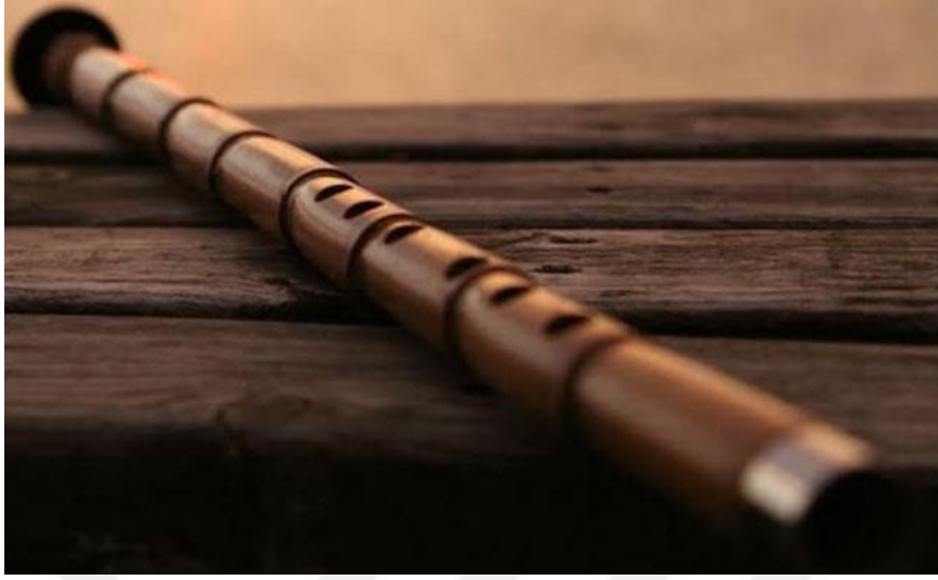
Resim 19. Ney 35

İnsan topluluklarının olduğu her yerde müzik olgusundan bahsedilebilir. Klasik Türk Musikisi'nin enstrümanlarından en önemlisi olan "Ney" çalgısı, Farsça'da kamış anlamına gelen Nay kelimelerinden Türkçe'ye geçmiştir. Ney'i üfleyenlere "neyzen" veya "nâyî" denir. 36 Ney, Kamıştan yapılmış en eski müzik aletlerinden olup İslam kültüründe saygın bir yere sahiptir. 37 İnsan sesine en yakın ses ney'in sesidir. Tasavvufi ekolde Ney kâmil insanı, ney üflemesi ise öldükten sonra dirilmenin sûr sesiyle dirilmeyi ifade eder. 38 Ney, tekke müziği ve din dışı müziğinin ve şairlerin gözünde içinde her zaman saygın yerini korumuştur. Hz. Mevlana'nın tasavvufi anlayışında aşk ve sema'nın var olduğunu biliyoruz. Sema'nın olmazsa olmazlarından biri de neydir ki, Mevlana Mesnevî'sinde "ney" dinleyenlerin, onun sesiyle ulvî duygulara ulaştığını ifade eder. 39 ney maddî manada eğriliği kabul etmediği gibi, manavî anlamda da eğriliği kabul etmez. Arap alfabesi ve Allah lafzının ilk harfi olma niteliğini taşıyan elif harfi her şeyin ilki ve doğruluğu ifade etmesi hasebiyle Ney içinde şekil olarak doğruluğa işaret etmektedir. 40