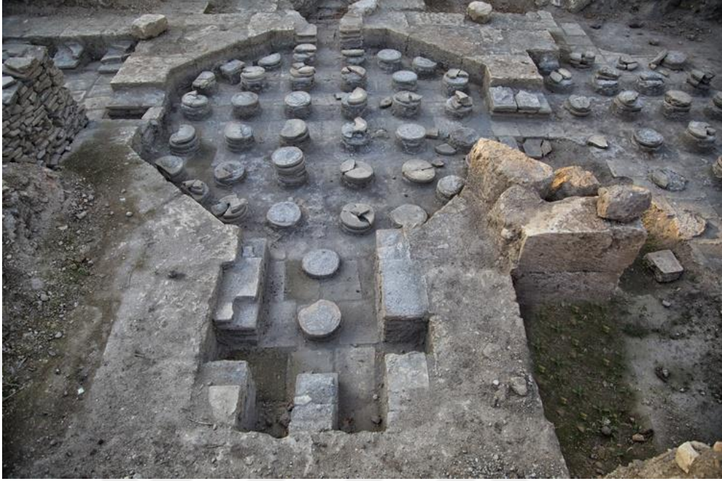
Resim 9. Şanlıurfa’da Yer Alan Roma Dönemi Hamam Kalıntısı 17