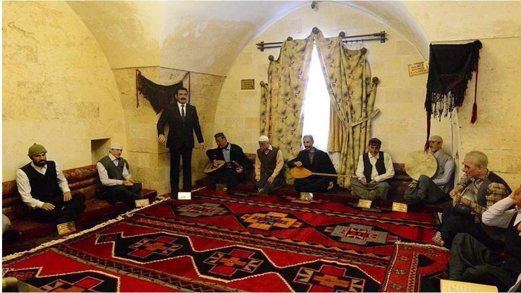
Resim 15. İbrahim Tatlıses Müzik Müzesi 29

Köklü bir mûsikî kültürüne sahip olan Şanlıurfa'da çok sayıda mûsikîşinas yetişmiştir. Osmanlı döneminde saraydan bazı mûsikîşinasların Urfa'ya gönderilmesi ve bunların mûsikî birikimlerini yöre insanlarıyla paylaşmaları, Urfa Mûsikîsi'nin gelişmesine katkı sağlayan unsurlardan biri olmuştur. Osmanlı döneminde mûsikîşinaslarla alakalı yazılan ilk biyografik eserde Urfalı Yusuf Nâbî Efendi'nin yer alması, Urfa Mûsikîsi adına önemli bir husustur. Sultan IV. Murat zamanında yaşamış ve ona eser icra etmiş olan Kuloğlu Mustafa, Urfa'daki “Kılıçlı” 28 makamının kendisine nispet edildiği bir hânende; Şeyhoğlu ise XVIII. asır Türk Dinî Mûsikî bestekârları arasında yer alan Şanlıurfalı musikişinaslardır.