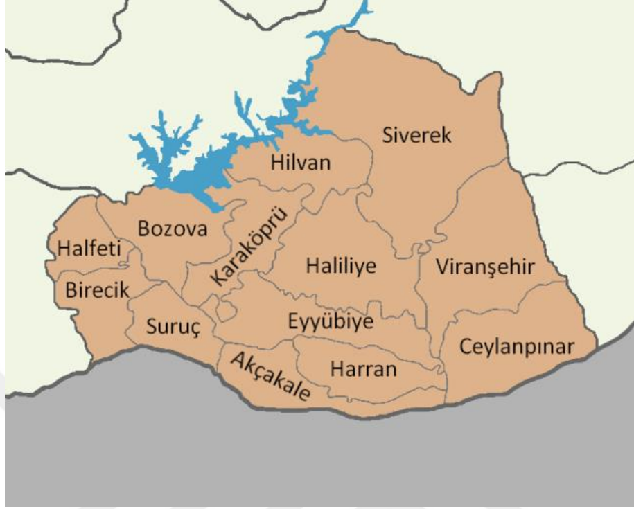
Resim 5. Şanlıurfa İli Haritası 9

Güney komşusu Suriye ile Türkiye'yi birbirine bağlayan üç sınır kapısı (Akçakale Mürşitpınar ve Ceylanpınar sınır kapıları) Şanlıurfa'dadır. İlin kuzeybatısında Karkamış, Birecik ve Atatürk Baraj gölleri bulunmaktadır. Karasal iklim özelliklerinin görüldüğü Şanlıurfa'da ortalama yağış miktarı 622,7 kg/m 2 , ortalama sıcaklık ise 19,3°C olarak ölçülmüştür. (Şanlıurfa Valiliği, 2018) 10