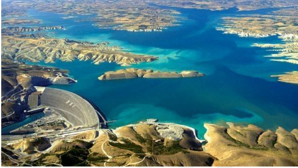
Resim 6. Atatürk Barajı 11