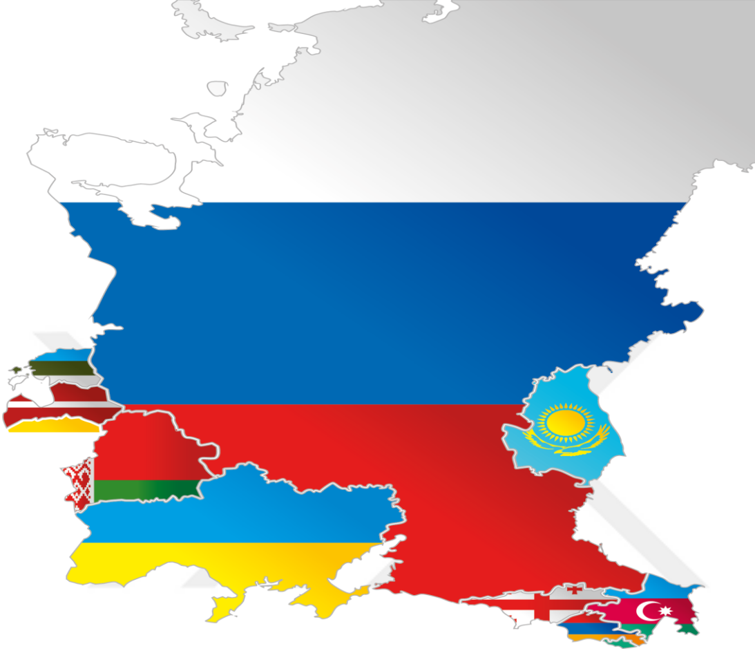
Harita 4.1. Transkafkasya Ülkeleri ve Rusya