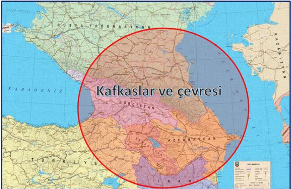
Harita 2.2. Gney Kafkasya Jeopolitiđi

Kaynak: Alpar G. Kafkasya Jeopolitiđi ve İnan Tarihinin Gizli řifreleri, 2022.03.29, Stratejik Dřnce Enstits, https://www.sde.org.tr/guray-alpar/genel/kafkasya-jeopolitigi-ve-iran-tarihinin-gizli-sifreleri-kose-yazisi-18707