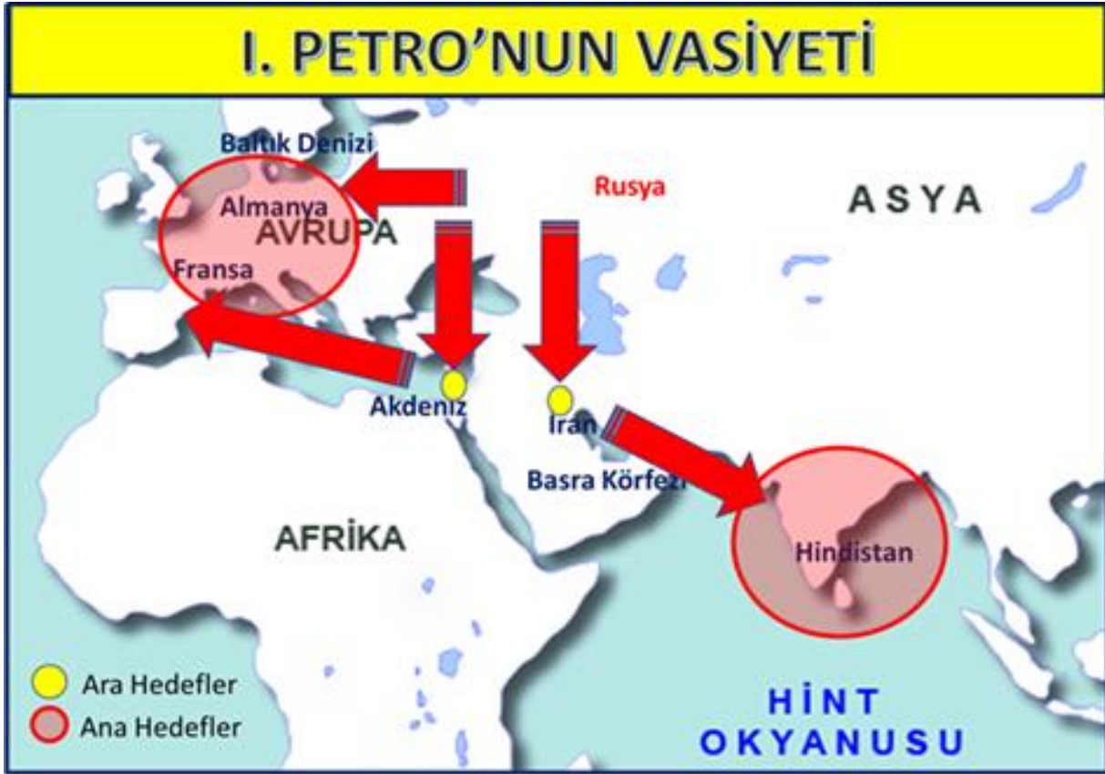
Harita 3.1. Petro'nun Vasiyeti