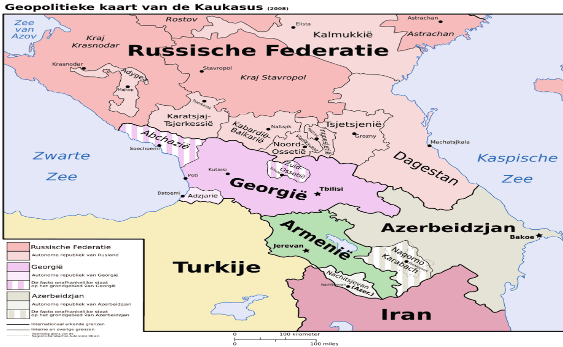
Harita 2.3. Dağlık Karabağ