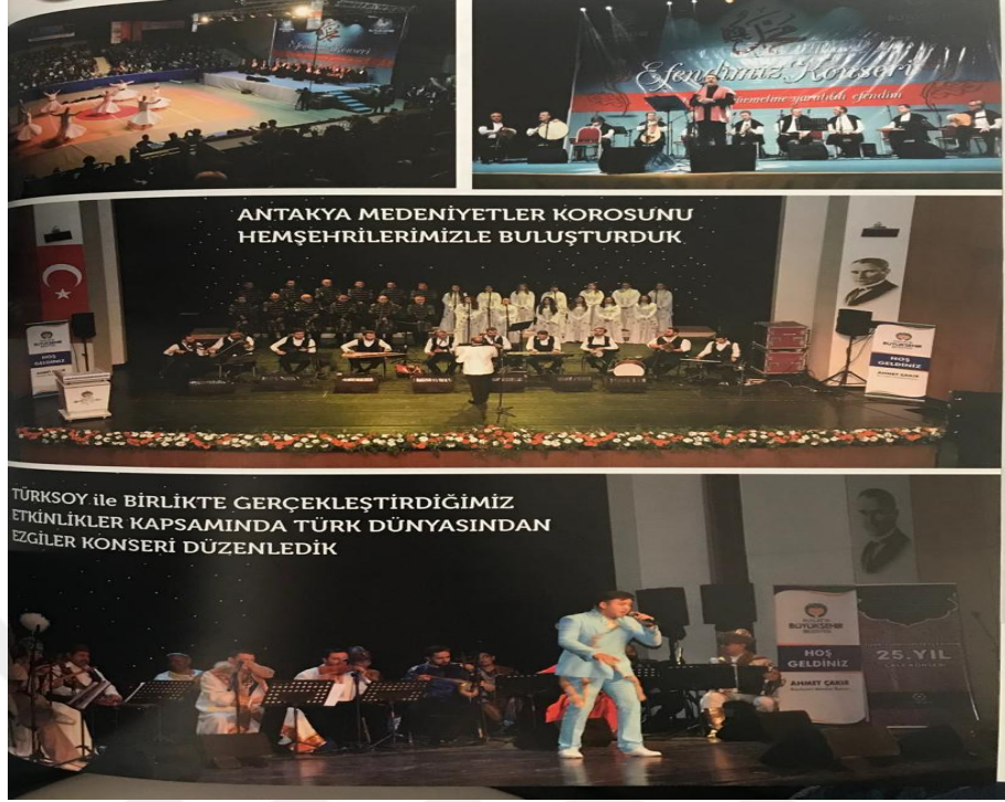
Resim 9. Malatya Büyükşehir Belediyesi Sanat Merkezi Antakya Medeniyetler Korosu Konseri

Yerel yönetimlerin farklı medeniyetlerdeki müzik kültürünü, gurupları ve sanatçıları kendi toplumuna konserler aracılığı ile ulaştırması düşük gelir düzeyindeki birçok vatandaşın da rahat bir şekilde ulaşmasını sağlamaktadır. Bu da Malatya'daki yerel yönetimin imkânlarının bir bölümü ile bu noktaya eğilmesi ve yönlenmesi, kültürel anlamda topluma özgün bir katkı sağlayacaktır.