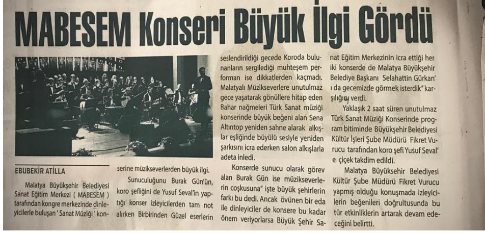
Resim 4. Malatya Büyükşehir Belediyesi Sanat Merkezi Sanat Müziği Konseri

Türk Sanat Müziği; Belli bir makamda koro veya solo olarak okunan, Klasik Türk Müziği enstrümanları eşliğı ile icra edilen, bir müzik çeşididir. İçerisinde de Türk kültürüne özgü motifleri ve makamları barındırmaktadır. Dünya üzerindeki etkisi ile iz bırakan sayılı müzik türleri arasındadır.