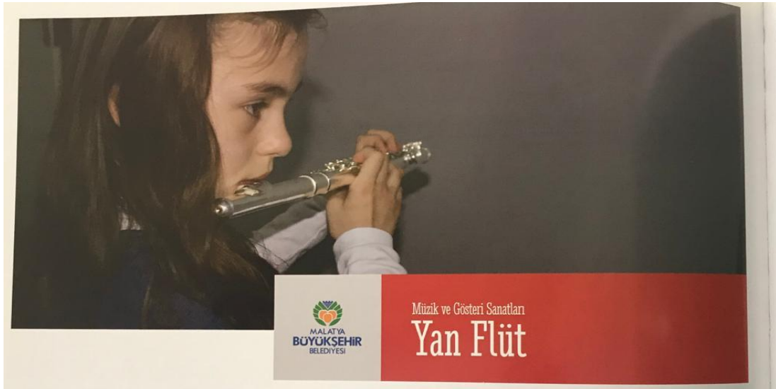
Resim 17. Malatya Büyükşehir Belediyesinin kurmuş olduğu Sanat Merkezinde Yan Flüt Eğitimi

Bundan dolayı da hafıza ve beceri olarak hem daha seri şekilde öğrenim gerçekleştirip hem de günlük hayatlarında bu becerilerin kendilerine sunmuş olduğu katkıları, diğer becerilere de aktarılmasını sağlarlar.