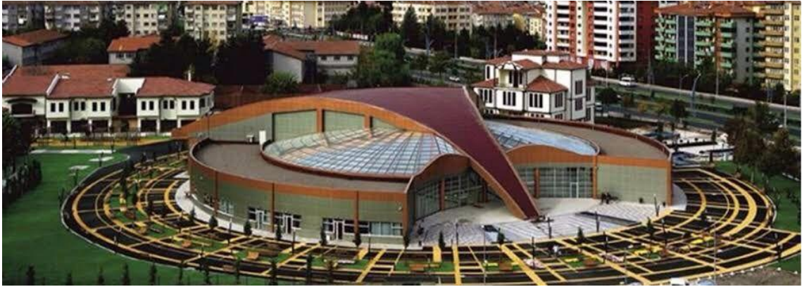
Resim 21. Malatya Büyükşehir Belediyesi Sanat Merkezi 3

Malatya Büyükşehir Belediyesi'ne bağlı Sanat Merkezi, Semt Konakları ve bunların yanı sıra Musiki Cemiyeti, Gençlik Merkezi gibi birçok kurum alt yapı desteğine önem vermekte ve sanatın topluma, güvenilir bir şekilde ulaşmasına katkı sağlamaktadır.