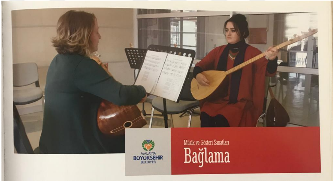
Resim 19. Malatya Büyükşehir Belediyesinin Kurmuş Olduğu Sanat Merkezinde Bağlama Dersi

Ney gibi özel enstrümanları her yerde öğrenmek mümkün olmadığı gibi öğreneceğimiz birçok özel kurs merkezinin de ücreti oldukça fazladır. Fakat Türk müziğini öğretip bu şekilde maddi çıkar gözemeksizin hizmet veren yerel yönetimlerin topluma faydası tartışılmazdır.