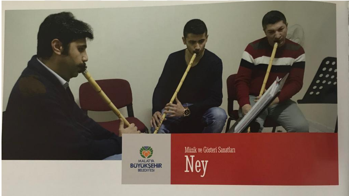
Resim 18. Malatya Büyükşehir Belediyesinin kurmuş olduğu Sanat Merkezinde Ney Kursları

Flüte üflenmesi gereken nefesin kontrolü için sürekli egzersiz yapmak çok önemlidir. Bunun yanı sıra alt ve üst dudakların simetrik olması gerekir. Bunun sebebi ise; alt ve üst dudaklardan ağız bölümüne destek sağladığı için nefesin dışarı kaçmaya imkân bulamamasıdır. Yan flüt icrasının diğer enstrüman icralarında sağlanan kazanımların yanı sıra doğru ve derin diyafram nefesi alma kabiliyetini de geliştirmesidir.