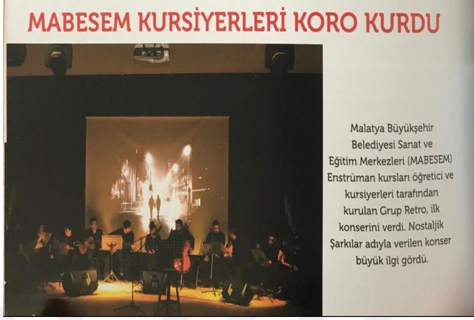
Resim 11. Malatya Büyükşehir Belediyesi Sanat Merkezi Retro Konseri

Belediyeler kendi verdiği kurslarda yetiştirdiği öğrencilere de olanak sağlayarak sahne deneyimi yaşamalarına, maddi ve manevi destek olması ile de şehirde Türk müziğimizin gelişimine katkı sağlamalı ve sanatın gelişmesine destek olmalıdır. (resim 9 da ki gibi.) Malatya da ki yerel yönetimler sanat anlamında, gençlerin gelişmesi için kurmuş olduğu sanat merkezinde Türk Müziğimizin öğrenilmesinde oldukça katkı sağlamaktadır. Öğrencilere yol gösterdiği gibi, üniversitelerin ilgili bölümlerinden mezun olmuş birçok müzisyene de iş imkânı sunarak hem kendilerini daha iyi şekilde geliştirip, öğretmenliğe ilk adımı atmalarını sağlayıp hem de nitelikli müzisyenler yetiştirmesine fırsat sağlamıştır.