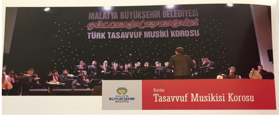
Resim 14. Malatya Büyükşehir Belediyesi Sanat Merkezi Tasavvuf Konseri

Tasavvuf; yaratıcıyı tanımaya çalışma ve kendini Allah'ın yoluna adama sanatı olarak özetlenebilir. Tasavvufun genel amacı insanı ruhen huzura ve ihsana kavuşturmadır.