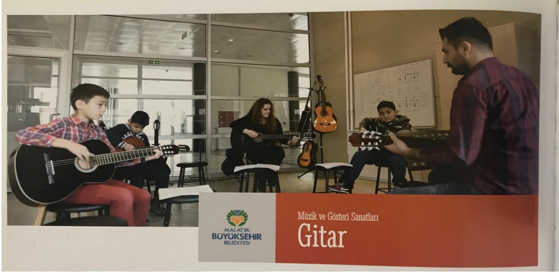
Resim 15. Malatya Büyükşehir Belediyesinin kurmuş olduğu Sanat Merkezinde Gitar Kursu

topluma, kültüre, sanata kazandıracak imkânlar sağlaması ve bunu her toplumun sosyogelenek seviyesine yayabilmesi çok önemlidir.