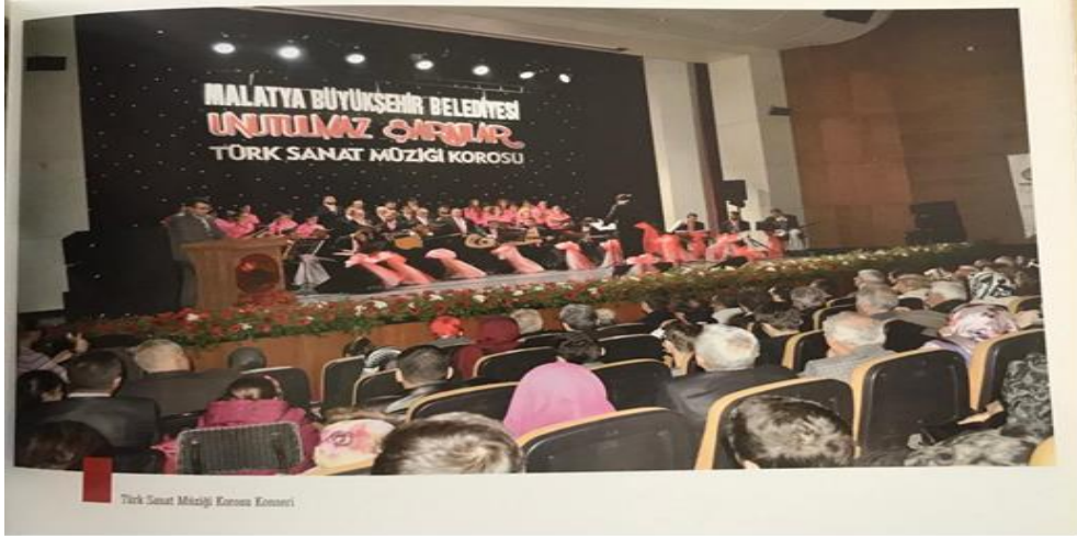
Resim 5. Malatya Büyükşehir Belediyesi Sanat Merkezi Sanat Müziği Konseri