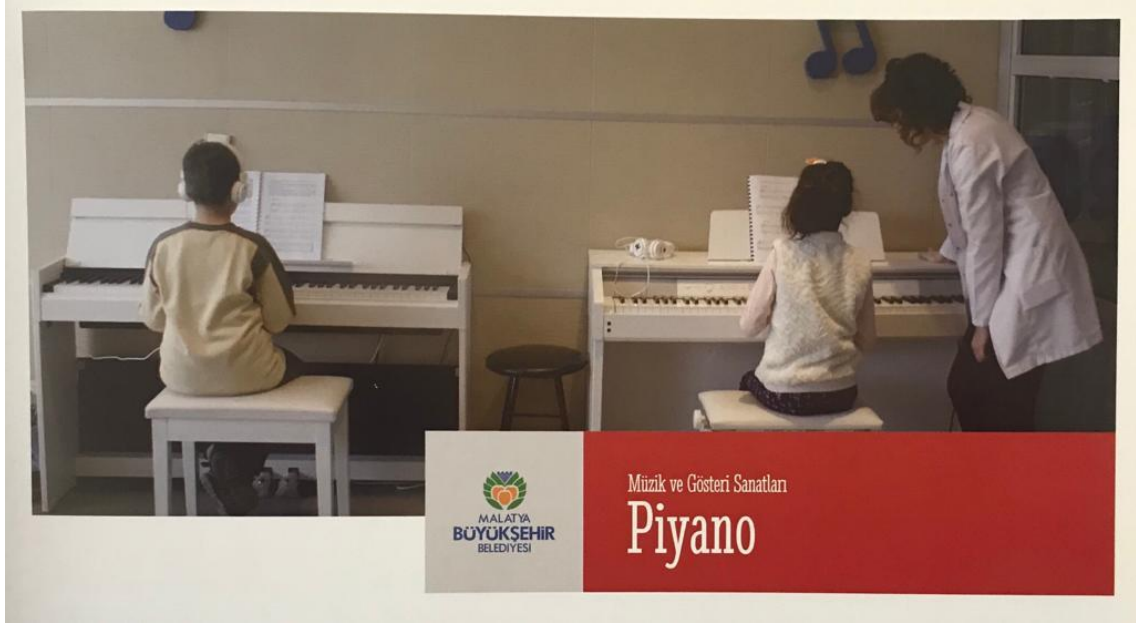
Resim 20. Malatya Büyükşehir Belediyesinin Kurmuş Olduğu Sanat Merkezinde Piyano Kursu

şekilde icra edilen enstrümanlar arasındadır. Yerel yönetimler, vermiş olduğu ücretsiz bağlama kursları ile özellikle genç nesillerin Türk halk müziği tanışmasına imkan sağlamaktadır.