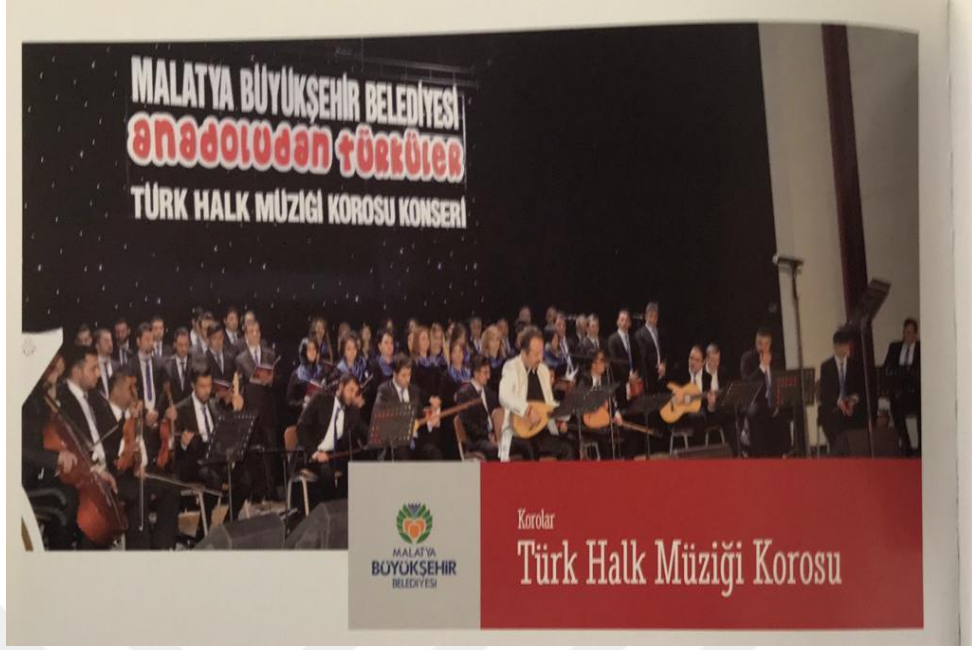
Resim 7. Malatya Büyükşehir Belediyesi Sanat Merkezi Halk Müziği Konseri