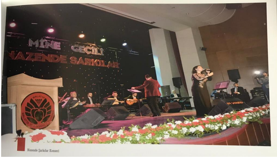
Resim 12. Malatya Büyükşehir Belediyesi Sanat Merkezi Mine GEÇİLİ Konseri

Sanata yapılan yatırım; bir şehrin her alanda gelişme hızını artırmaktadır. TRT sanatçıların ve halka mâl olmuş sanatçıların konserlerine gidebilmek birçok insan için maddi olarak zordur. Yerel yönetimlerin bu tür konserleri ücretsiz olarak halkla buluşturması, bu açıdan bakıldığında eşsiz bir fırsat olarak öne çıkmaktadır.