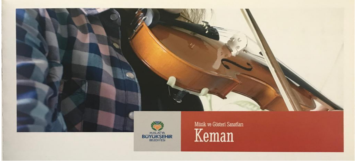
Resim 16. Malatya Büyükşehir Belediyesinin kurmuş olduğu Sanat Merkezinde Keman Kursu

Keman çalmak başlı başına üst düzey bir konsantrasyon gelişimi sağlar. Bunun yanında unutkanlığı önlerken algılarımızı açmaya yarayan iyi bir hobidir. Keman kursuna başlayan öğrenciler bir yandan enstrümanlarına yoğunlaşırken bir yandan da Türk Müziği'nin makamlarını öğrenirler.