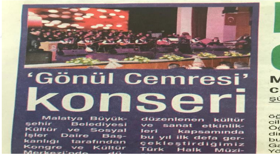
Resim 8. Malatya Büyükşehir Belediyesi Sanat Merkezi Halk Müziği konseri

Halk müziğinde, farklı yörelerimizden türkülerin, yerel ağız ve formlarda halkla buluşturulması ve bu sayede özgün tavırların daha iyi öğrenilerek yayılması açısından, yerel yönetimlerin yapmış olduğu konserlerin faydası yadsınamaz.