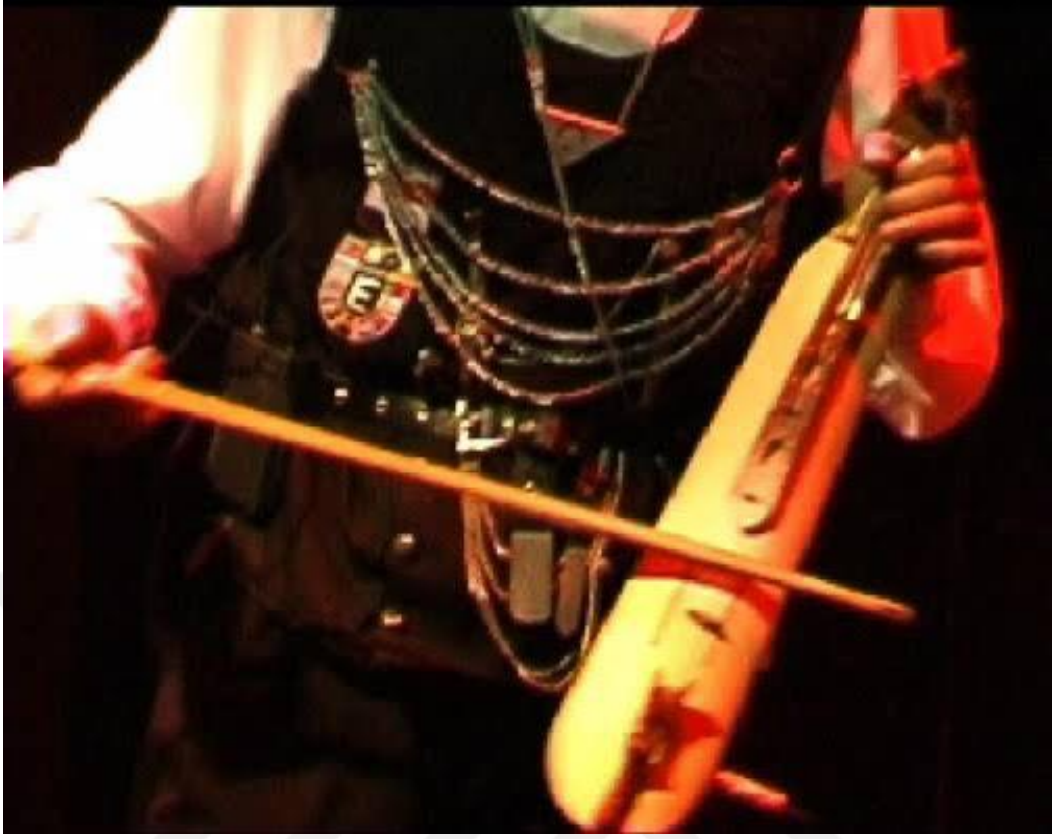
Resim 3 Karadeniz Kemeçesi 2

Karadeniz kültürünün vazgeçilmez enstrümanları arasında olan kemeçe farklı toplumlara da sesiyle etkisi altına alabilir.