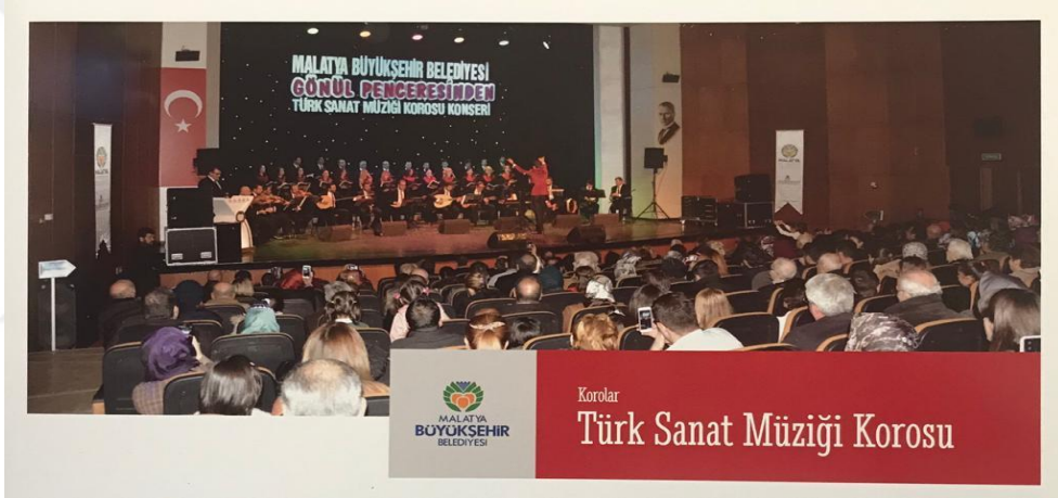
Resim 6. Malatya Büyükşehir Belediyesi Sanat Merkezi Sanat Müziği Konser

Yerel yönetimlerin sağladığı konser faaliyetlerine katılan halkın, Türk Müziğinin nitelikli icrasına daha rahat ulaşması, kentte müzikal kültürün yayılması ve gelişimine önemli katkı sağlamaktadır.