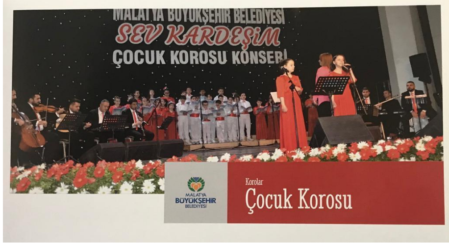
Resim 10. Malatya Büyükşehir Belediyesi Sanat Merkezi Çocuk Korosu Konseri

Tüm müzik otoriteleri müzik eğitiminin küçük yaşlarda başlaması gerektiğini vurgulamaktadır. Fakat yüksek eğitim maliyetleri, düşük gelir gurubundaki birçok ailenin çocuklarına gerekli ve düzeyli müzik eğitimi aldirabilmesine mani olmaktadır. Bu nedenle; bünyesinde çocuk korusu oluşturan yerel yönetimler aynı zamanda yukarda bahsi geçen ücretsiz müzik eğitimi imkânını da muhataplarına sunmuş bulunmaktadır.