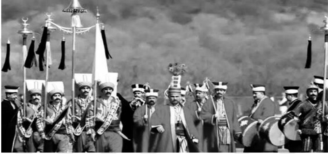
Resim 2 Mehter Takımı 1

Mzik adeta bir astar gibi hayatımızın her alanına ekilmiş bulunmaktadır. Bir anne bebeęini uyutmak iin ninni sylerken savařmaya hazırlanan bir ordu ise dřmanına korku salmak iin tumba ve davullarla yksek volml ritimler tutar.