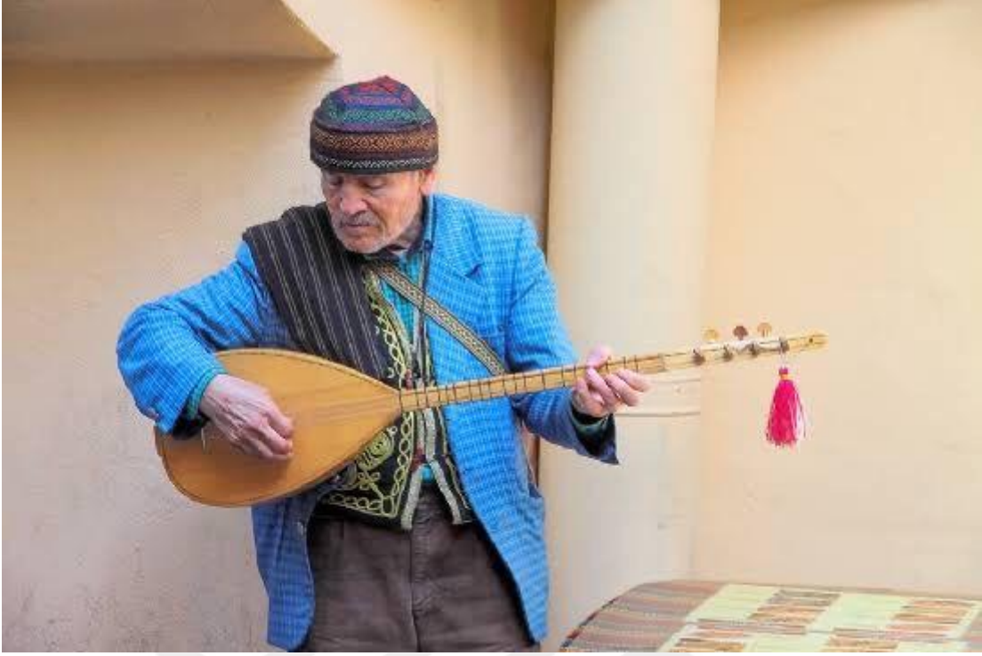
Resim 1

Aslında bu kalpten gelen sestir. Herhangi bir kalıbı yoktur. İnce nüanslar saklı ve bir o kadar da açıktır. Sıradanlıktan sıyrılan en sade şekliyle karşındadır. Çirkin olanı güzel bir ahenkte estetik haliyle kalbinde somutlaştırır. Sanatın evrensel oluşu da bundandır. Dilini bilmediğin bir yerde bile dilin olur. Tutabildiğin bir el. Attığın fırça darbessin de gözün, çaldığın her Melodi de kulağın olur. Bu yönüyle sanat engin bir deniz gibidir. Okyanusa atılan olta misali her atışında bir heyecan yaşarsın. Her şeyin başlangıcı olup son noktayı da hissettirdikleriyle sonlandırır. İnsanların çevresi ile etkileşim içinde olmasını ve daha duyarlı olmasını sağlar. Düşüncelerini özgürce aktarması yolunda topluma ışık tutan sanat, insana ve çevresine değer katar. Yüz yıllar boyunca ülkemizde yaşayan Anadolu insanı saflığı, temizliği, derdini, hüznünü türkülerle dile getirmiştir. Birçok kerpiç evin duvarını süsleyen bağlama, nasırlı bir elin ince dokunuşları ile hayat bulup, sohbetlere anlam katmış ve türküler eşliğinde insanları bir çatı altında toplamıştır.