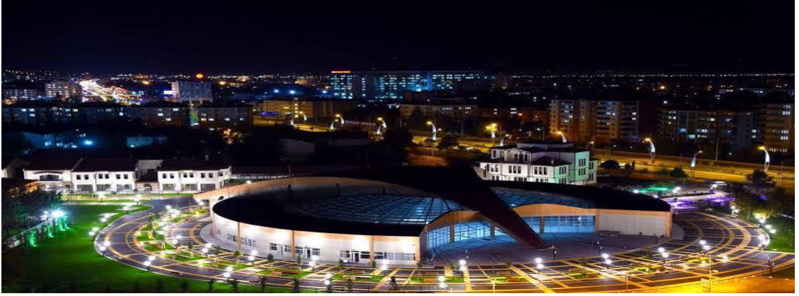
Resim 22. Malatya Büyükşehir Belediyesi Sanat Merkezi 4